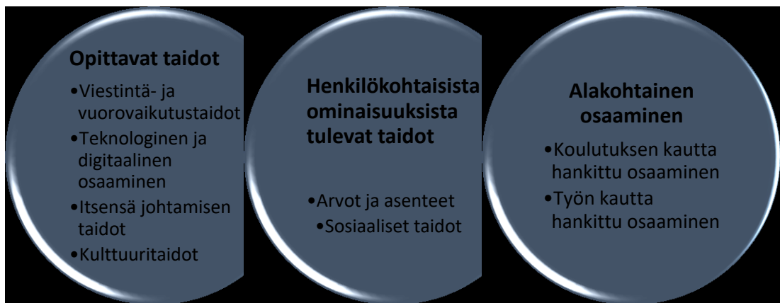
Kuvio 3. Esimiesten näkemys tämän päivän olennaisista työelämätaidoista