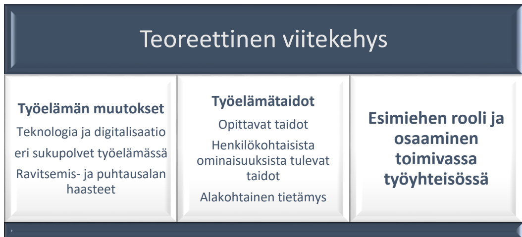
Kuvio 1. Tutkimuksen teoreettinen viitekehys