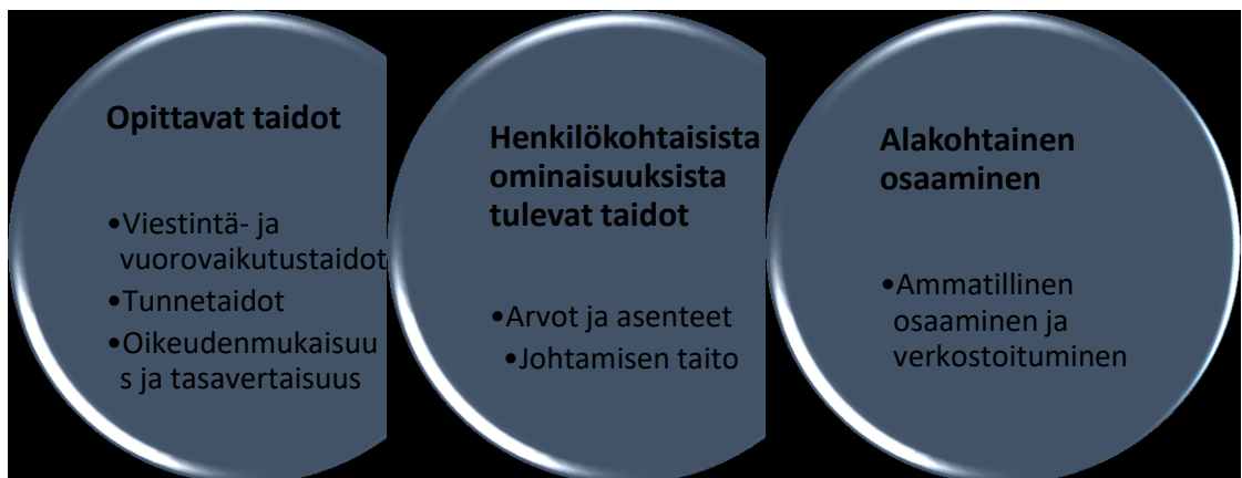
Kuvio 4. Esimiehiltä vaadittavat taidot

ominaisuuksista tuleviin taitoihin ja alakohtaiseen osaamiseen. Näiden alle tulevat taidot valikoituivat vastauksista hieman eri tavalla. Opittavien taitojen alle nousivat viestintä- ja vuorovaikutustaidot, tunnetaidot, oikeudenmukaisuus ja tasavertaisuus. Henkilökohtaisista ominaisuuksista tuleviin taitoihin nousivat arvot ja asenteet sekä työntekijöiden huomioimisen ja johtamisen taito. Alakohtaiseen osaamiseen puolestaan nousivat ammatillinen osaaminen ja verkostoitumisen taidot.