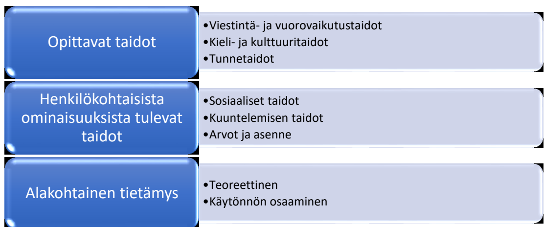
Kuvio 2. Työelämätaitojen kolme tasoa (Lappalainen 2016, muokattu)

Seuraavissa luvuissa käsitellään tarkemmin työelämätaitoja Lappalaisen (2016) jaottelun mukaan. Kuviossa 2 havainnollistetaan Lappalaisen jaottelun mukainen työelämätaitojen kolme tasoa, joita käytetään myös tämän tutkimuksen pohjana. Tutkimuksessa on otettu mukaan myös Nykäsen ja Tynjälän sekä Hanhisen jaottelua täydentämään työelämätaitojen käsitteitä. Lappalainen jakaa opittaviin taitoihin viestintä- ja vuorovaikutustaidot, kieli- ja kulttuuritaidot sekä tunnetaidot. Henkilökohtaisista ominaisuuksista tuleviin taitoihin puolestaan tulevat Lappalaisen jaottelussa sosiaaliset taidot, kuuntelemisen taidot sekä arvot ja asenne. Alakohtaiseen tietämykseen tulevat teoreettinen eli koulutuksen kautta hankitut taidot ja käytännön kautta opitut taidot.