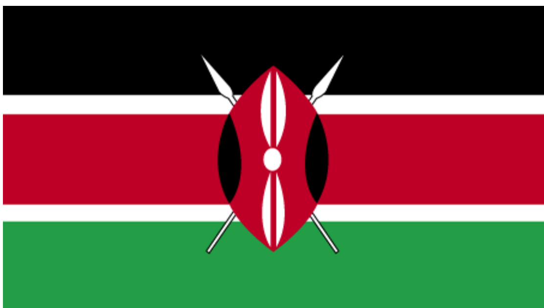
KUVA 1: Kenian tasavallan lippu (The World Factbook 2012)

Kenian lipun musta väri symboloi väestön valtaosaa, punainen väri vapaustaisteluissa vuodatettua verta, vihreä merkitsee luonnonvaroja ja valkoinen tarkoittaa rauhaa. Suuri kilpi ja keihäät symboloivat vapauden puolustamista. (The World Factbook 2012.)