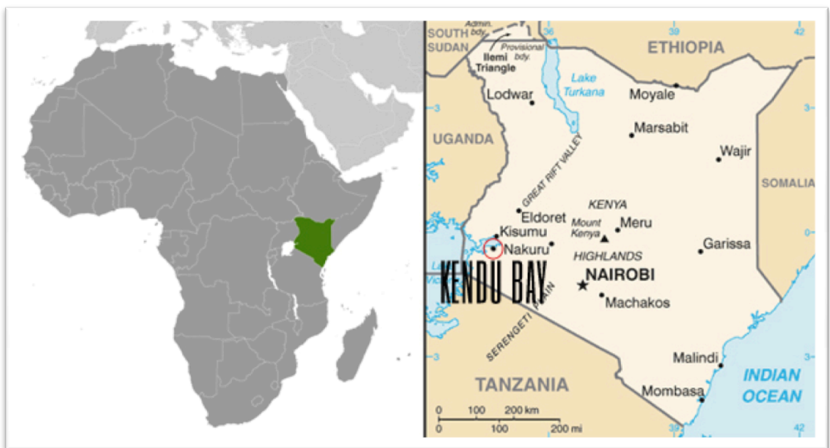
KUVA 2: Afrikan ja Kenian tasavallan kartta (The World Factbook 2012)

Vuonna 2009 Kendu Bayn asukasluku oli 14 747 (Kenya National Bureau of Statistics 2009), mutta paikallisten arvioiden mukaan kylässä ja sen välittömässä läheisyydessä asuu yli 30 000 ihmistä. Kendu Bayksi luettava alue asumuksineen on varsin laaja asukasmäärään nähden. Koska Kendu Baysta on työlästä löytää juurikaan enempää opinnäytetyömme kannalta olennaista faktatietoa, pohjaamme loput päätökset huhtikuussa 2012 tehtyyn tutkimusmatkaamme.