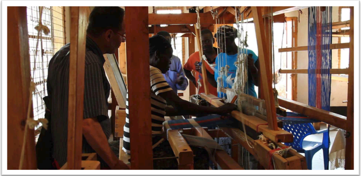
KUVA 4: Kanvadhian Awach Handicraft Group –ryhmän käsityöpaja

alojen työpajoja esiintyy lukuisasti Kendu Bayn pääkadun varrella sekä esimerkiksi paikalliselle sairaalalle johtavalla tiellä. Nämä yritykset työllistävät keskimäärin arviolta 1-5 ihmistä työpajaa kohden.