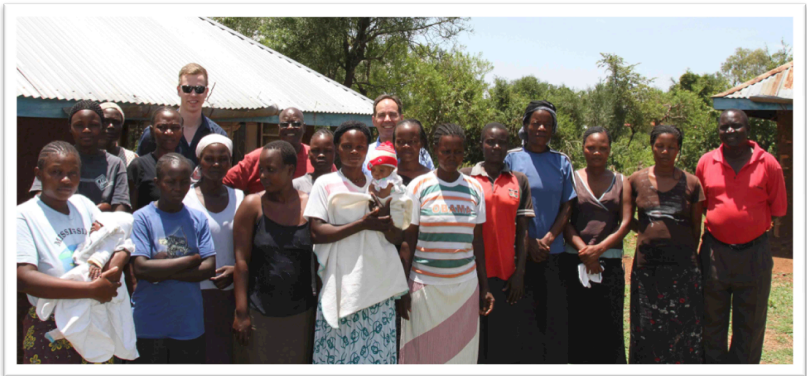
KUVA 8: Kendu Maguti Young Married Adolescent Group –ryhmän luona vierailu

Wekesan ja Ojijan mukaan rahoitusjärjestöjen pienlainojen ansiosta viime vuosina kasvava trendi maataloudessa on ollut perustaa osuuskuntamaisesti toimivia yhteistyöryhmiä suuremman mittakaavan ja taloudellisen hyödyn saavuttamiseksi. Esimerkiksi Kendu Maguti Young Married Adolescent Group –ryhmän tapauksessa ryhmä on vuokrannut viljelysmaan, mutta Oling Kombe Women Group –ryhmän tapauksessa taas naapurusto on ryhtynyt yhteistyöhön keskenään ja perustanut työryhmän hyödyntääkseen tehokkaammin yhteisiä resurssejaan. Selvityksemme mukaan työryhmiin kuuluu tavallisesti 10 – 20 henkeä ja menestyneimmät ryhmät ovat jopa luoneet ja kirjoittaneet ylös yhteiset toimintasäännöt, joita kaikki osakkaat ovat sitoutuneet noudattamaan kuten Kendu Maguti Young Married Adolescent Group –ryhmän tapauksessa. Tapaamiemme rahoitusta myöntävien viranomaisten, Wekesan ja Ojijan, mukaan tulokset lainaohjelmissa vastaaville ryhmille ovat olleet lupaavia ja rohkaisevia. Omat haastattelumme tapaamiemme ryhmien kanssa tukivat tätä käsitystä.