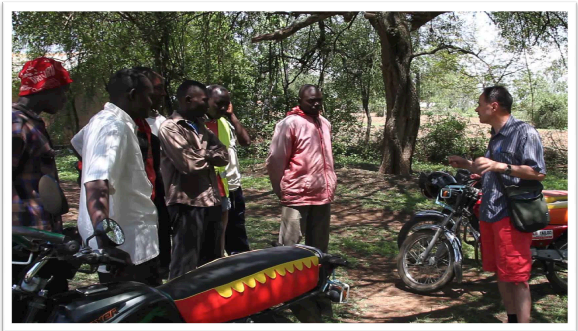
KUVA 7: Kendu Bay Motorbiker Commuters –ryhmä

Moottoripyörätaksien liiketoimintamallille on tavanomaista, että yrittäjät omistavat useampia moottoripyöriä ja vuokraavat niitä sitten työntekijöiksi otettaville kuljettajilleen. Moottoripyörätaksien kuljettajista koostuvan Kendu Bay Motorbiker Commuters –ryhmän jäsenet kertoivat, että he maksavat ajoneuvojen omistajille noin neljän euron suuruista päivävuokraa. Kuljettajat saavat itse pitää kaikki sen yli menevät päiväansiot, joten oma aktiivisuus palkitaan. Moottoripyörien omistajat ovat vastuussa moottoripyörän huoltokustannuksista, mutta kuljettaja vastaa polttoainekuluista. Keskimääräisesti kuljettajat kertoivat tienäänsä kuudesta kahdeksaan euroa päivässä, joka on kohtuullinen päiväansio Kendu Bayn mittakaavassa. Luultavasti moottoripyörätaksien määrää pystyttäisiin vielä hieman kasvattamaan alueella lisätyöpaikkojen luomiseksi.