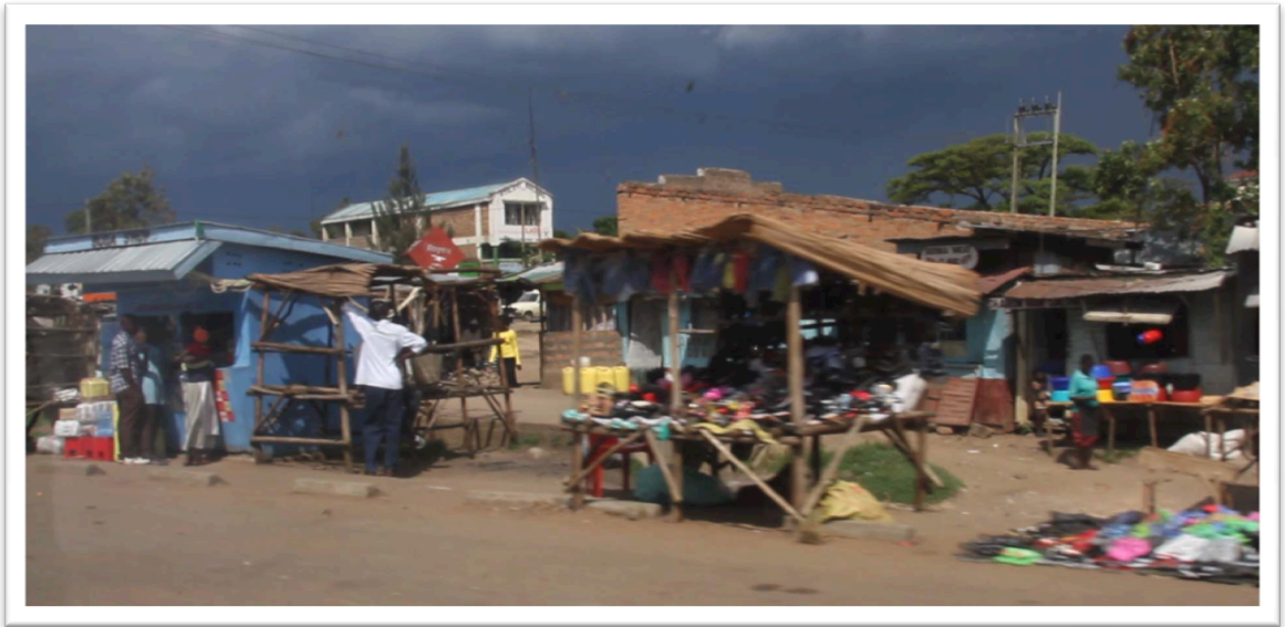
KUVA 5: Ulkoilmamarkkinat Kendu Bayssa

rää myytäviin tuotteisiin nähden, mutta toisaalta – ruoan myyjät ovat usein myös tuottajia, jotka myyvät omaa tuotantoaan.