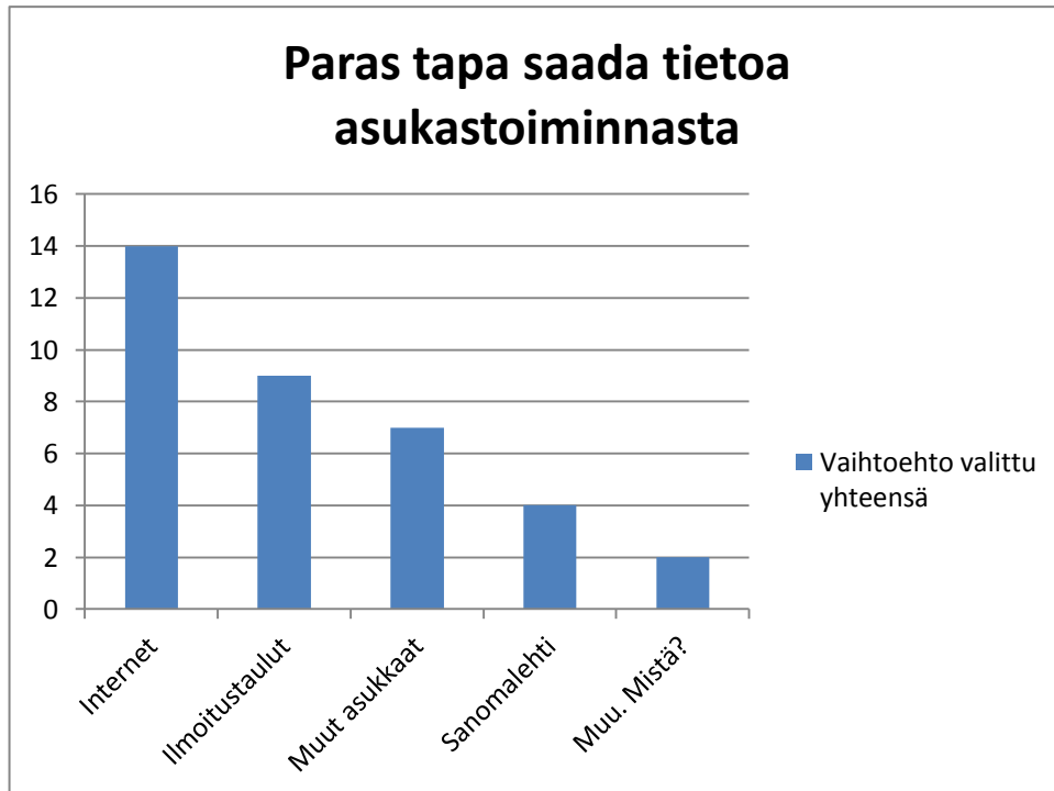
Kuvio 2. Paras tapa saada tietoa asukastoiminnasta N=20