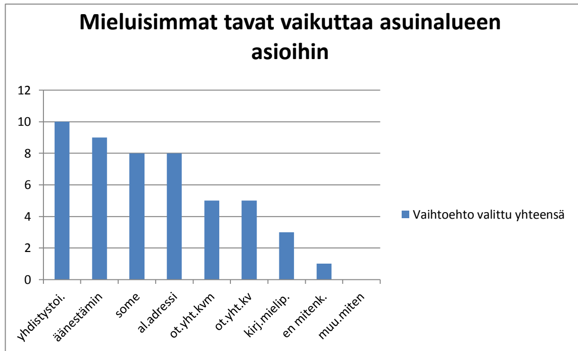
Kuvio 5. Mieluisimmat tavat vaikuttaa asuinalueen asioihin N=20