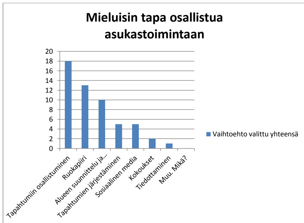
Kuvio 3. Vastaajien mukaan mieluisimmat tavat osallistua asukastoimintaan N=20

ka-aineita suoraan tuottajilta. Kolmanneksi mieluisin tapa osallistua asukastoimintaan oli alueen suunnitteluun ja kehittämiseen osallistuminen; tämän vaihtoehdon valitsi yhteensä 10 vastaajaa. Sosiaaliseen mediaan liittyvän toiminnan ja tapahtumien järjestämisen valitsi kummankin mieluisimmaksi tavaksi osallistua asukastoimintaan viisi vastaajaa. Sosiaaliseen mediaan liittyvä toiminta voi olla esimerkiksi toiminnasta tiedottamista ja keskustelujen avaamista ja ylläpitämistä Facebookissa tai Twitterissä. Kuviosta 3. huomaa, että vaihtoehtojen häntäpäähän jäivät vaihtoehdot kokoukset, tiedottaminen ja vaihtoehtoa muu, mikä, ei valittu kertaakaan.