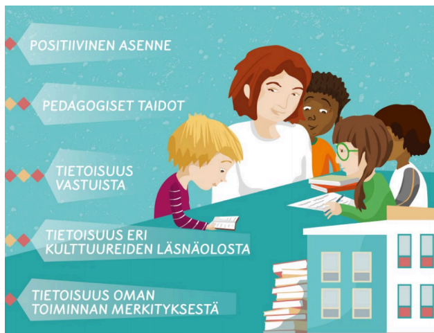
Kuva 2. Kulttuurisensitiivinen opettaja (Paksuniemi 2019, 15).

Ihmisoikeuskasvatus antaa tietoja ja taitoja sekä ymmärrystä omien asenteiden ja toimintatapojen kehittämiseksi vahvistamaan ihmisoikeusmyönteistä kulttuuria. Perusopetuslain mukaan opetuksen tavoitteina on muun muassa tukea oppilaiden kasvua ihmisyyteen ja eettisesti vastuukykyiseen yhteiskunnan jäsenyyteen. Ihmisoikeuskasvatusta on kaikki sellainen koulutus, kasvatus ja tiedotus, joka tähtää ihmisoikeuksien ja perusvapauksien maailmanlaajuiseen kunnioitukseen, ja joka siten ehkäisee ihmisoikeusloukkauksia. (Ihmisoikeuskeskus 2020.)