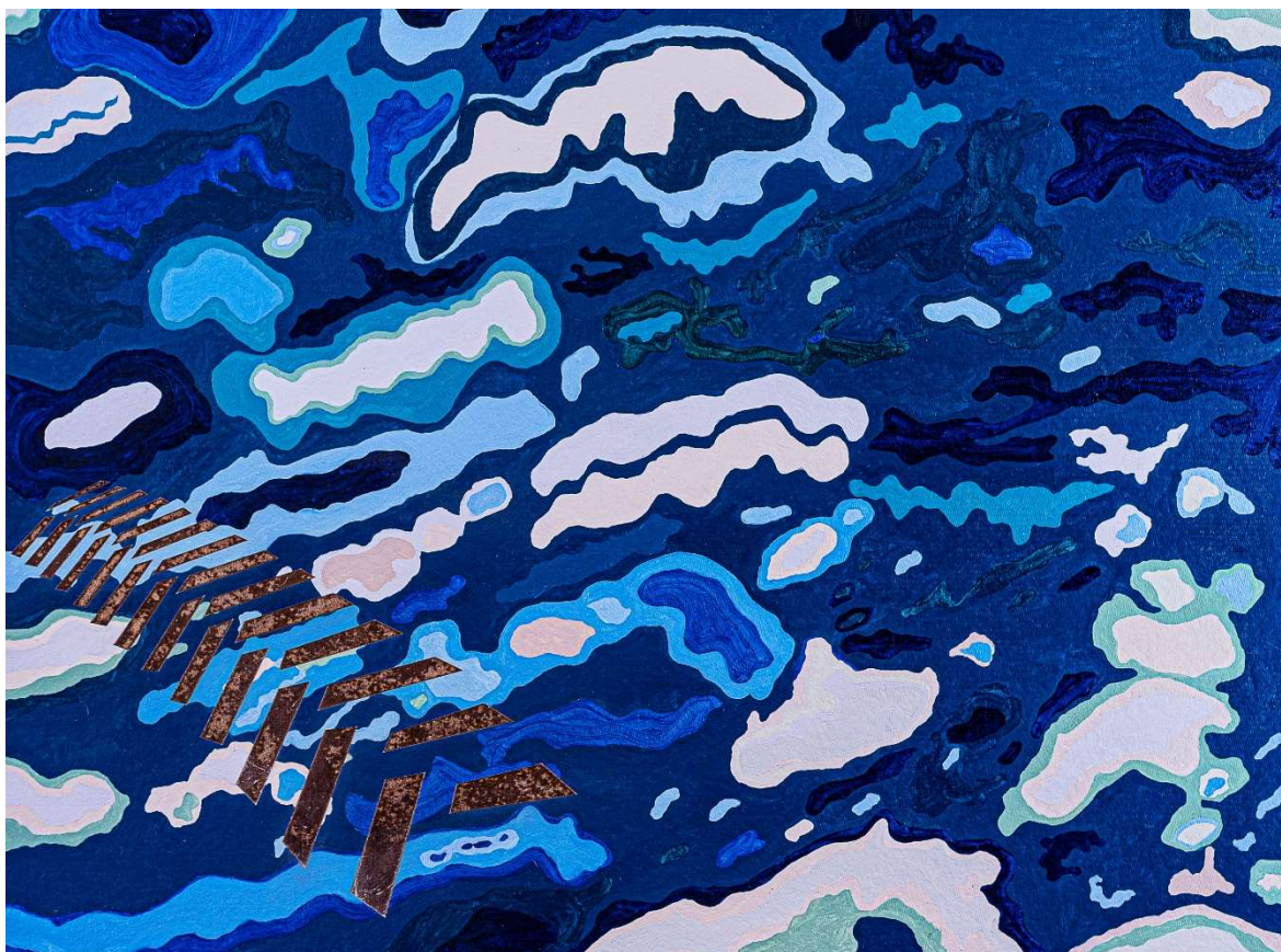
Kuva 12. Renkaanjäljet, 2020, öljymaalauksella ja laserkaiverruksella, 90 x 120 cm

Maalauksessa Renkaanjäljet käsittelin luonnollista maaperää viitteellisesti. Maaperä on vettynyt, räntäisen talvinen, sohjoinen ja märkä. Se on sieltä täältä jäinen, on ruohikkoa ja lumisia alueita. Kunnollista talvea ei ole. Vaikutelmiin on pyritty värikenttiin, jotka kuvaavat lunta ja jäätä, ruohoa ja muuta vihreää. Maaperä on koske-maton ja luonnollinen, luonnon omassa järjestyksessä ja epäjärjestyksessä. Luonnollisen maaperän tuhoaa ihminen, joka jättää jäljet, jotka ovat kuin arpia. Maaperään on kaiverrettu renkaan jäljet (kuva 12). Renkaiden jättämät jäljet edustavat työssä kaikkia ihmisen jättämiä hitaasti paranevia arpia luontoon. Työ on luotu (öljymaalauksella) ja tuhottu (kaiverruksella).