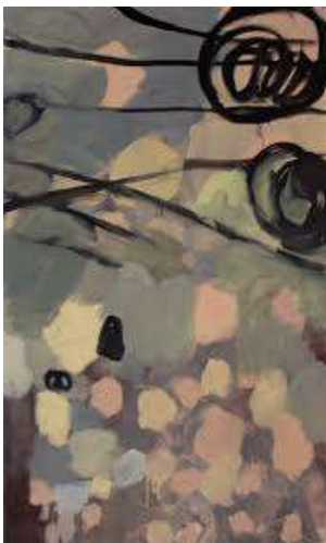
Kuva 4. Räsänen, L. Kaupunki-ilma. 2018. Öljy ja akryyli kankaalle, 100 x 60 cm