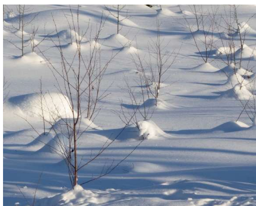
Kuvat 8. Miellekuvia

Maalauspohjaan piirtämisen sijasta käsittelin vaihtoehtoisesti digitaalista piirtämistä ja piirustuksen laserkaivertamista maalauspohjaan. Digitaalisessa piirustuksessa on suunnitteluvaiheessa helppo muuttaa viivoja ja värejä, töitä voi prosessoida mielessään, mennä eteenpäin ja palata takaisin. Digitaalisesta piirustuksesta on helppo tehdä värisommitelmia, jotka toimivat eräänlaisina maalauskarttoina (kuva 9).