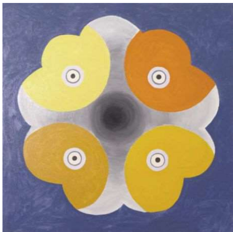
Kuva 5. Holmström, G. Profeetta. 2017. Öljymaalauk 80 x 80 cm