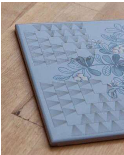
Kuva 6. Lasermerkattu keraaminen laatta (Hirvimäki ym. 2015)

Kutsun itse keramiikan merkkausta kaiverrukseksi. Kaiverruksia voidaan työstää edelleen maalaamalla. Keramiikka on hyvä materiaali lasertyöstössä, ja erikokoisia laattoja yhdistämällä voidaan tehdä suurikokoisiakin töitä. Luontoaiheisessa työssäni (kuva 7) olen käyttänyt käsiteltyä digitaalista valokuvaani, joka on kaiverrettu (tai merkattu) keraamiseen laattaan ja jälkikäsitelty väripyyhkäisyin. Pidän kaiverrustöistä, koska niiden jälki tuntuu pysyvältä ja töitä voi kosketella käsin myös tuntoaistin avulla.