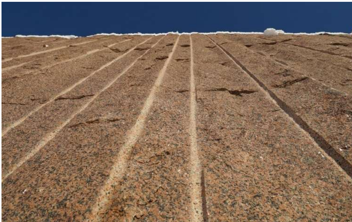
Kuva 2. Harkas, J. Louhittu. 2018

Louhittu kertoo ytimekkäästi ja karusti siitä, miten ihminen muokkaa maisemaa, jota ei saa enää takaisin. Louhittua graniittia käytetään kaunistamaan ihmisen luomuksia, taloja ja sisustuksia. Graniittia käytetään mm. talojen ulkopinnoissa, keittiön ja kylpyhuoneen tasoissa, katujen vieruskivinä. Paradoksaalisesti ihminen rakentaa maailmastaan kaunista ja siistiä, mutta tuhoaa samalla pysyvästi luonnon omaa maisemaa.