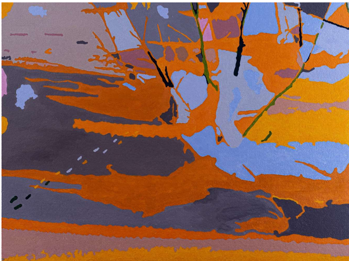
Kuva 11. Jäniksen jäljet, 2020, öljymaalauk, 90 x 120 cm

Maalauksessa Jäniksen jäljet (kuva 11) keväinen hanki heijastelee auringonvaloa ja taivaan sineä. Jäniksen jäljet kulkevat maalauksessa samalla tasolla kuin muu maalaus. Jäljet ovat keveitä ja poispyyhkiytyviä, viitteellisiä värialueita. Jäljistä ei jää arpia. Maalaus on toteutettu pääväreiltään keltaisina värikenttinä. Osa väreistä on kirkkaita. Kirkkaampien ja vaaleampien värien merkitys on edustaa puhtautta. Osa väreistä on suorastaan rumia, värikentissä on viitteitä siitä, kuinka luonto menettää kirkkautensa ja sen värit himmenevät. Maisemaa kuvaavat risuiset alueet, joissa väreinä on sekä synkeyttä että vihreyttä. Maalaukseen on tehty risujen muodoilla ja jalanjäljillä figuratiivista, tunnistettavaa vaikutelmaa rikkomaan värikenttien yksiulotteisuutta.