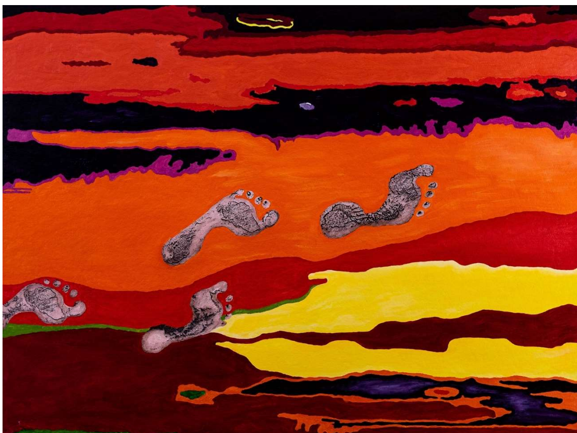
Kuva 13. Jalanjäljet, 2020, öljymaalauus ja laserkaiverrus, 90 x 120 cm

Maalauksessa Jalanjäljet (kuva 13) iltarusko kuvastaa ihmiskunnan mahdollista iltaruskoa tilanteessa, jolloin maapallon luontoineen on menetetty. Jalanjäljet kulkevat pois päin. Jalanjäljet on kaiverrettu maalauispohjaan. Syvät jäljet ovat rumia ja kuin arpia. Ne kuvaavat sitä, että ihmisen tekeminen pahimmillaan eli ns. jalanjäljet ovat jättäneet luontoon niin pysyvät arvet, että planeetasta tulee asuinkehvoton. Valo ja väri valuvat maailmasta pois.