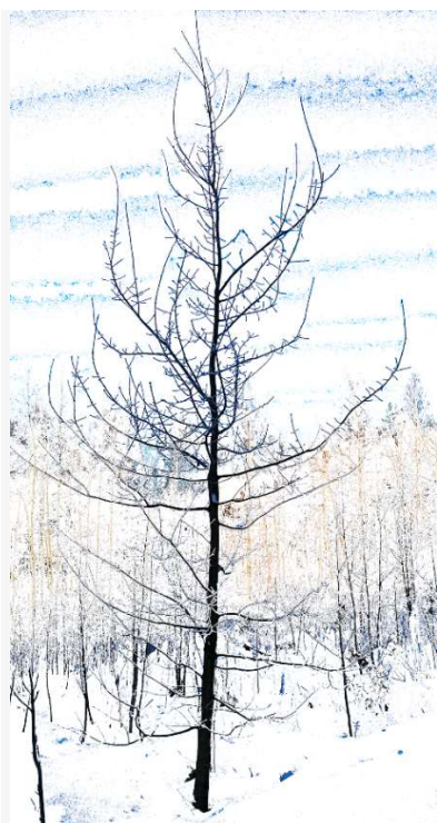
Kuva 7. Reponen, H. Tammi. 2017. Laserkaiverrettu keraaminen laatta

Kutsun itse keramiikan merkkausta kaiverrukseksi. Kaiverruksia voidaan työstää edelleen maalaamalla. Keramiikka on hyvä materiaali lasertyöstössä, ja erikokoisia laattoja yhdistämällä voidaan tehdä suurikokoisiakin töitä. Luontoaiheisessa työssäni (kuva 7) olen käyttänyt käsiteltyä digitaalista valokuvaani, joka on kaiverrettu (tai merkattu) keraamiseen laattaan ja jälkikäsitelty väripyyhkäisyin. Pidän kaiverrustöistä, koska niiden jälki tuntuu pysyvältä ja töitä voi kosketella käsin myös tuntoaistin avulla.