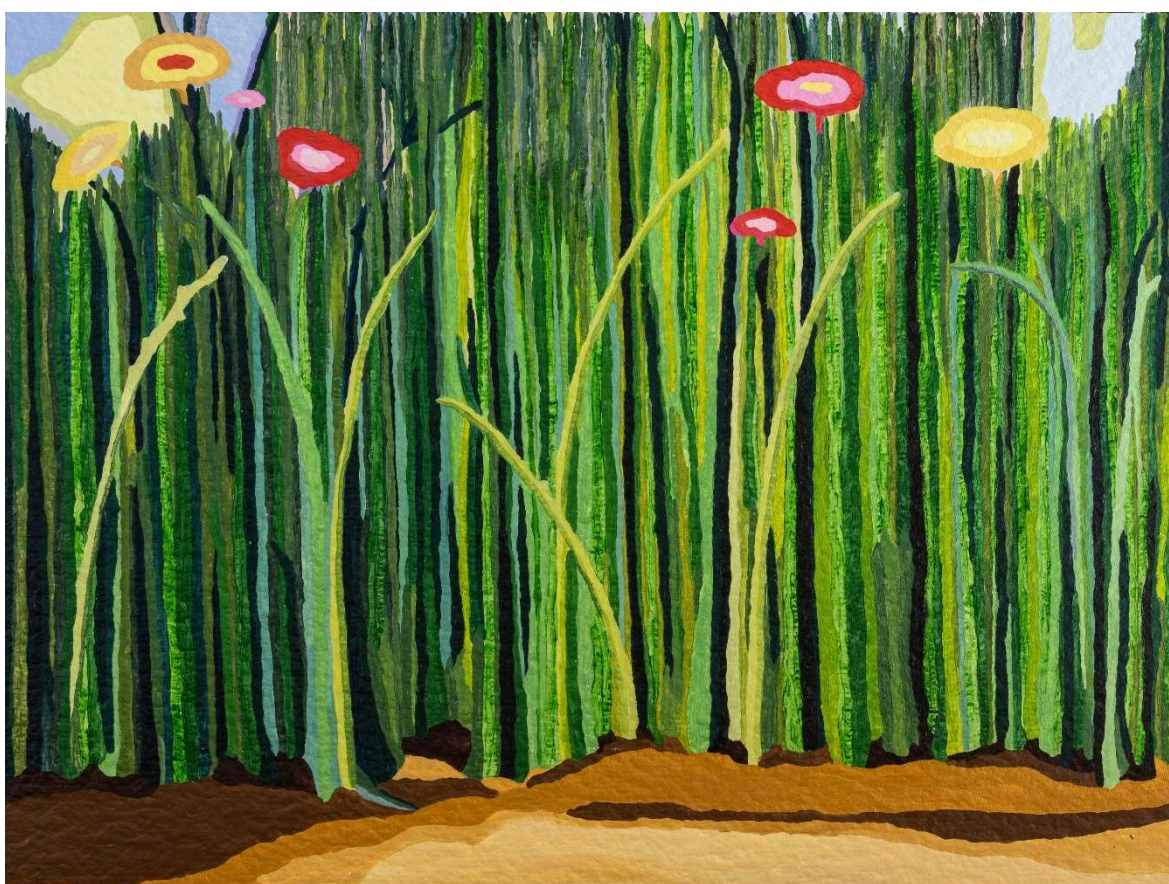
Kuva 10. Käärmeen jäljet, 2021, öljymaalauk 90 x 120 cm

Käärmeen jäljet (kuva 10) työssä luontoa edustaa vihreä, viidakkomainen heinikko, sen koskemattomuutta tiheä seinämä. Maalauksen vihreä edustaa paratiisimaista luonnon alkutilaa. On vain luontoa ja taivasta. Käärmeen jäljessä oleellista on, ettei sitä oikeastaan ole. Käärme liikkuu sulavasti erilaisilla pinnoilla ja niiden yli, ja jälkenä voi huomata joskus vain kevyen pyyhkäisyn hiekalla.