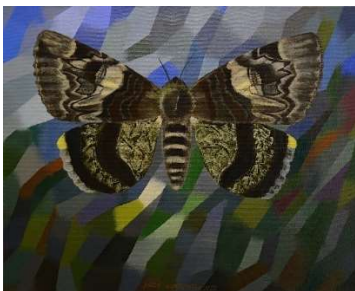
Kuva 1. Nopsanen, J. A Moth. 2020. Öljymaalauus, 65 x 80 cm