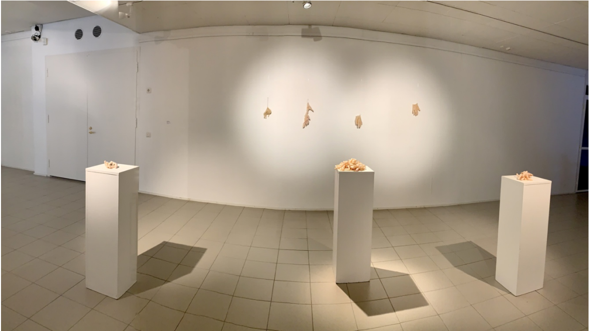
Kuva 11. Teokset ripustettuna opinnäytetyönäyttelyssä Imatran taidemuseossa

Vaikka teokset ovat selkeän kehollisia, mielestäni niitä ei lueta kirjaimellisesti kehon representaatioksi vaan ne tuntuvat esittävän jotain muuta. Teoksissa kiteytyy kyborginen eriävien sukupuolisuuden näkemysten ja kokemusten yhdistäminen.