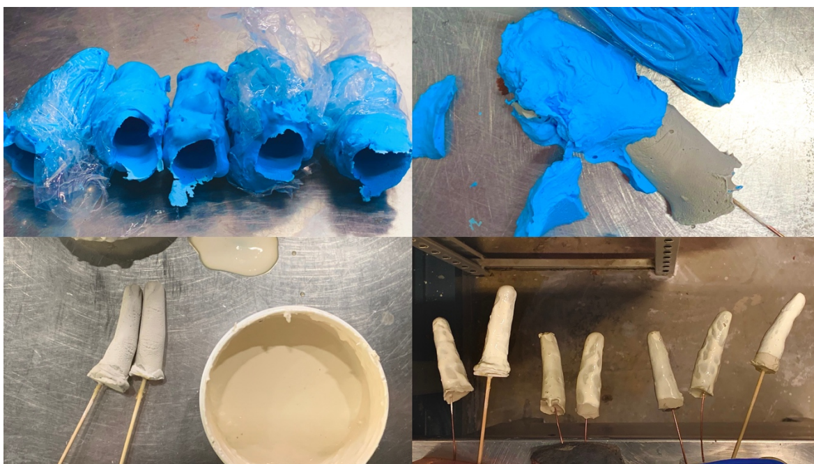
Kuva 5. Kollaasi lateksikappaleiden valmistusvaiheista

Lateksi on visuaalisesti kiehtova ja ensisilmäyksellä hiukan vieras tai vaikeasti tunnistettava materiaali. Sen ohuus ja kyky toistaa tarkasti sormen jokainen ura ja muoto luovat vaikutelmaa luodusta nahkasta. Luodun nahan määrä puolestaan synnyttää ajatuksia toistuvasta uudelleen luomisesta ja muutoksen prosessista, ja pitkälle viety toisto toisaalta ylikuormittaa ja synnyttää inhoa, kummastusta tai jopa ahdinkoa.