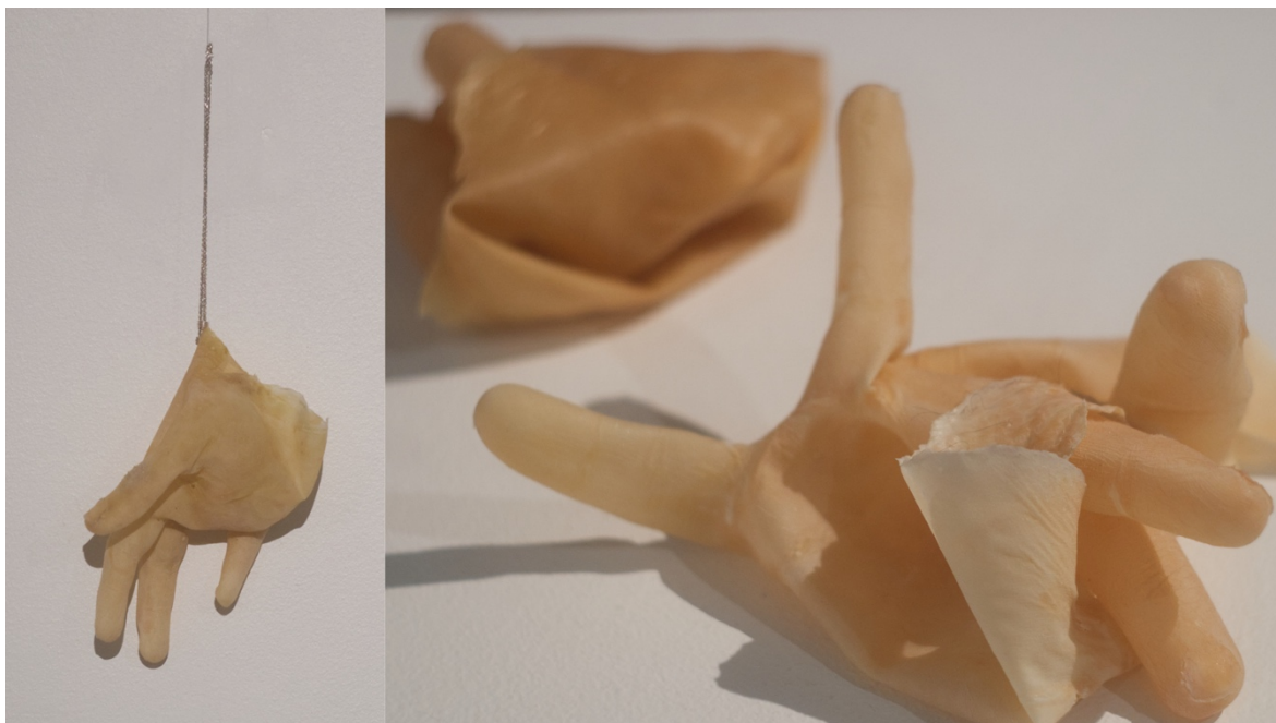
Kuva 10. Väännetty, Osa I–III

Väännetty (kuva 10) on toinen sarja sarjan sisällä. Merkityksettömän painon tavoin se koostuu kolmesta teoksesta, joista yksi on seinällä ja kaksi jalustalla.