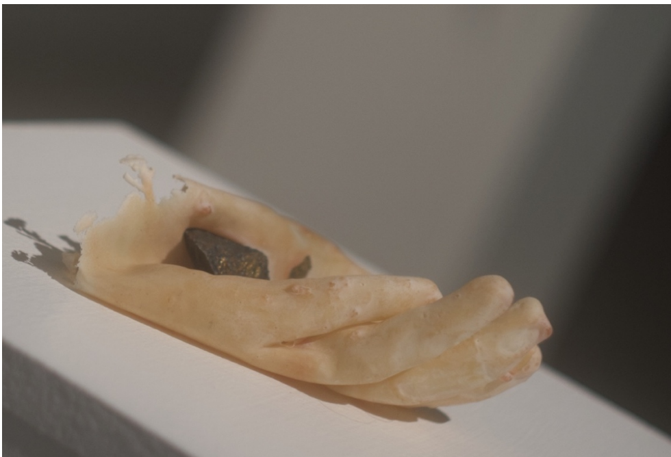
Kuva 8. Merkityksetön paino I