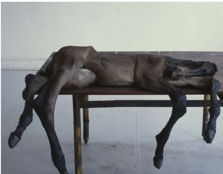
Kuva 3. Berlinde de Bruyckere, Lost II, 98 cm x 152 cm x 164 cm, installaatio (Hauser & Wirth 2016)

De Bruyckere kertoo Hyperallergic-lehden (2016) haastattelussa, että kun hän hakee uuden teoksen materiaaliksi kuollutta hevosta, hänen on ensiksi rakastuttava hevoseen; teosta ei synny ilman ensirakkautta.