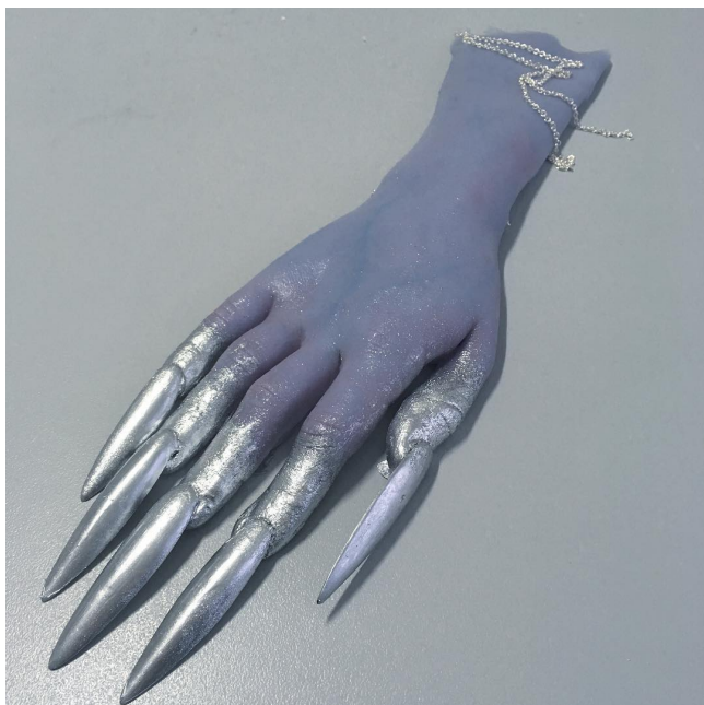
Kuva 1. Esmay Wagemans, Future skin hand glove, 2017, käsine (Something Curated 2020b)

Wagemansin teoksissa (kuva 1) huomionarvoista on tapa, jolla ne hyödyntävät feminiiniseksi miellettyjä elementtejä kuten pastellisävyjä ja akryylikynsiä ja luovat silti esteettistä kyborgia; juuri tässä representaation ja käsitteellisen presentaation yhdistelmässä kiteytyy Harawayn käsitys kyborgista sekä mielikuvituksellisena ja kehollisena entiteettinä.