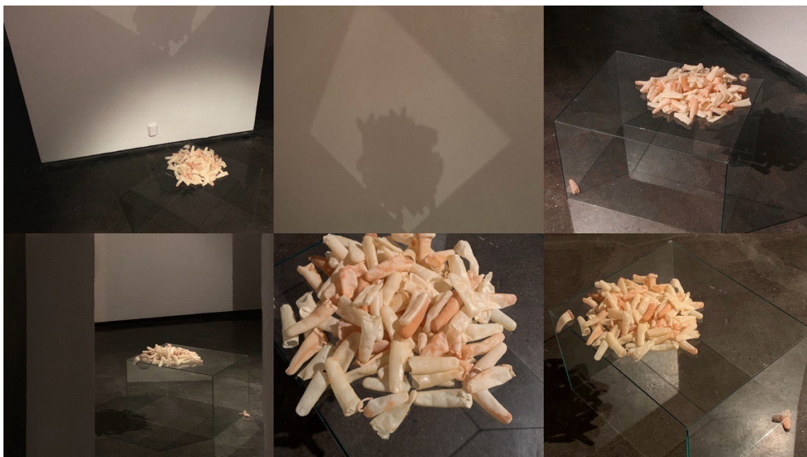
Kuva 6. Kaikkiin suuntiin kerralla esillä Titanik-galleriassa

Olin erittäin tyytyväinen teoksen installaation Titanikissa. Lasi ja lateksi käyvät materiaalista dialogia. Lasi tässä kontekstissa tuntuu menettävän objektin asemansa ja hajoavan pelkäksi heijastukseksi, valoksi ja varjoksi. Esitin kasan sormia valkoisen seinän eteen lattialle asetetun lasisen kuvun päällä. Lasiseen alustaan osuvasta valosta piirtyi seinälle heijastus ja heijastuneen ruudun sisällä sormikasan varjo. Lasiin sekä lattialle syntyi kiehtovia heijastuksia, jotka rikkoivat tilan tuntua, antoivat sormista koostuvalle massalle leijuvan vaikutelman ja häivyttivät lasikupua lähes aineettomaksi. Lasikuvun reunan alle jäi kupua siirtäessä yksi sormi, jonka päätin jättää kysymyksiä herättäväksi elementiksi. Yksinäinen sormi kyseenalaisti läheltä katsottuna lasikuvun aineettomuuden vaikutelmaa ja loi sille painoa.