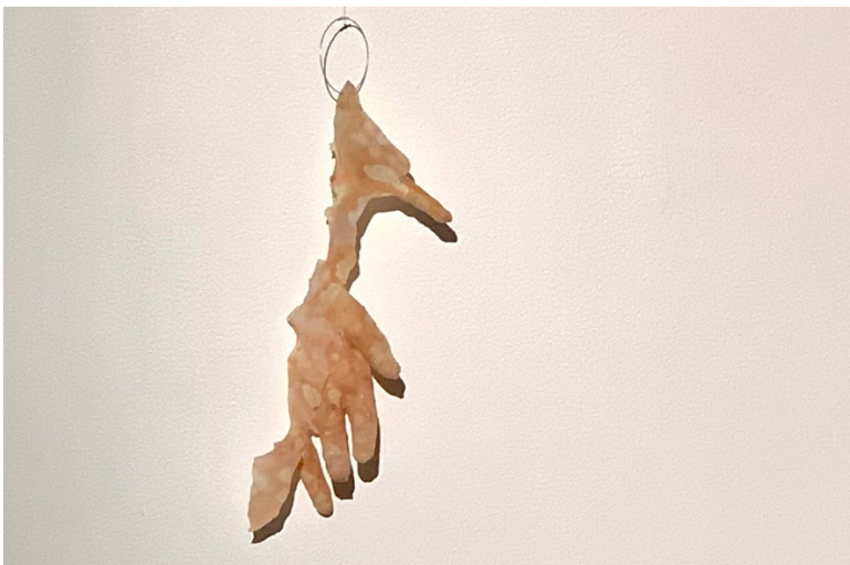
Kuva 7. Revitty

Teoksesta on tunnistettavissa sormet, mutta muuten se ei muodoltaan muistuta kättä ollenkaan. Lateksin väri on epätasainen ja laikukas, osittain kalpea ja osittain punertavan meripihkan sävyinen. Kappaleen yläosaan on kiinnitetty avoin hopearengas, josta teos roikkuu siimalla seinää vasten. Kastoin ensin kokonaista kipsistä valettua kappaletta lateksiin, mutta se osoittautui hankalaksi; ensinnäkin asettunutta lateksia oli hankala irroittaa ehjänä, ja toiseksi silloinkin kun lateksin sai irroitettua kokonaisuena, irtoilivat jäykät kipsisormet käsistä. Käden muodon hajoaminen tukee kuitenkin visuaalisesti ajatusta hajoavasta sukupuolesta. Nimi Revitty korostaa repimistä jo tehtynä tekona.