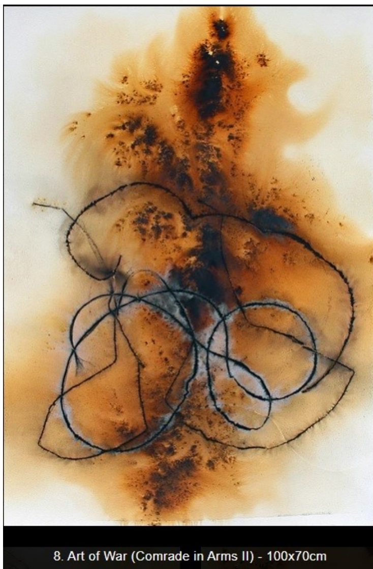
8. Art of War (Comrade in Arms II) - 100x70cm