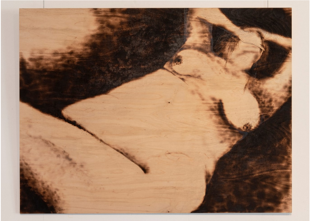
Kuva 14. (Emmi Pellinen, 2020, 1/2, 90 x 120 cm, 2021)