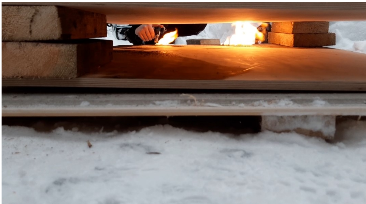
Kuva 11. Sytytän alemmalle vanerille ruutia, jonka liekki sitten polttaa ylempään vaneriin jälkensä.

Työskentelyni etenee siis niin, että nostan ylemmän vanerin katsoakseni, onko siinä sopiva jälki ja lisään ruutia alimmaiseen jatkaakseni taas polttamista. Ruudin asettelu vie paljon aikaa. Ripottelen sitä sormin ja poistan sitä kohdista, joihin en sitä halua. Ruuti pääsee kuitenkin vähän aina liikkumaan ja näin mukaan tulee taas kontrolloimattomuus. Tämä tuo mielestäni teokseen rentoutta, sillä kaikki ei ole ennalta päätettyä. Aikaisemmin tarkemmin kuvailemani ruudilla tehdyn kaksoiskuvan tekovaiheet näkyvät kuvissa 11 ja 12.