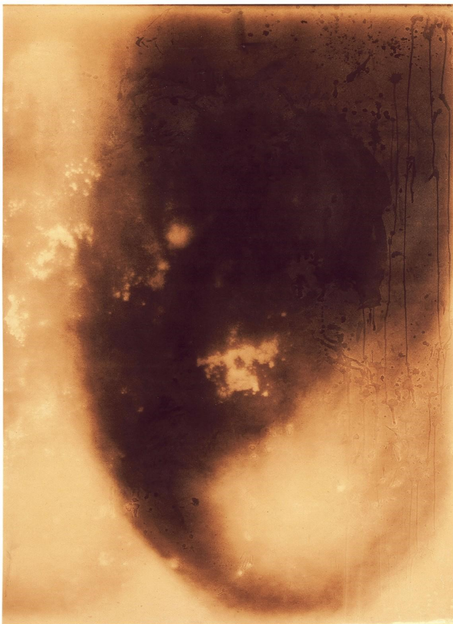
Kuva 3. (Yves Klein, nimetön tulimaalaus pahville (F 74 ), 1961, 1,39m x 1m)