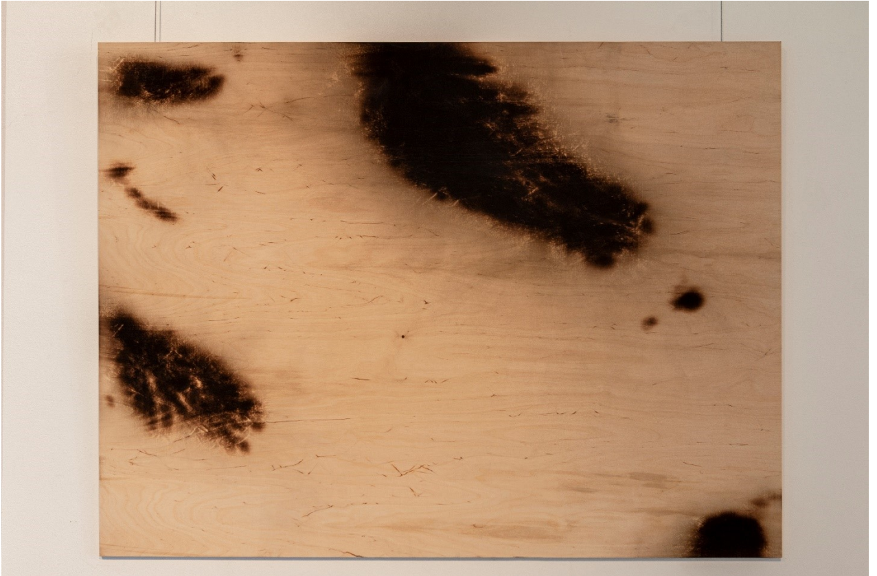
Kuva 15. (Emmi Pellinen, 2020, 1/2, 90 x 120 cm, 2021)