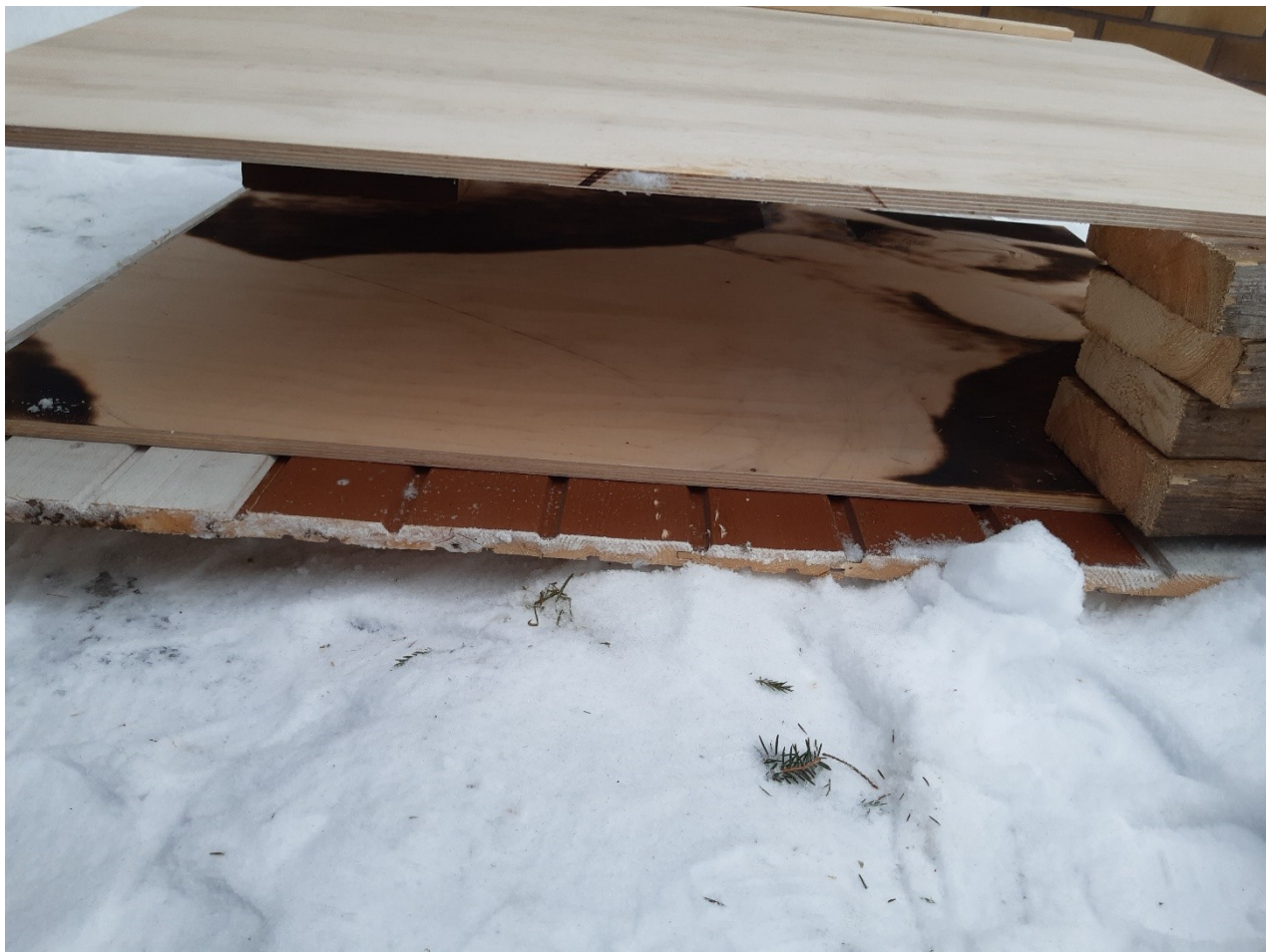
Kuva 7. jossa vanerit päällekkäin.

Keksimäni tekniikka ns. kaksoiskuvasta ruudilla polttaessa syntyy, kun laitan toisen vanerin tai puukappaleen ensimmäisen päälle. Tähän väliin jätetään ilmaa, eli asetan usein tiiliä alustojen kulmiin ja näin väliä jää yleensä n. 10–20 cm. Tarpeen mukaan lasken päällimmäistä vaneria alemmas, jos tuli ei meinaa tarttua siihen, mutta on hyvä aloittaa mahdollisimman ylhäältä, ettei päällimmäinen vaneri tummu heti liikaa. Kuvailemani alkuvaihe näkyy kuvassa 7.