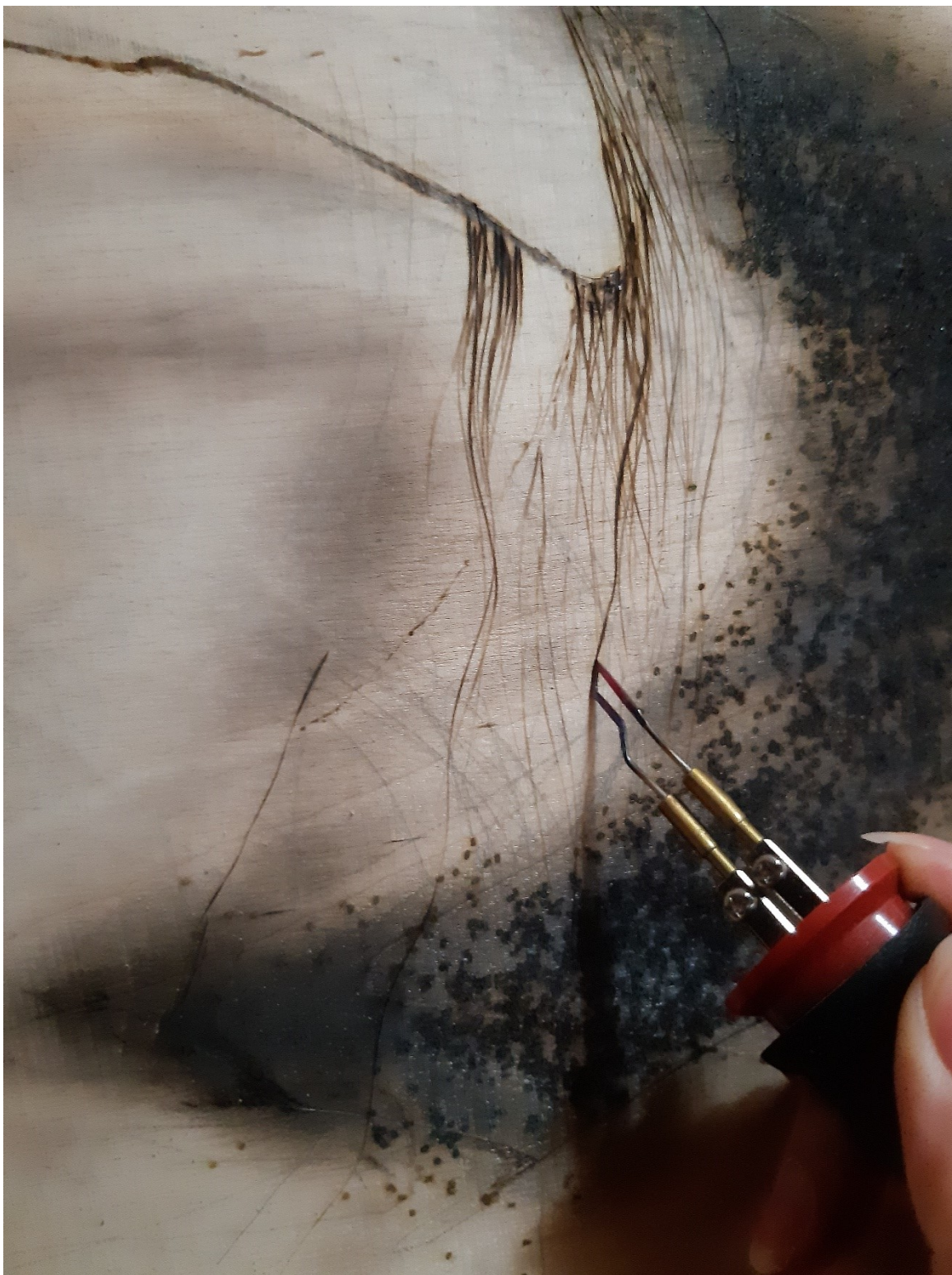
Kuva 5. Polttamassa figuurin hiuksia polttokolvin varjostusterällä, jolla saa myös tehtyä tarkkaa viivaa.