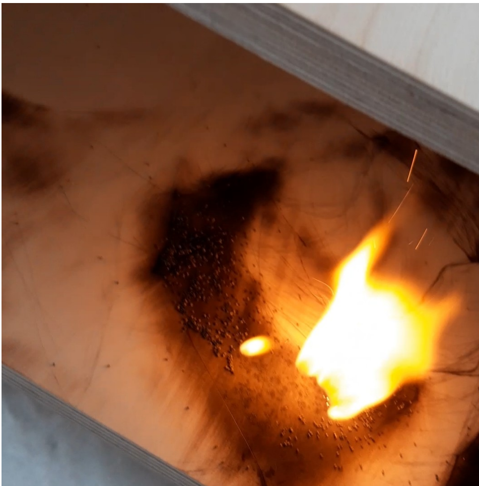
Kuva 6. Jossa olen ripotellut ruutia haluamiini kohtiin ja sytyttänyt ne palamaan. Liekki kulkee sitten ruutihippujen mukaisesti.