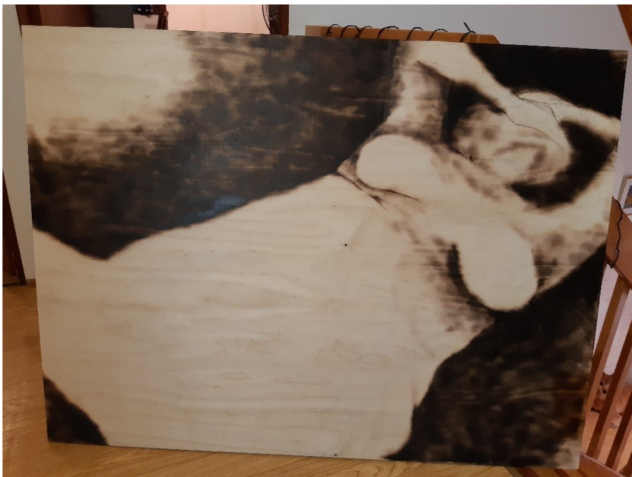
Kuva 9. Omakuva alkaa muodostua ja taustan tummennus kaasuliekillä helpottaa hahmotamaan kokonaisuutta