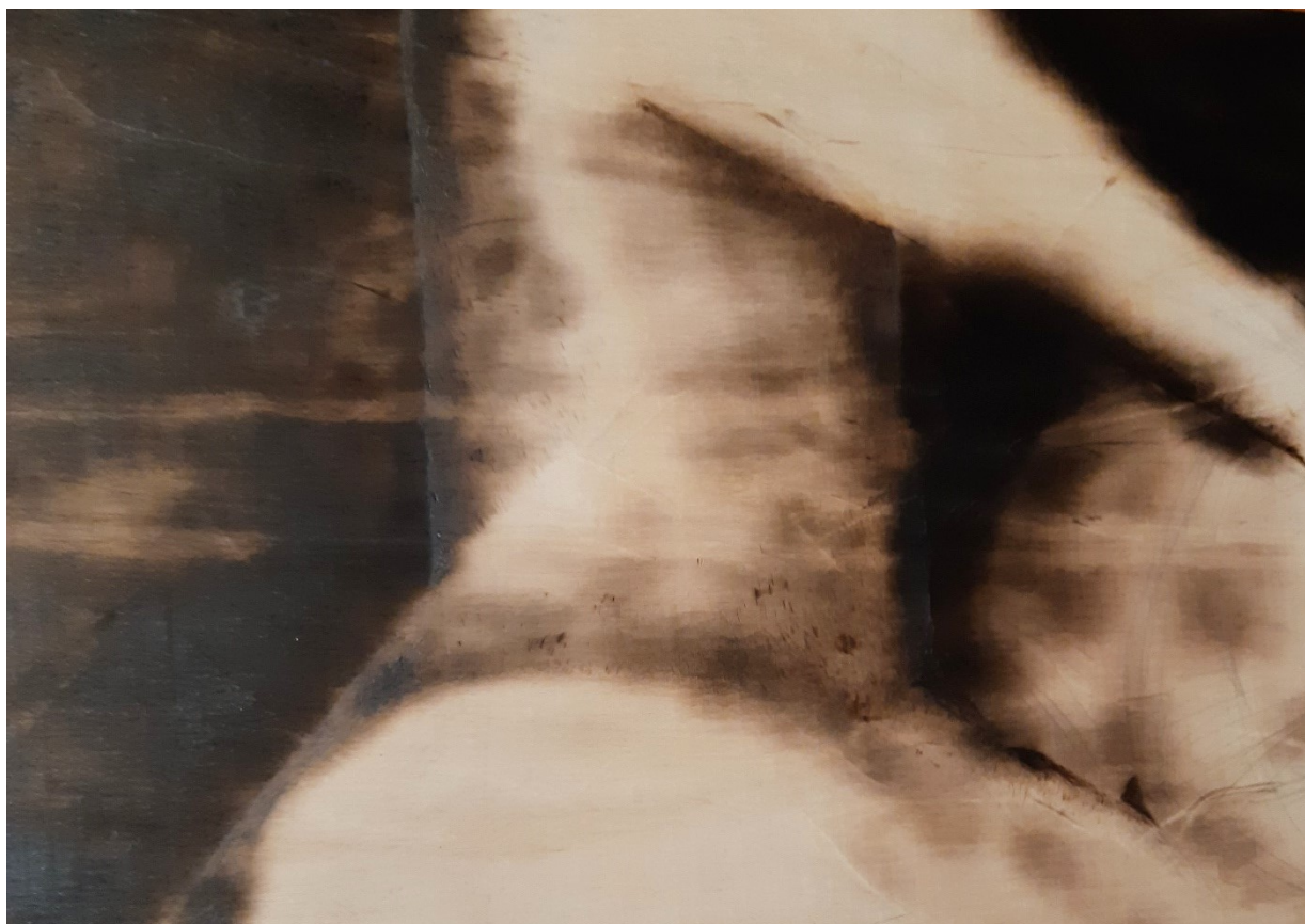
Kuva 8. Jossa näkyy kerroksia kolvin ja kaasuliekin jäljistä

Taustaa tehdessä sain paremman kokonaiskuvan, miten teos toimii kokonaisuutena. Tässä kohtaa myös alussa mainitsemani tulen arvaamattomuus, sattuma ja kontrolloimattomuus pääsi näkymään. Polttaessani oikeaa yläkulmaa teoksessa, liekki jäi vanerin pinnalle elämään ja ennen kuin kerkesin puhaltamaan sen sammuksiin, se kerkesi tehdä tummemman ja tasaisemman jäljen vanerin pintaan. Tämä muoto toi mieleeni kasvomaskin puolikkaan ja pohdin, kuinka hyvin se sopii teokseni kuvalliseen aiheeseen. Arvaamattomuus tuo uusia mahdollisuuksia. Teos elää ja muuttaa muotoaan minun ollessani joustava muutoksia kohtaan. Kuvassa 8. näkyy, miten olen lisännyt tummuutta taustaan.