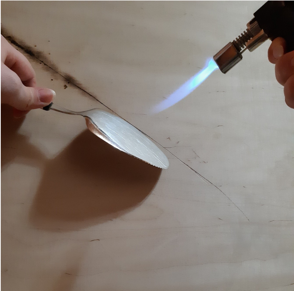
Kuva 10. Poltan varjokohtia figuuriin kaasuliekillä ja rajaan kohtia kakkulapion avulla.

Kaasupolttimen avuksi otin taiteellista produktiota tehdessä metallisen kakkulapion. Sillä rajasin tiettyjä kohtia samalla polttaen kaasuliekillä. Näin sain suojattua kohtia teoksesta, jotka halusin pitää puhtaina liekistä. Tähän siis sopii mikä vaan metallipala, mutta itse käytin nyt tätä kakkulapiota, sen muodon vuoksi ja koska siitä sai hyvän otteen. Tämä kyseinen tekotapa näkyy kuvassa 9.