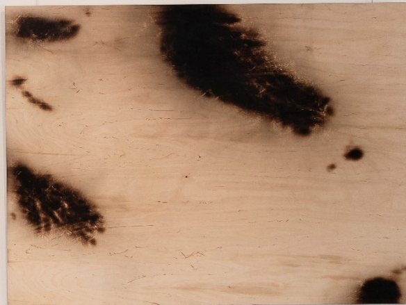
Kuva 13. Teokset Imatran taidemuseolla valmiina. (Emmi Pellinen, 2020, 90 x 120 cm, 2021)