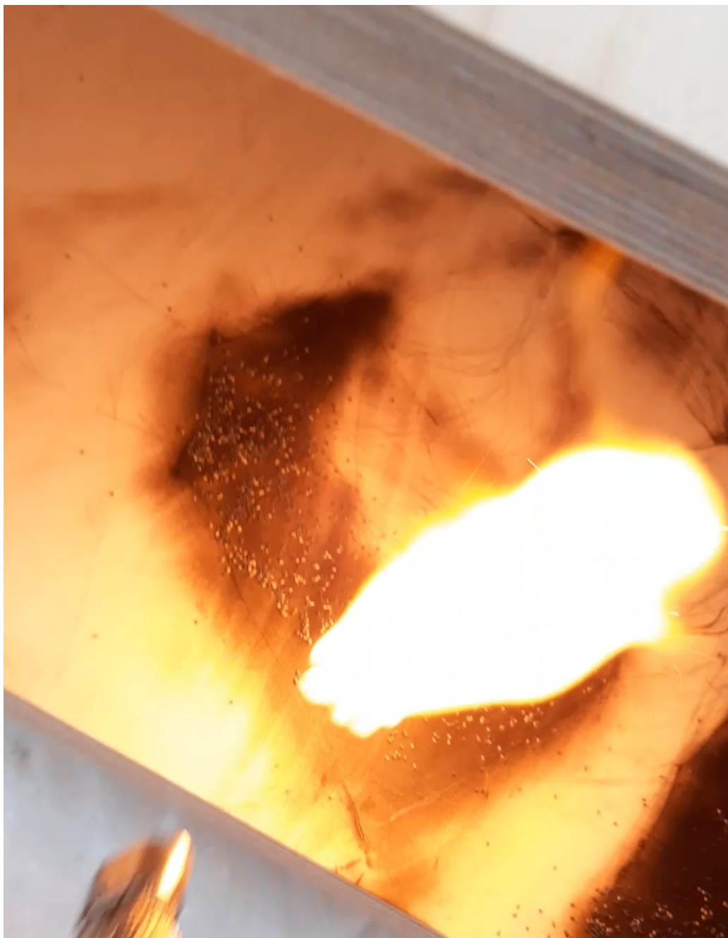
Kuva 12. Jossa näkyy paremmin palamattomat ruutihiput, joita kohti liekki kulkee.

Ruudin jälkeen jatkoin figuurin tekoa vielä kaasuliekillä ja kolvilla. Lisäksi päällystin teokset fiksatiivilla, sillä monien testauksien jälkeen se näytti pitävän ruudista jäävän pölyn paikallaan. Siitä huolimatta pölyä silti hieman irtoaa, enkä ole vielä keksinyt parempaa päällystystapaa. Fiksatiivin kuivuttua teokset olivat valmiit. Valmiit teokset ovat kuvissa 13, 14 ja 15.