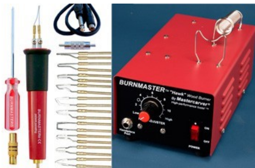
kuva 4. Käyttämäni polttokolvi, jossa keskus lämmönsäätelyyn, siitä lähtevän johdon päässä oleva kynäosa ja siihen 10 eri terää, sekä terien kiinnitykseen tarkoitettu ruuvimeiseli