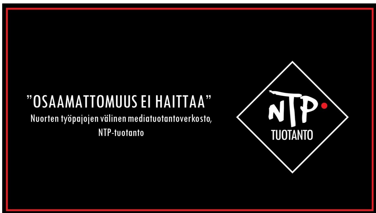
Kuva 2 Opinnäytetyön tuotoksen otsikkodia

Verkostoitumisen tuomat mahdollisuudet, yhteishenki ja yhteistyön vahvuus ovat NTP-tuotannon valttikortit. Työskentelytapa on rentoa ja huumoria riittää.