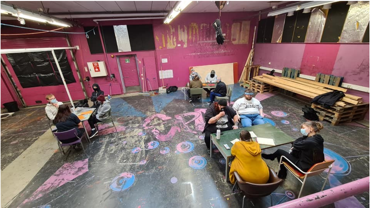
Kuva 1: Learning café tapahtuma, jossa mukana oli 12 nuorta. Koronarajoitusten mukaisesti, ryhmien turvavälit pidettiin suurina ja jokaisella osallistujalla oli kasvomaski tai visiiri.