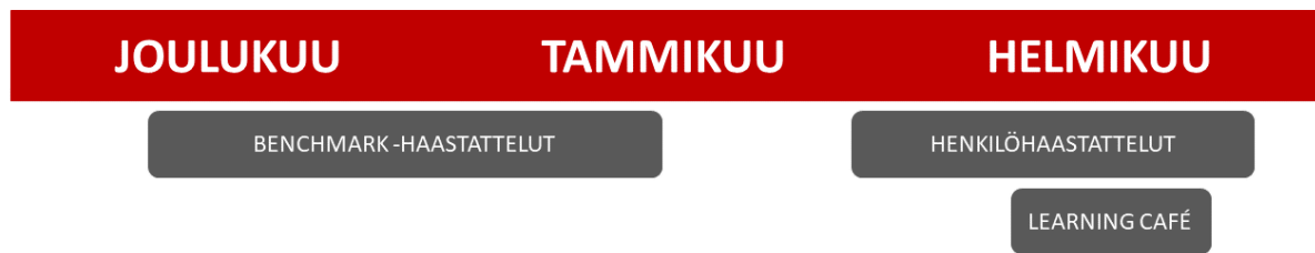
Kuvio 1: Toimenpiteiden aikataulutus

Aineistonkeräämismenetelminä käytin tässä opinnäytetyössä asiantuntija- ja henkilöhaastatteluita sekä learning café -toimintatapaa. Tämän kappaleen aluvuissa kerron jokaisesta menetelmästä omana kokonaisuutenaan. Asiantuntijahaastatteluilla keräsin tietoa vastaavanlaisista projekteista ympäri Suomea. Henkilöhaastatteluiden avulla selvitin NTP-tuotannosta käyttäjäkokemuksia sekä toimivia ja kehittämistä kaipaavia puolia. Learning café:n avulla osallistin nuoria etsimään kehittämiskohteita ja ratkaisuja niihin. Benchmark-haastattelut suoritin joulukuu 2020 – tammikuu 2021 välisenä aikana, henkilöhaastattelut ja learning café:n pidin helmikuussa 2021.