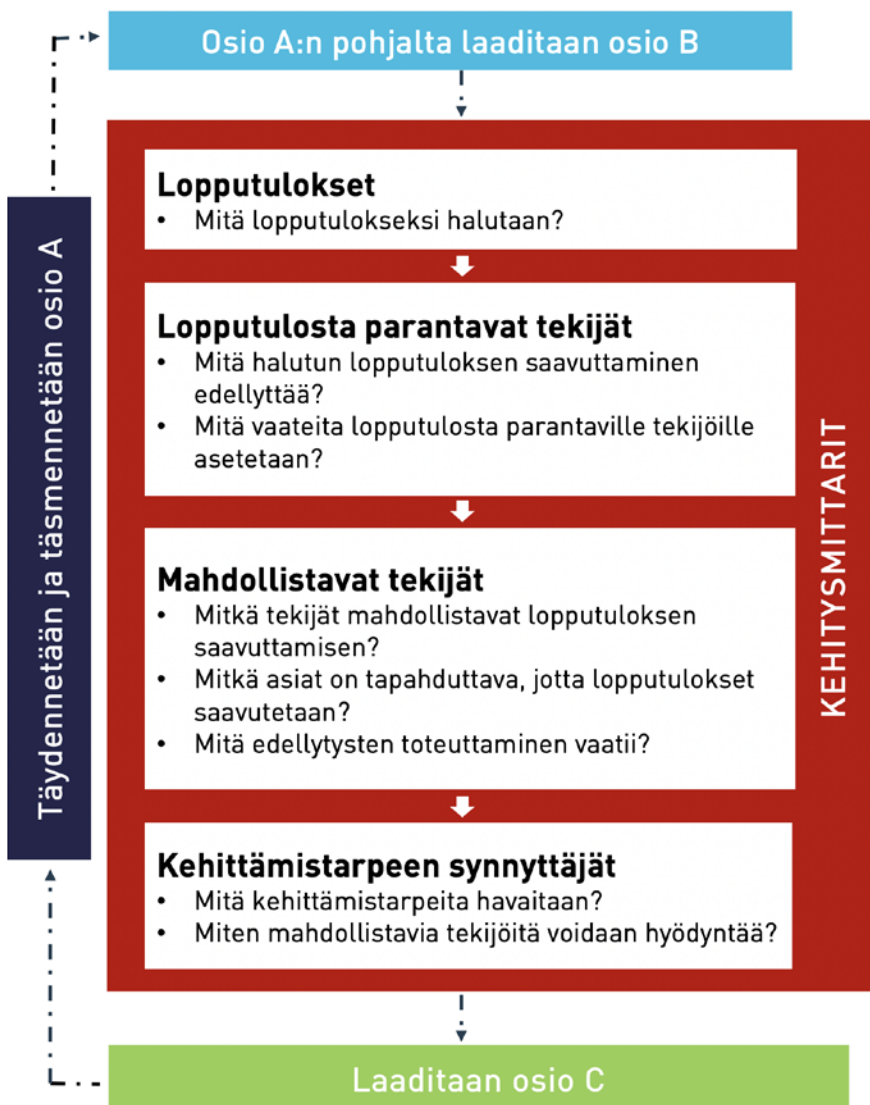
Kuvio 3. Toimintamallin laadinta.