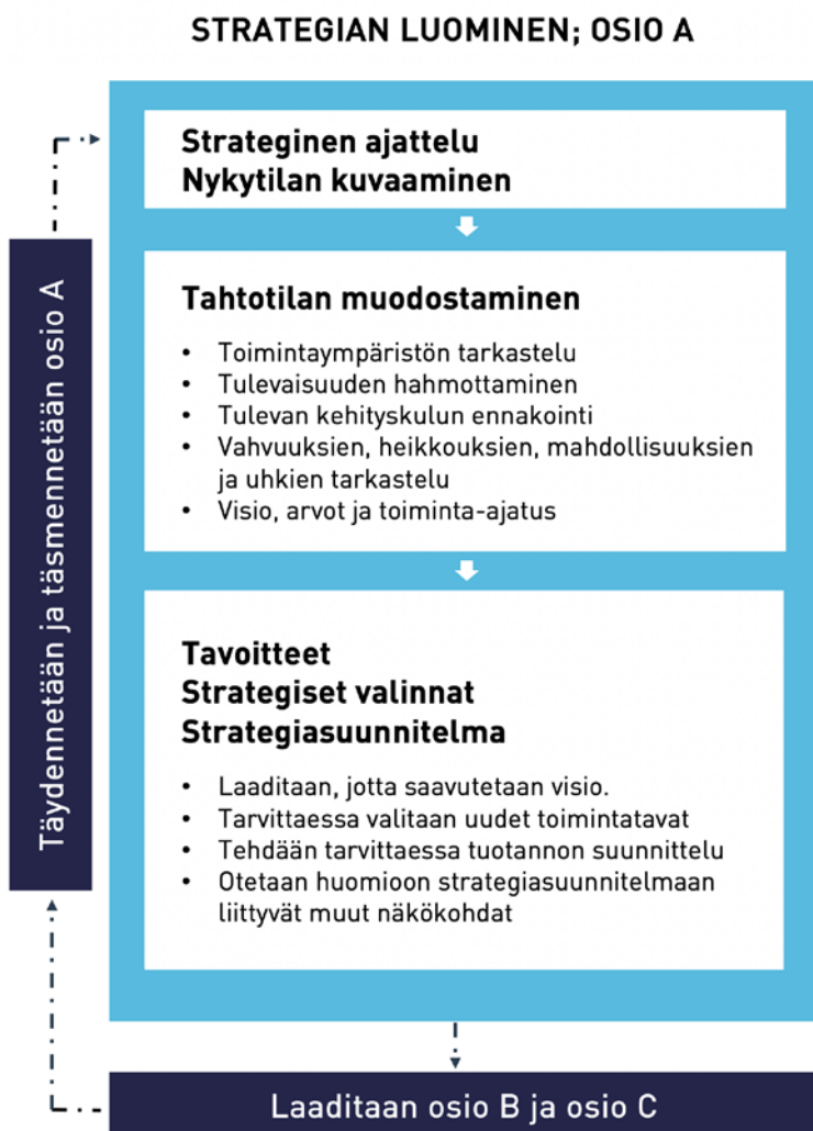
Kuvio 2. Strategian luomisen vaiheet.

Tässä osiossa (Kuvio 2) tarkastellaan toimintaympäristöä ja toimialaa, selvitetään resurssit ja niiden hankintamahdollisuudet; tarkastellaan vahvuuksia, heikkouksia, mahdollisuuksia ja uhkia, muodostetaan arvot, visio ja toiminta-ajatus. Sen jälkeen tehdään strategiset valinnat, päätetään tavoitteet ja tehdään strategiasuunnitelma, jonka toteuttamisella tavoitellaan vision saavuttamista. Päätetään, miten strategiasuunnitelma toteutetaan.