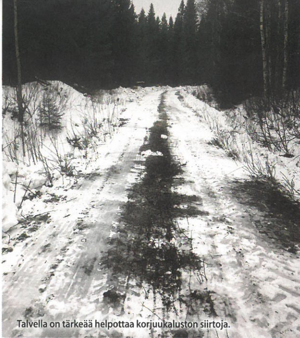
Talvella on tärkeää helpottaa korjuukaluston siirtoja.