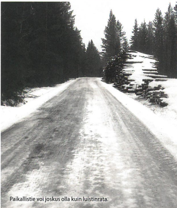
Paikallistie voi joskus olla kuin luistinrata.