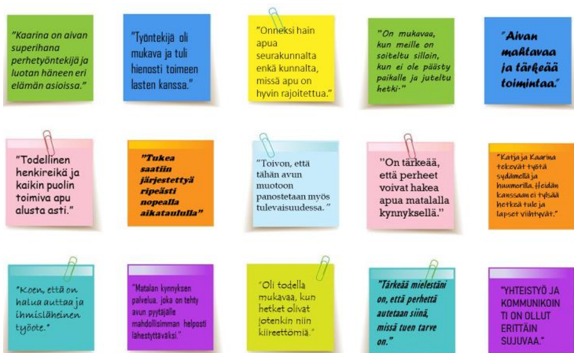
Kuva 1. Poimintoja Arki toimivaksi -perhetyön asiakaspalautteista.

lapsiperheiden tapahtumat. Asiakasperheet arvostavat matalaa kynnystä saada Arki toimivaksi -perhetyötä ja nopeaa avun saamista. Ennaltaehkäisevä työmuoto koetaan tarpeelliseksi ja tehokkaaksi. Eniten kehuja ja kiitoksia saavat kuitenkin perhetyöntekijät, joita kuvaillaan ihmisläheisiksi, luotettaviksi, osaaviksi ja lämmenhenkisiksi. Perhetyöntekijän käyntejä kuvataan kiireettömäksi henkireiäksi arjessa. Poimintoja avoimesta palautteesta on koostettuna kuvaan 1.