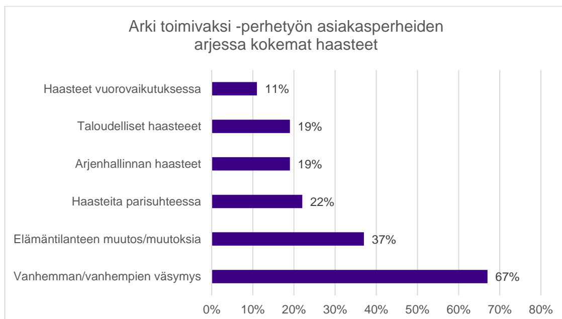
KUVIO 2. Arki toimivaksi -asiakasperheiden arjessa kokemat haasteet asiakaskyselyn pohjalta

Moni perheistä kokee suurimmaksi haasteeksi väsymyksen. Sen seurauksena arjen hallinta kärsii ja saattaa tulla myös haasteita parisuhteeseen. Ajan puute näkyy monissa perheissä. Toiset kaipaavat omaa aikaa tai parisuhdeaikaa ja työssäkäyvät vanhemmat puolestaan kaipaavat lisää aikaa lasten kanssa. Kotityöt, harrastukset ja opiskelu ovat aikaa vieviä. Eroperheessä lasten asuminen vuoroviikoin kummankin vanhemman luona tuo arkeen jatkuvia muutoksia, jotka kuormittavat arkea. Vakavalla tai kivuliaalla sairaudella on vaikutusta koko perheen jaksamiseen ja voimavaroihin. Lasten erityistarpeet, uhmaikä ja uniongelmat vievät myös voimavaroja perheiltä.