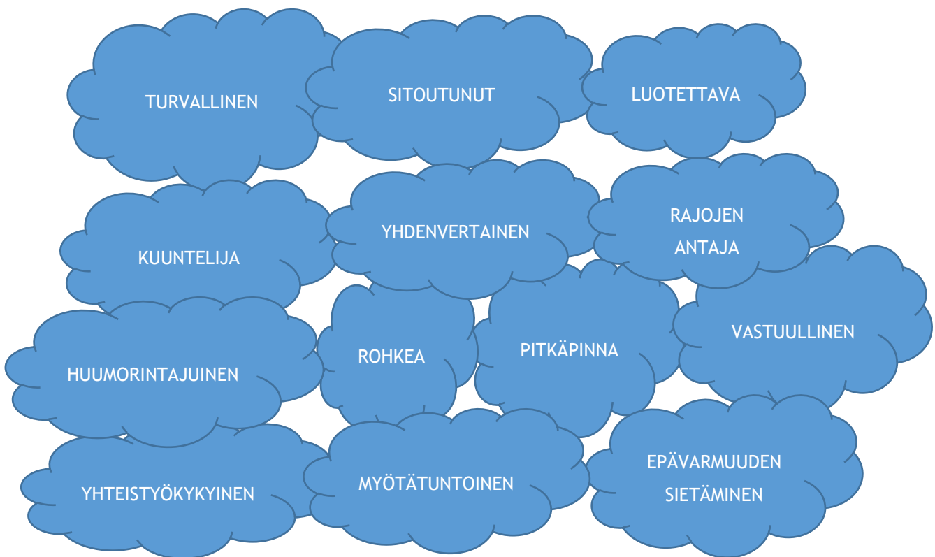
Kuvio 1: Omaohjaajan ominaisuudet

Mut sitä on joskus miettinyt sitä, että ku mä oon vaikka kertonut lapsen kuulumisia, ett kuinka hyvin meil nyt täällä menee. Niin miltä se siitä vanhemmasta tuntuu, ett toi vieras ihminen kertoo mulle niiku miten mun lapsella menee siel muualla missä sen lapsen ei tavallaan edes pitäis olla. (Ohjaaja 2 haastattelu.)