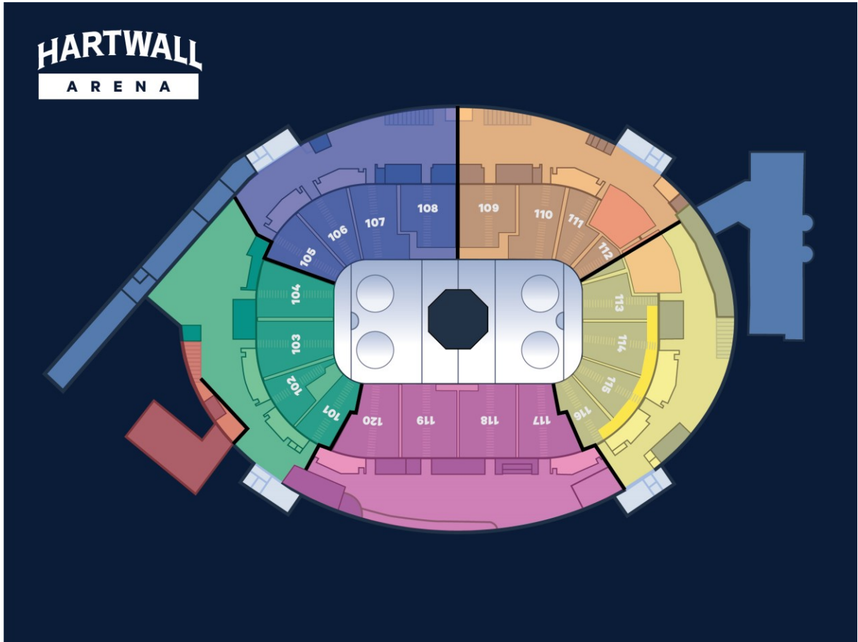
Liite 1: Hartwall Arenan lohkojaot alakerrassa