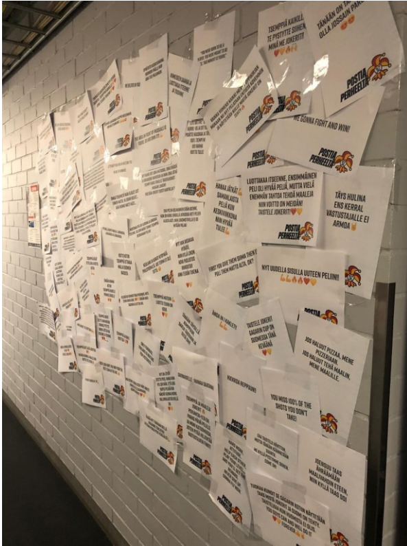
Kuva 2: Postia Perheeltä – kampanjan viestiseinä.