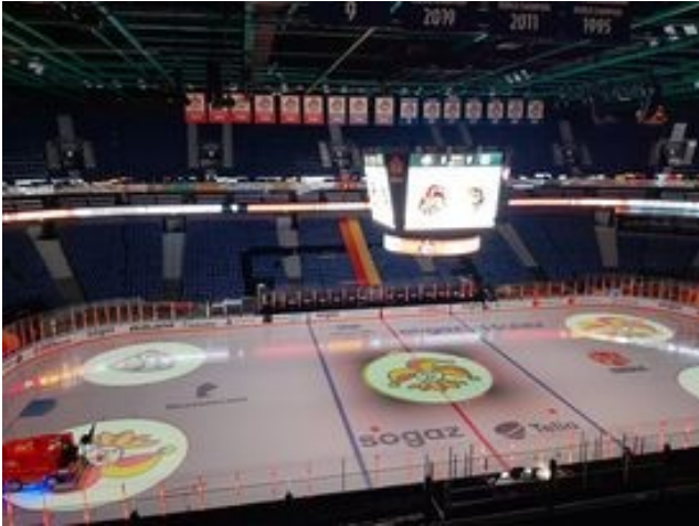
Kuva 1: Ottelun alkuvalmistelut ovat tehty. Ottelu pelattiin ilman yleisöä. Kuva otettiin ohjaamosta.

Ohjaamo on erillinen paikka, josta hallinnoidaan mediakuutiota ja muita teknisiä laitteita sekä kameroita. Oikean ottelutunnelman luomiseksi, ohjaamosta hallinnoidaan myös erilaisia valoja ja paikalla oleva dj, soittaa musiikkia pelikatkoilla. Kameran ovat sijoitettu mediakuution alapuolelle ja ohjaamon kuvaaja on erillisellä tv-tasanteella. Näitä erilaisia kuvakulmia käyttämällä, mediakuutioon saadaan yleisöstä videokuvaa, ja yleisöä voidaan näyttää mediakuutiolla pelikatkoilla.