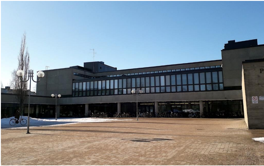
Pohjankartano, massiivinen betonikompleksi ja Madetojan musiikkilukion koti