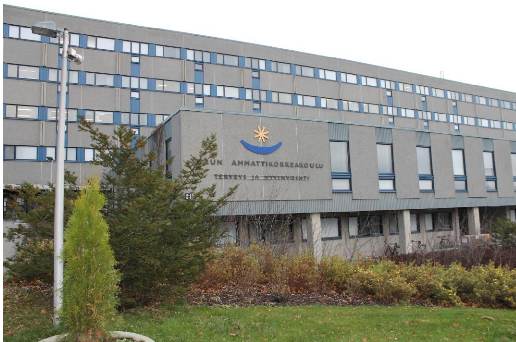
Kuva 4. Vuonna 1979 valmistuneen Turun ammattikorkeakoulun Ruiskadun toimipisteen julkisivu

keakoulu vuokraa noin 16 000 neliometriä käyttöönsä. Tiloissa toimii bioanalytiikan, ensihoidon, fysioterapian, hoitotyön, radiografian ja sädehoidon, sosiaalialan, suun terveydenhuollon sekä toimintaterapian koulutusohjelmat. (Pres-tos07FM. 2009)