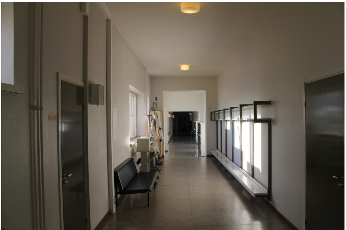
Kuva 6. 1900 -luvun alkupuolella rakennetun Turun ammattikorkeakoulun Sepänkadun toimipisteen käytävä

Tiloihin navigointi rakennuksen sisällä on alussa hankalaa, mutta helpottuu tilojen tullessa tutuksi. Pääaulassa oleva kartta koetaan informatiiviseksi. Vanhalla puolella liikkuminen on mahdotonta liikuntarajoitteisille henkilöille hissien puuttumisen, portaiden sekä kynnysten takia. Kiinteistö on suojeltu kohde, joten hissien rakentaminen kyseiseen kohteeseen ei onnistu.