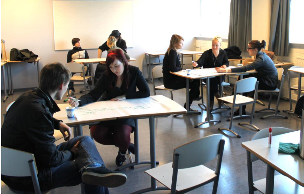
Kuva 1. Opiskelijoiden pienryhmätyöskentelyä tulevaisuusverstaassa