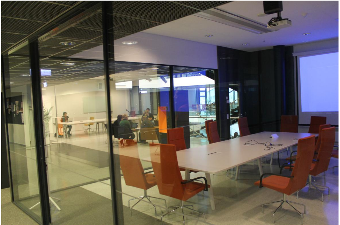
Kuva 8. Porvoon campuksen neuvotteluhuone ja taustalla ryhmätyötila.

Opiskelijoiden mielestä henkilökunnalle sekä opiskelijoille olisi pitänyt järjestää perehdytys rakennuksen käyttöön liittyen. Heille jäi tunne, että tilat olivat vielä keskeneräisiä opetuksen käynnistyessä. Opiskelijajärjestöillä on jaettu toimisto campuksella, mutta yhteisten pelisääntöjen puuttuminen aiheuttaa ajoittain erimielisyyksiä. Kalusteita pidettiin moderneina ja tyylikkäinä, mutta niiden ergonomia sekä käytettävyys koettiin puutteelliseksi. Opetus tapahtuu osittain perinteisellä tyyllillä, mikä edellyttäisi kunnon pulpetteja pelkän tuoliin integroidun levyn sijaan.