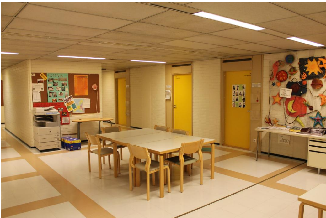
Kuva 5. Ruiskadun toimipisteen käytävä

Yritysyhteistyö on tällä hetkellä vähäistä. Lukuvuoden aikana toteutetaan keskimäärin yksi pilottimuotoinen projekti ulkopuoliselle taholle. Opinnäytetöistä suurin osa tehdään toimeksiantona Turun yliopistolliselle keskussairaалalle tai Turun kaupunginsairaалalle. Yritysyhteistyö koetaan työllistymistä edistävänä tekijänä. Yhteisöllisyyden puuttumiseen vaikuttaa luokkamuotoinen opetus ja yhteisten opintojen vähäinen määrä. Opiskelijat toivovat yhteisöllisyyden lisääntyvän koulun sisällä.