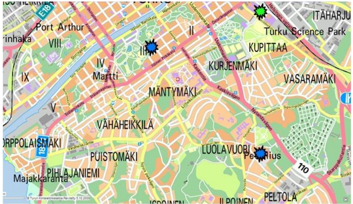
Kuva 3. Turun ammattikorkeakoulun Ruiskadun ja Sepänkadun toimipisteet sinisellä värillä, tuleva Kupittaaan kampus vihreällä

Kupittaaan kampuksen kustannusarvioksi on alustavasti määritelty noin 95 miljoonaa euroa ja sen sijaan opetustoiminnan jatkaminen nykyisissä tiloissa tulisi kustantamaan noin 75 miljoonaa euroa. Tilakeskus on tehnyt hankkeelle alustavan aikataulun, jonka mukaan suunnittelutyö tehdään vuosien 2012–2013 aikana. Rakennustyöt alkavat suunnitelman mukaan vuoden 2014 aikana ja ne olisi tarkoitus saada päätökseen vuoden 2017 aikana. (Turun kaupunki 2012)