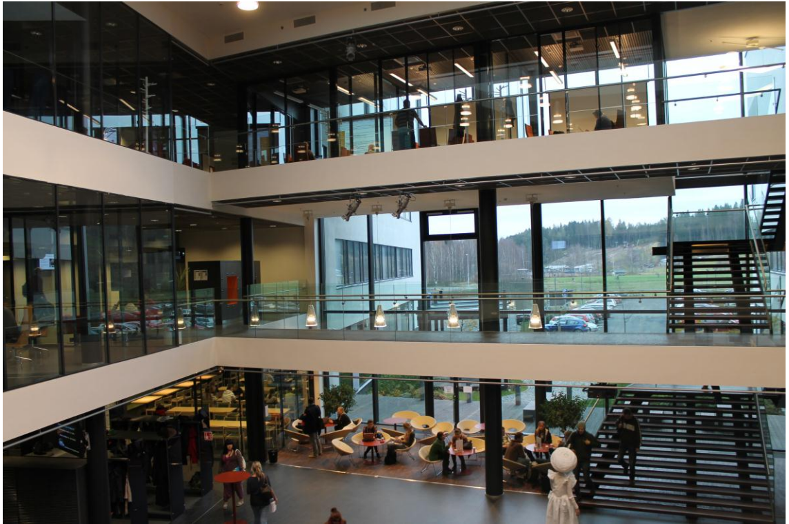
Kuva 7. Vuonna 2010 valmistuneen Porvoon campuksen aula

Haastattelimme Haaga-Helia ja Laurea ammattikorkeakoulujen Porvoon yksiköiden johtajia sekä kolmea Laurea ammattikorkeakoulun opiskelijakunnan edustajaa vierailumme aikana 1.11.2011. Haastattelu toteutettiin teemahaastatteluna ja sitä ohjanneet kysymykset löytyvät liitteistä. Näiden haastattelujen sisältöä on havainnollistettu alla olevissa luvuissa 7.1. ja 7.2. Kappaleissa 7.3 ja 7.4 kerrotaan Porvoon campushankkeen etenemisestä.