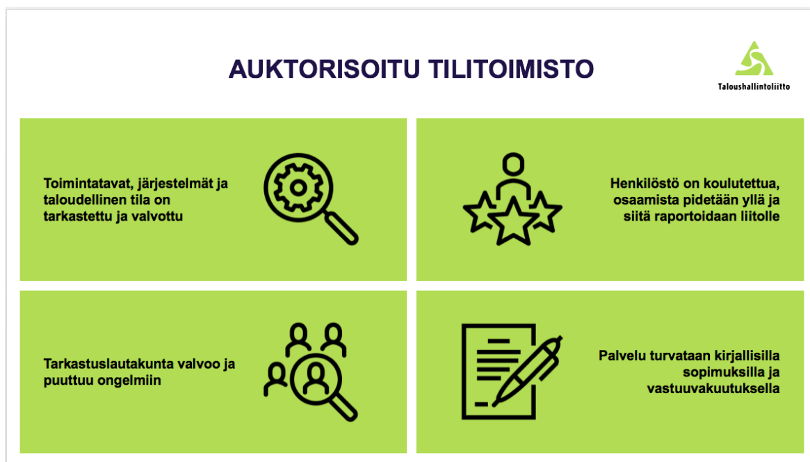
Kuvio 3. Auktorisoitu tilitoimisto. (Suomen Taloushallintoliitto ryb)