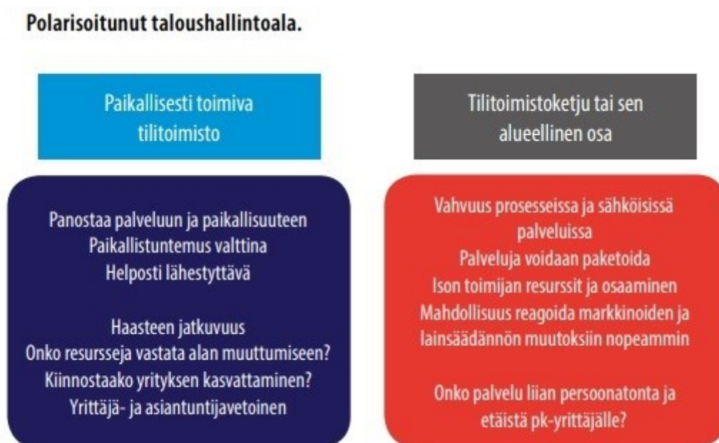
Kuvio 2. Polarisoitunut taloushallintoala. (Metsä-Tokila 2019, 36)

Mikäli asiakkaan tärkein kriteeri tilitoimiston valinnalle on hinta, pidän todennäköisenä, että pienet toimijat eivät voi enää kauaa kilpailla suurten kanssa automatisaation kehittyessä. Toisaalta moni pienyrittäjä saattaa mielellään maksaa hieman korkeampaa hintaa siitä, että palvelu on henkilökohtaista ja asiointi tapahtuu jatkuvasti saman tutun henkilön kanssa.