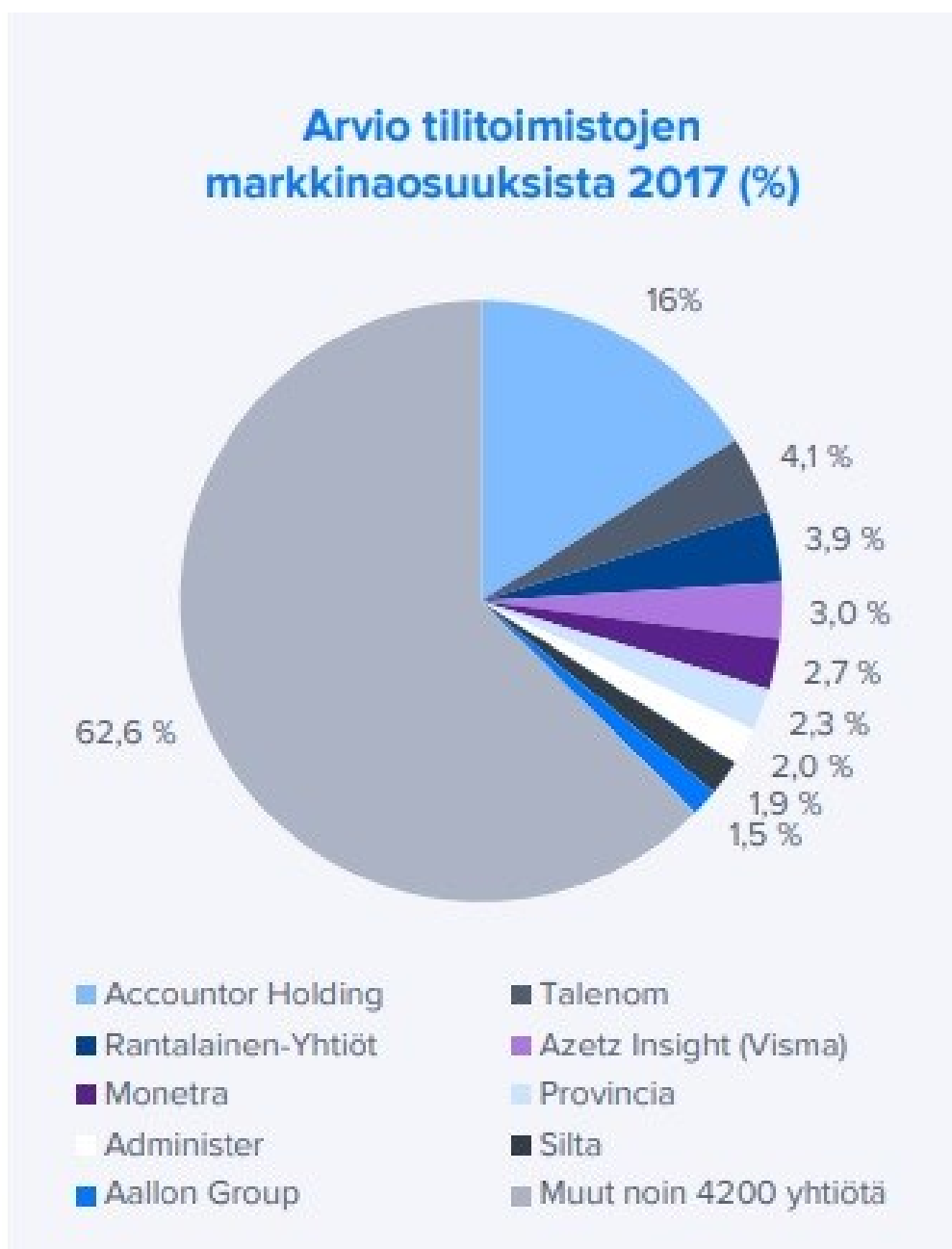
Kuvio 1. Arvio tilitoimistojen markkinaosuuksista 2017 (%). (Inderes 2019, 12)

Tilitoimistoala on myös polarisoitumassa. Alalla toimivat suuret yritykset pyrkivät laajentumaan ostamalla pienempiä tilitoimistoja sekä alaa tukevia asiantuntijayrityksiä, kuten ohjelmisto- ja laskutuspalveluyrityksiä, joiden avulla isot toimijat yrittävät tehostaa toimintaansa sähköisiä palveluja hyödyntäen. Toinen ääripää on hyvin pienet tilitoimistot, jotka panostavat henkilökohtaiseen palveluun, ja varsinkin pienyrittäjät ovat usein uskollisia asiakkaita. (Metsä-Tokila 2019, 35.)