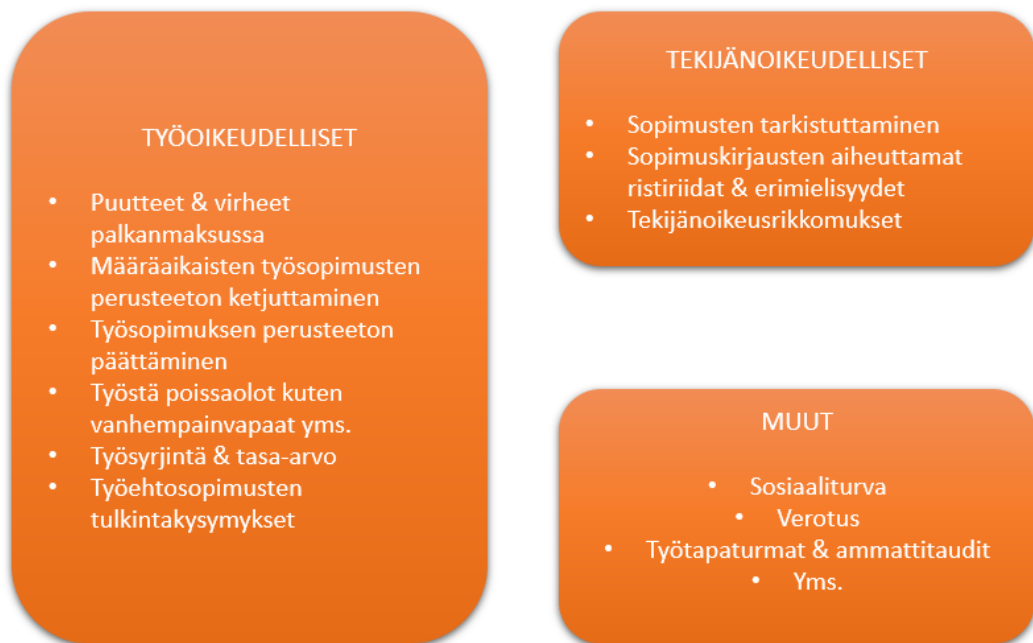
Kuva 5 Juttujen jakautuminen aiheoryhmittäin

suhteen olemassaolon voisi parhaiten varmistaa pyytämällä kirjalliseen työso- pimukseen työsuhteen olemassaolosta kertovan kirjauksen. Mikäli muusikko kuitenkin itse päättää ruveta yrittäjäksi omasta halustaan, ei esitellyn kaltaista ongelmaa pääse syntymään. On voitava olettaa, että vapaaehtoisesti yrittäjä- asemassa oleva muusikko on tietoinen yrittäjyyteen kuuluvista riskeistä ja lain- alaisuuksista.