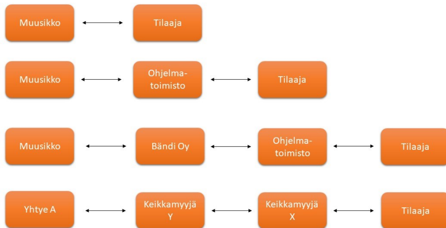
Kuva 1. Sopimusketju (Pokkinen 2020, 84–85.)

Sopimuksen juridisen luonteen lisäksi on tunnistettava oikea sopimuskumppani, sillä sopimuksen tuomat oikeudet ja velvollisuudet sitovat vain sen osapuolia. Muusikon keikkasopimuksen kohdalla voidaan puhua sopimusketjusta, jonka myös Pokkinen (2020, 84–85) esittää. Muusikko voi myydä keikan suoraan tilaajalle, jolloin sopimusketju on lyhin mahdollinen. Mikäli muusikon ja tilaajan välissä on keikkamyymä eli ohjelmatoimisto tai agenttuuri, kasvaa sopimusketju kolmen toimijan pituiseksi. Sopimussuhteet vallitsevat tällöin muusikon ja myyjän sekä myyjän ja tilaajan välillä. Sopimusketju kasvaa, kun siihen lisätään alihankkijoita, promoottoreita tai vaikkapa osakeyhtiömuotoinen yhtye työnantajaksi muusikon ja keikkamyymän väliin. Usean keikkamyymän kuuluminen keikkasopimusketjuun johtuu usein yhteistyösopimuksista yhtyeen ja keikkamyymän sekä keikkamyymän ja tilaajan välillä. Keikkamyymä X voi joutua tilaamaan asiakkaansa haluaman yhtye A:n keikkamyymä Y:ltä, mikäli A ja Y ovat sopineet myynnin yksinoikeudesta keikkamyymäntisopimuksella (Kuva 1). Keikkamyymä- ja tilaajasopimukset kasvattavat sopimusketjua tehden siitä monimutkaisemman käsitellä, mutta samalla ne tehostavat myynti- ja ostotoimintaa pitkäjänteistämällä myyntiä ja helpottamalla ostamista.