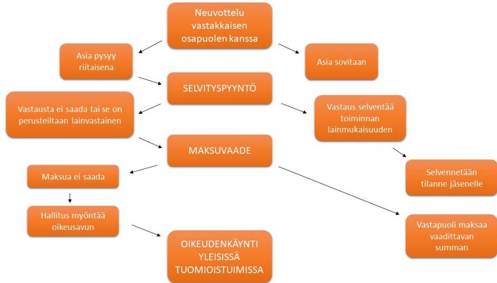
Kuva 4 Sisäinen prosessi riita-asiassa – Toimet asian selvittämiseksi & ratkaisemiseksi

”30.3.2021 keikalle? Sama liksa kuin ennenkin” – tyylinen viesti ja siihen lähetetty myöntävä vastaus täyttävät yhdessä sopimuksen pääelementit.