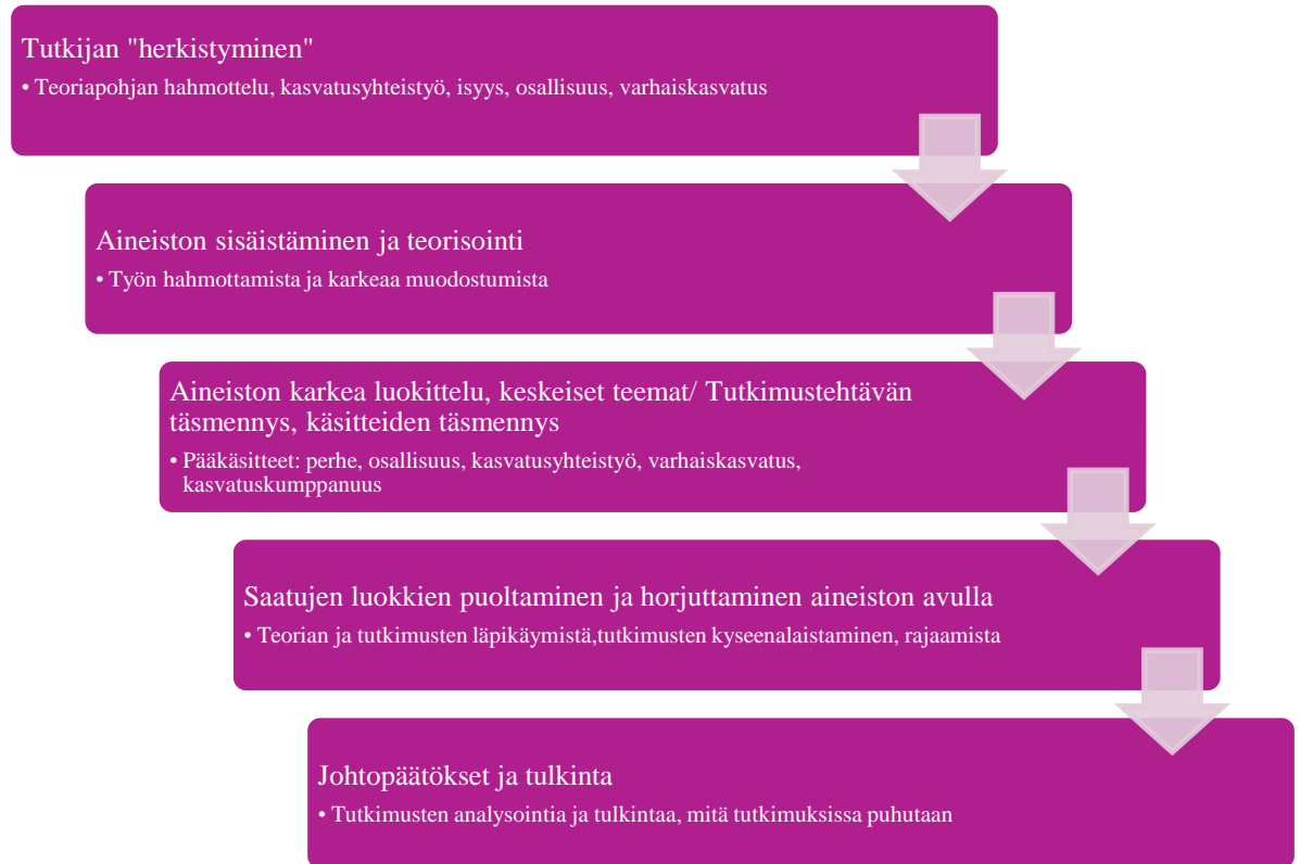
Kuvio 5. Tutkimuksen sisällön analyysin vaiheet Syrjäläisen (1994) mukaan

työssäni tutkia sekä isien että varhaiskasvatuksen henkilökunnan näkökulmaa osallisuudesta, sekä kasvatusyhteistyöstä.