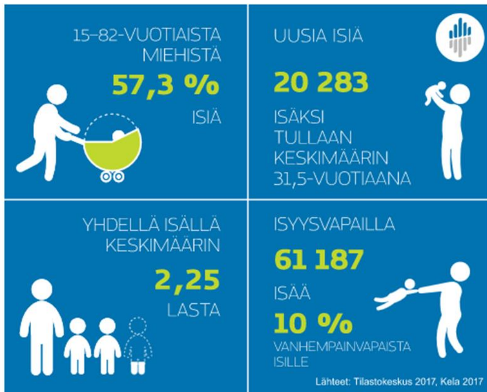
Kuvio 3. Tilastokeskus (2018) Isät tilastoissa 2018.

Isä tilaston mukaan isiä on vuonna 2017 ollut Suomessa 1,26 miljoonaa. Keskimääräisesti isäksi tultiin 31,5-vuotiaana ja yhdellä isällä oli keskimäärin 2,25 lasta. (Kuvio 3.) Ikäluokissa 15- 82 v. yli puolella miehistä oli lapsia. (Tilastokeskus, 2018.)