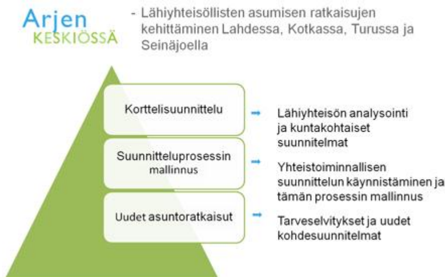
Kuvio1. Arjen keskiössä – projektin tavoitteita (ARA 2012).

Opinnäytetyöni on tilannut Lahden kaupungin vammaispalvelut. Lahden kaupunki on mukana Arjen keskiössä nimisessä hankkeessa ja opinnäytetyöni sivuaa osittain tätä hanketta. Projekti on kaksivuotinen ja se on käynnistynyt keväällä 2012. Projektissa on mukana Lahden lisäksi kolme kaupunkia: Kotka, Seinäjoki ja Turku. Arjen keski- össä – projekti pyrkii etsimään uudenlaisia tapoja järjestää erityisen tuen piiriin kuu- luvien ihmisten asumista tulevaisuudessa. ARA koordinoi hanketta. (ARA 2012.)