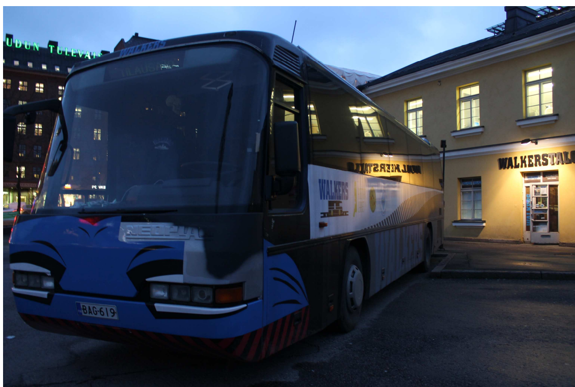
Kuva 4: Nuorisokahvilat ja jalkautuvan työn tukikohdat, harvemmin näin lähekkäin.

tain ”kilpailemaan” nuorista. Toisaalta bussilla on tavoitteena myös verkostotyön parantaminen, joten nuorisotilan viereen ei varsinaisesti mennä kilpailemaan vaan enemmänkin yhteistyöhengessä, alussa ollaan siinä koska siellä ovat nuoret, mutta luottamuksen ja alueen tuntemuksen kasvaessa liikutaan mahdollisesti muualle (Turkka 2012). Miettinen pitää hyvänä, että jalkautuvassa työssä on joku tukikohta, josta nuoret tietävät löytävänsä työntekijän ja jossa nuorten kanssa voi pitää kontaktia yllä. Asiantuntijoiden mukaan jalkautuvaa työtä ja tilatyötä ei pidä nähdä vastakkaisina tai toisiaan pois sulkevinä työmuotoina vaan ennemminkin ne ovat toisiaan täydentäviä. Turkka toteaa: ”Ei perinteistä nuorisotyötä saa lopettaa tietenkään missään. Se tukee tiettyjä nuoria, mutta se jos me halutaan päästä syrjäytyviin nuoriin kiinni, ni sit meidän pitää pystyy erottamaan ne nuoret, jotka on tullu kauppoihin ostoksille ja sit ne nuoret jotka on siellä hengailemassa.” (Turkka 2012.)