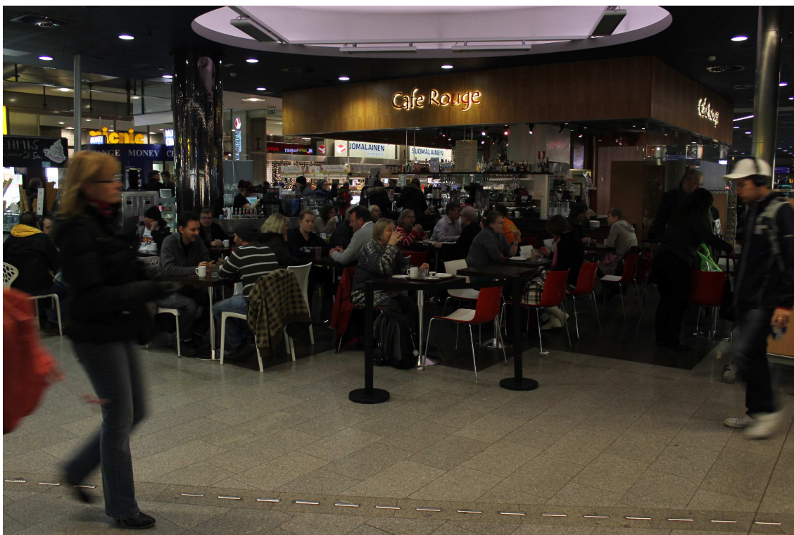
Kuva 3: Saako tähän istahtaa levähtämään ilman kahvikuppia? Huomaan tilanjakaja.

ollen julkisista tiloista tulee myös marginalisoivia, ne ovat olemassa vain osalle ihmisistä. (Nikoskinen 2011b, 18–19 & 51; myös Koskela 2000, 167–170; Kuisisto-Arponen 2008; Villanen 2008, 64.)