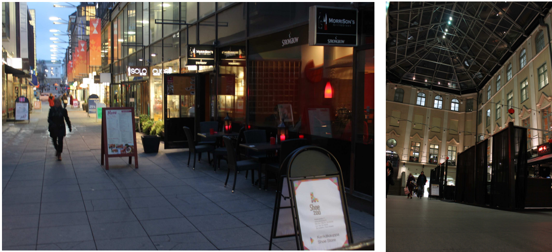
Kuva 1: Lämpömittari lähentelee nollaa, mutta ravintolan sisätila valuu silti ulos kadulle

2008.) Kaikkialle ja kaikentyyppisiin tiloihin ulottuva valvonta hämärtää tilojen rajoja entisestään (Koskela 2000, 170).