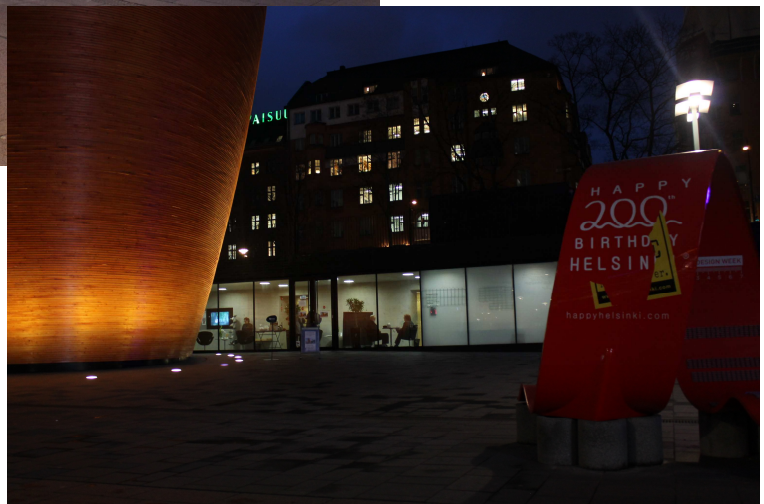
Kuva 5: Kaupunkitilan elävöittämiä ja valtataistelun välineitä