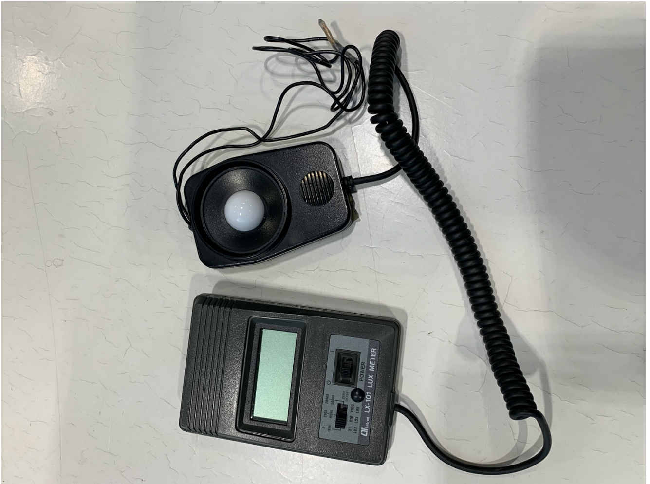
Kuva 1. Luxtron LX-101 valaistusvoimakkuusmittari.