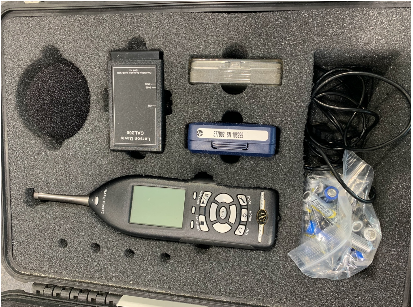
Kuva 2. Larson Davis SoundTrack Lxt 831 äänitasomittari ja Larson Davis Cal200-kalibraattori.

Mittaukset jakautuivat kahdelle eri päivälle, jolloin voidaan katsoa, että saatu mittaustulos on jokseenkin luotettava.