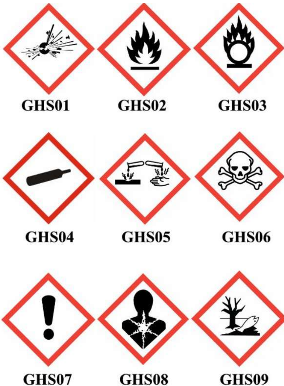
Kuvio 2. Kemikaalien GHS-varoituserkinnät (Yrityshuolto, [viitattu 6.3.2021]).