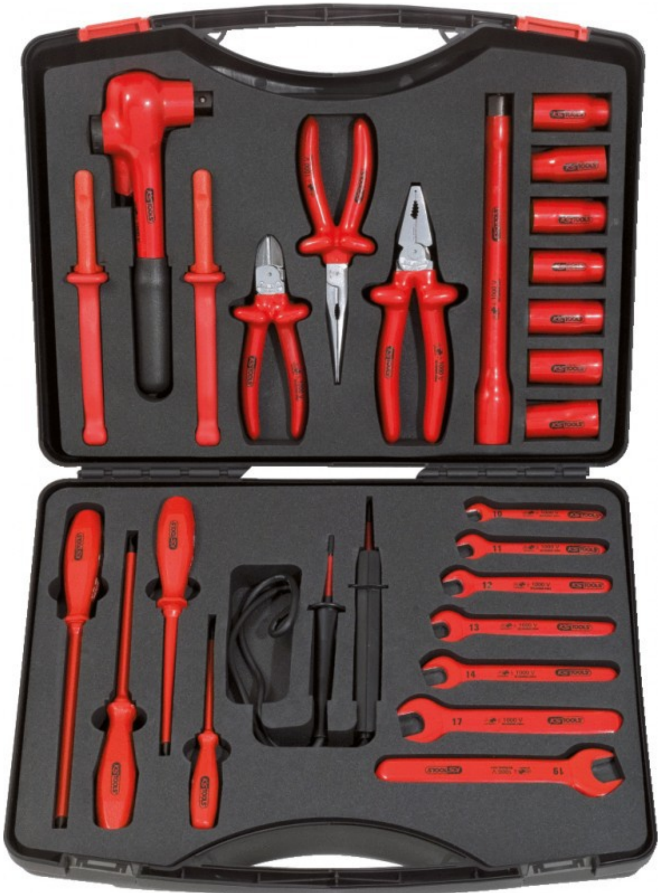
Kuva 3. Korkeajännitetyökalusarja (Silikotek).