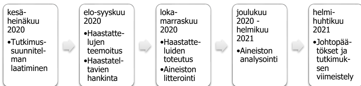
KUVA 3. Tutkimusprosessin eteneminen