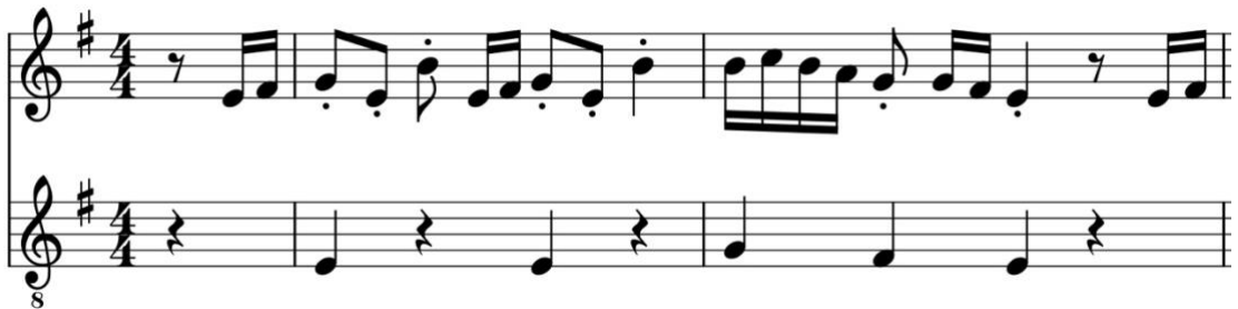
Kuva 5. Ari Pulkkinen – Angry Birds -theme tahtit 1–3.

Kappale itsessään on aika vitsikäs ja humoristinen, vaikka teemana ovat vihaiset linnut. Tätä tunnelmaa voidaan luoda soittamalla kappaleen kahdeksasosanuotit pisteellisinä eli staccato-tekniikalla. Staccato on tekniikka, jossa nuotit soitetaan lyhyinä, katkaisemalla ääni melkein heti sen jälkeen, kun se on soitettu. Tämä voidaan tehdä kahdella tavalla: vasen käsi katkaisee äänen nostamalla sormen hiukan ylös painetusta äänestä, jolloin ääni sammuu. Toinen tapa on oikealla kädellä laittaa vuoronäppäilyormi melkein heti takaisin siihen kieleen, mistä on äänen soittanut. Nuotteihin tämä merkitään pisteellä, joka on nuotin alapuolella. Tämä nähdään esimerkiksi kappaleen alussa tahdeissa 2–4 (kuva 5). Opettaja voi myös soittaa säästyksen staccato-tekniikalla. Staccatoa ei ole merkitty joka paikkaan, sillä se voi olla myös oppilaan ja opettajan yhdessä sopima soittotapa. Soittajan musiikillisen näkemyksen perusteella voidaan sopia, halutaanko soittaa pisteellisiä nuotteja. Esimerkiksi tahdeissa 12–19 kahdeksasosanuotit voidaan soittaa niiden oikeanmittaisina ääнинä. Mutta jos hauskuutta halutaan lisää, voidaan esimerkiksi tahtien 13, 15, 17 ja 18 nuotit (jopa neljäsosanuotit) soittaa pisteellisinä.