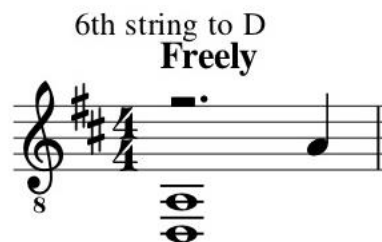
Kuva 1. Mark Knopfler – Going Home (Local Hero) tahti 1.

Oppilas A:n kappale sisälsi arpeggioita ja legatoja. Kappaleen rakenteen pystyi jakamaan rauhalliseen ja menevämpään osioon. Mark Knopflerin Wild theme alkaa orkesterin soittaessa pitkiä ääniä, johon tulee kitara mukaan soittamaan omaa sooloaan vähän ajan kuluttua. Yhdistin nämä efektit kuunnellen, mitä sointuja kitaristi ja orkesteri soittivat yhdessä. Kappale alkaa pitkillä äänillä (kuva 1), ja sitten mukaan tulee melodia ja sointuarpeggiot.