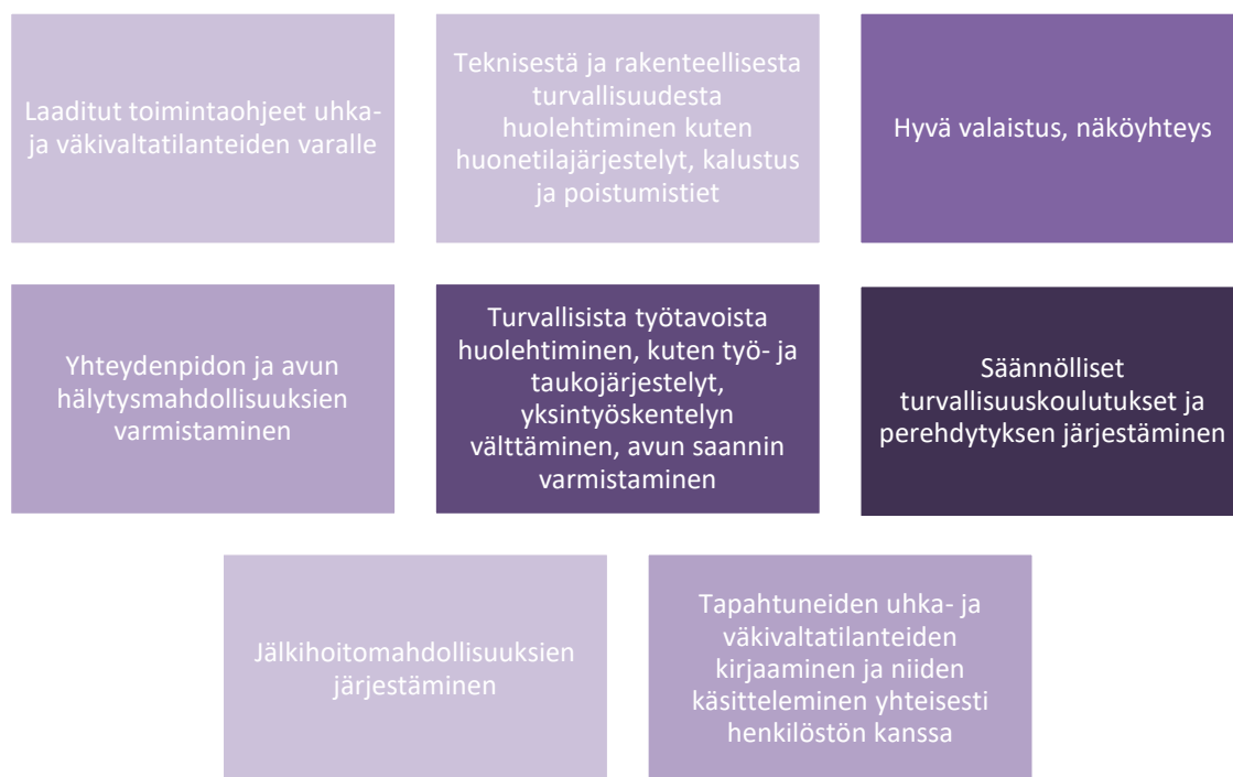
Kuvio 1: Väkivallan hallinnan toimenpiteet (JHL 2016)

JHL:n pääluottamusmies Anu Vihervaara huomauttaa lasten uhkaavan käytöksen tai fyysisen väkivallan, joka kohdistuu varhaiskasvatuksen ammattilaisiin olevan vaikein käsiteltävä asia niin työntekijöille kuin vanhemmillekin. Lapset omaavat vähäiset keinot kuormittumisen hallintaan ja stressireaktioiden käsittelyyn ja tästä seuraa usein tilanteita, joissa lapsi potkii, lyö, puree tai raapii työtilanteessa olevia henkilöitä. Vihervaara muistuttaa kuinka fyysisen koskemattomuuden vahingoittamisella on sama vaikutus, oli kyseessä aikuinen tai lapsi. Se satuttaa. Olemme tietoisia siitä, että lapsi itse ei ole väkivaltainen, vaan lapsen käyttäytyminen aggressiivisesti tai hallitsemattomasti luo työntekijälle uhka- ja työväkivalta kokemuksen. Ammattilaisena ymmärrämme lasta, mutta fyysistä työväkivaltaa, ei tarvitse hyväksyä kenenkään aiheuttamana. (JHL 2016, 46.)