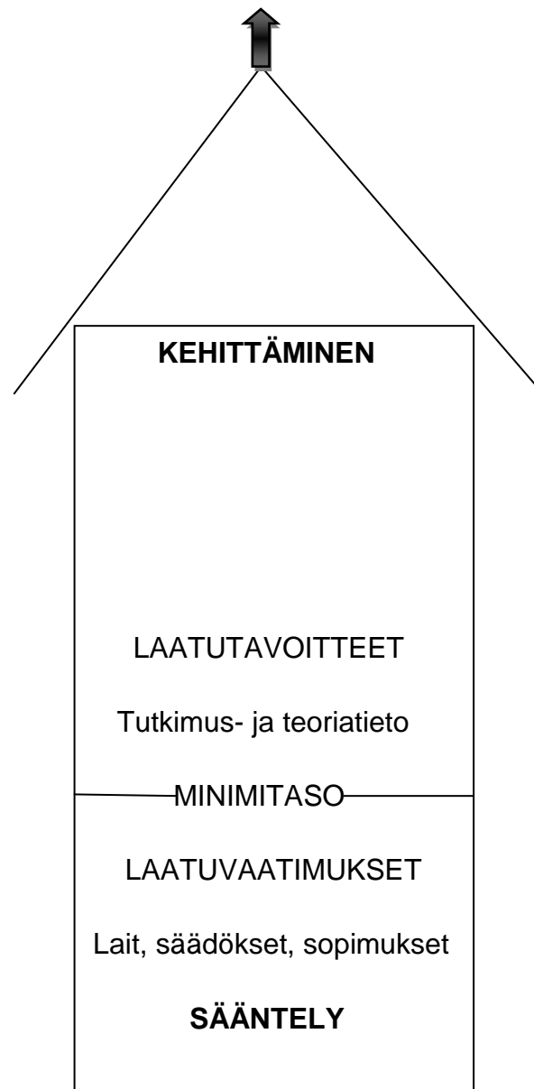
Kuvio 1. Laatutalo (Hujala ym. 1999, 58)