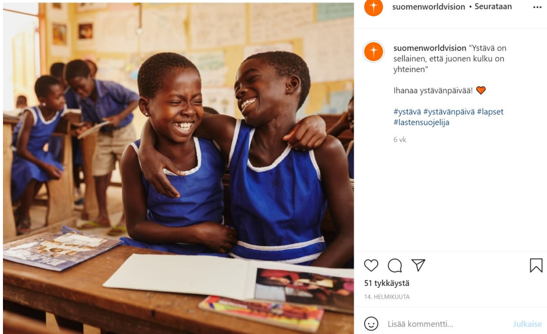
Kuva 11. Kuvakaappaus Suomen World Visionin 14.2.2021 Instagram-julkaisusta.

Ystävänpäivän kunniaksi tehty julkaisu huokuu ystävyyttä, niin sen tekstissä kuin myös kuvassakin. Kuvan etualalla on kaksi iloista, toisiaan halaavaa lasta, jotka istuvat koulupulpetin näköisen pöydän ääressä. Heillä on yllään samanlaiset asut. Kuvan taustalla näkyy, kuinka kaksi muuta lasta ovat keskittyneet jonkin kirjan pariin. Luultavasti toinen heistä auttaa toista jonkin kiperän koulutehtävän kanssa. Voi siis päätellä, että kuva on luokkahuoneesta.