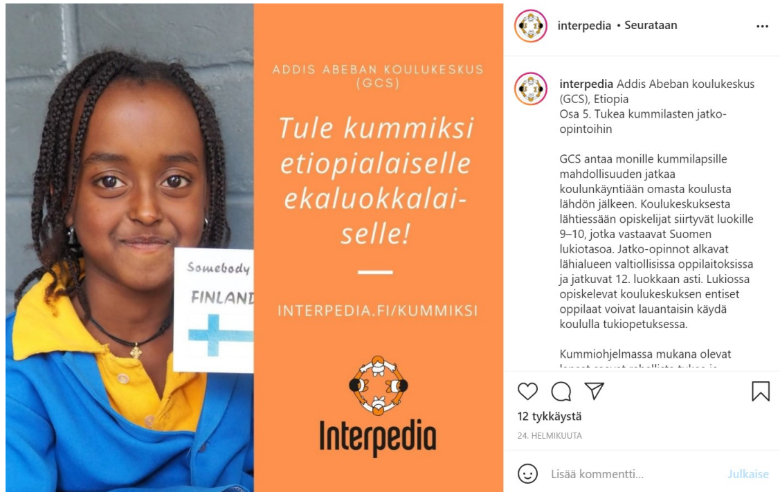
Kuva 6. Kuvakaappaus Interpedian 24.2.2021 Instagram-julkaisusta.

Interpedian julkaisuja koskevan analyysini viimeisessä julkaisussa jatketaan Addis Abeban koulukeskukseen keskittyvällä teemalla. Kuvassa kameraan katsoo erittäin tyytyväisen näköinen lapsi koulupuvussaan. Kuva siis jatkaa hyvin samoilla elementeillä kuin aiemmatkin järjestön kuvat. Nyt kuvaa katsoessa kuitenkin huomio kiinnittyy etualalla olevaan lappuun tai vastaavaan, jossa lukee englanniksi ”somebody” ja sen alla sana ”Finland” sekä kuva Suomen lipusta.