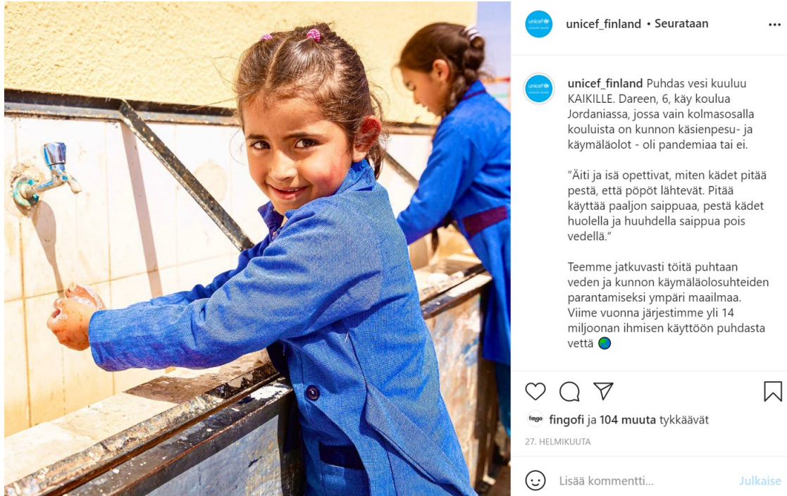
Kuva 18. Kuvakaappaus Suomen Unicefin 27.2.2021 Instagram-julkaisusta.

Kuvassa on kaksi lasta, jotka pesevät käsiään käsienpesualtaalla. Etualalla oleva lapsi katsoo kameraan, ikään kuin hän olisi juuri alkamassa hymyilemään. Taka-alalla oleva toinen lapsi on keskittynyt käsien pesuun. Heillä on molemmilla samanlaiset asut yllään, joiden niiden voisi täten kuvitella olevan koulupuvut.