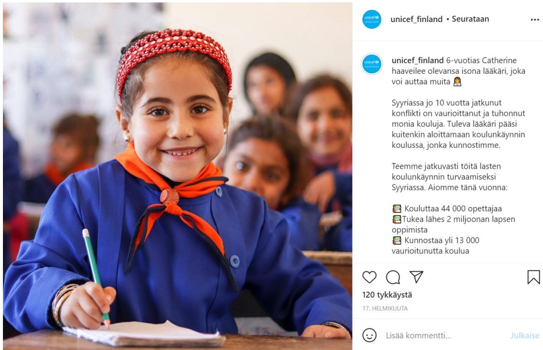
Kuva 16. Kuvakaappaus Suomen Unicefin 17.2.2021 Instagram-julkaisusta.

Kuvan on etualalla kameraan katsova, hymyilevä lapsi, joka kynä kädessään on kirjoittamassa tai piirtämässä pöydällä olevaan vihkoon. Etualalla olevan lapsen takaa erottuu muutama muukin lapsi, jotka ovat pukeutuneet yhdenmukaisiin asuihin. He myös näyttävät katsovan iloisena kameraan päin, vaikka he eivät erotu niin selkeästi kuvasta. Asujen yhteneväisyydestä ja etualalla olevan lapsen kynästä sekä vihosta voi päätellä, että kuva on otettu luokkahuoneessa.