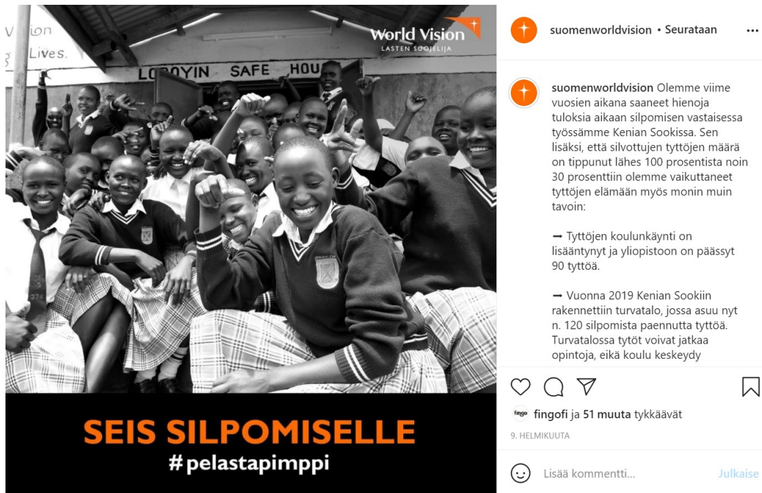
Kuva 8. Kuvakaappaus Suomen World Visionin 9.2.2021 Instagram-julkaisusta.

kerrotaan, mitä lahjoituksen avulla järjestö konkreettisesti tekee estääkseen silpomisen jatkumisen.