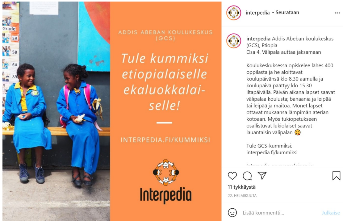
Kuva 5. Kuvakaappaus Interpedian 22.2.2021 Instagram-julkaisusta.

Koulukeskusta koskevan kuvasarjan neljännen osan kuvassa esiintyvät kaksi toisilleen hymyilevää lasta. Julkaisun tekstissä kerrotaan koulukeskuksen 400 oppilaan koulupäivän kulusta ja siitä, kuinka he saavat välipalaa koulusta. Kuvassa esiintyvällä kahdella lapsella onkin käsissään oletetusti päivän välipalat, joten he luultavasti pitävät keskenään välipalataukoa.