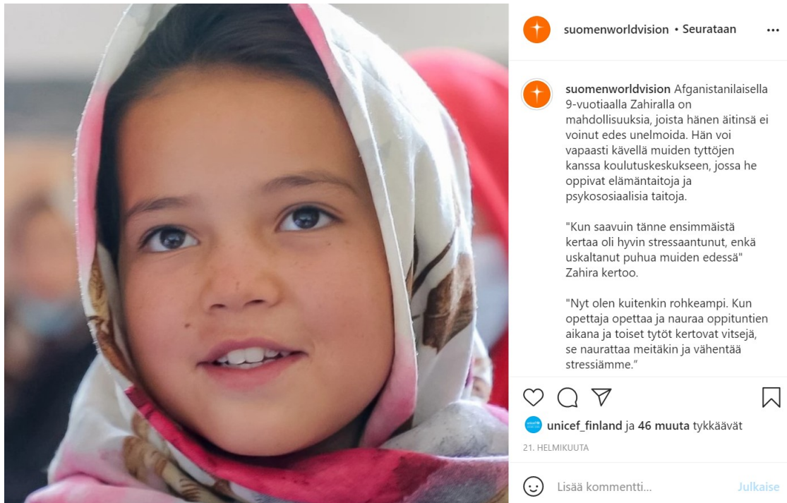
Kuva 13. Kuvakaappaus Suomen World Visionin 21.2.2021 Instagram-julkaisusta.

Julkaisun kuva on lähikuva huivipäisestä lapsesta, joka näyttää siltä, kuin hän olisi juuri sanomassa jotain tai alkamassa hymyilemään. Hän katsoo kameran yläpuolelle, luultavasti kuvan ottajaa päin.