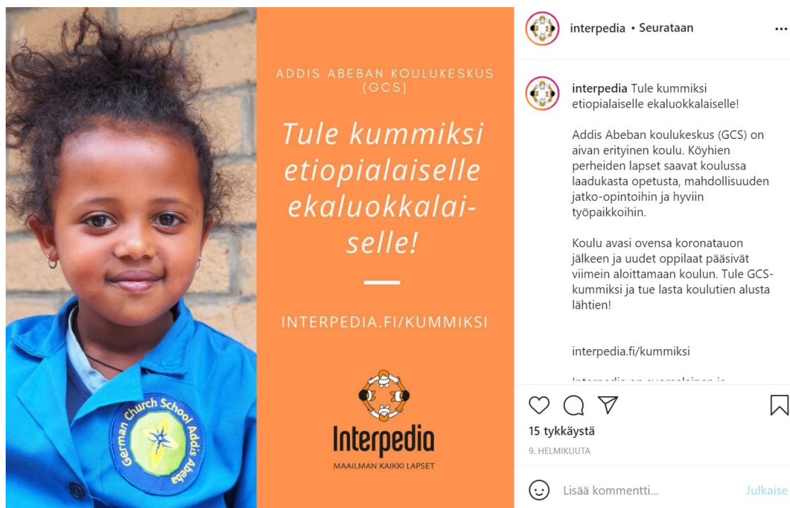
Kuva 1. Kuvakaappaus Interpedian 9.2.2021 Instagram-julkaisusta.

Kuvassa on tyytyväisen näköinen lapsi, joka hieman hymyillen katsoo suoraan kameraan. Lapsella on yllään virallisen näköinen puku, jossa on ilmeisesti koulun logo rinnassa. Julkaisun tekstissä kerrotaan, kuinka Addis Abeban koulukeskus on avattu koronatauon jälkeen, joten oletetusti lapsi seisoo punatiilisen koulukeskuksen edessä koulupuvussaan.