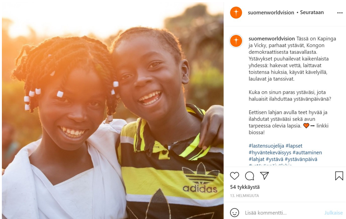
Kuva 10. Kuvakaappaus Suomen World Visionin 13.2.2021 Instagram-julkaisusta.

Julkaisutekstin loppuosa puhuttelee jälleen suoraan katsojaa, kun siinä pyydetään auttamaan silpomisvaarassa olevia tyttöjä sekä lahjoittamaan rahaa tukien järjestön silpomisen vastaista työtä. Lisäksi myös tämän julkaisun lopussa kerrotaan, mitä lahjoituksen avulla järjestö konkreettisesti tekee estääkseen silpomisen jatkumisen.