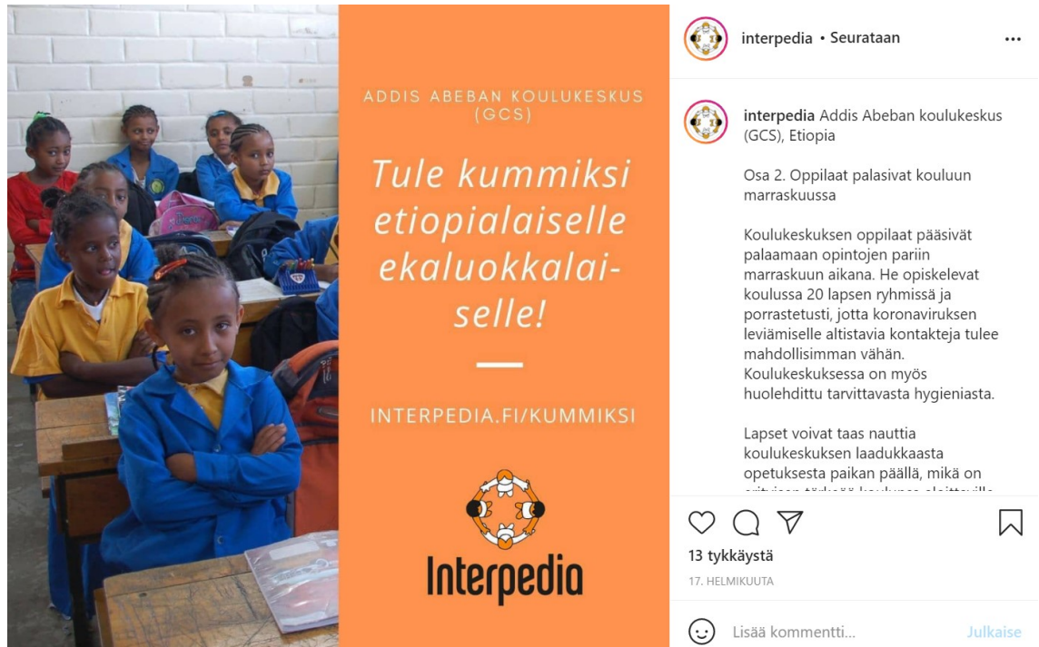
Kuva 3. Kuvakaappaus Interpedian 17.2.2021 Instagram-julkaisusta.

Kuva on jatkumoa 9.2.2021 päivän julkaisulle. Nyt kuva on oletetusti Addis Abeban koulukeskuksen luokahuoneesta, jossa lapset istuvat pulpettiensa äärellä. He ovat hieman ujonoloisia, mutta silti hyvin määrätietoisia näköisiä, koska lähes jokaisella on kädet puuskassa. Julkaisun tekstissä kerrotaan koulukeskuksen uudelleen avautumisesta koronatauon jälkeen, ja siinä korostetaan sitä, kuinka koulukeskuksen opetuksessa ennaltaehkäistään koronaviruksen leviämistä pienemmillä ja porrastetuilla ryhmillä hygieniasta huolehtien.