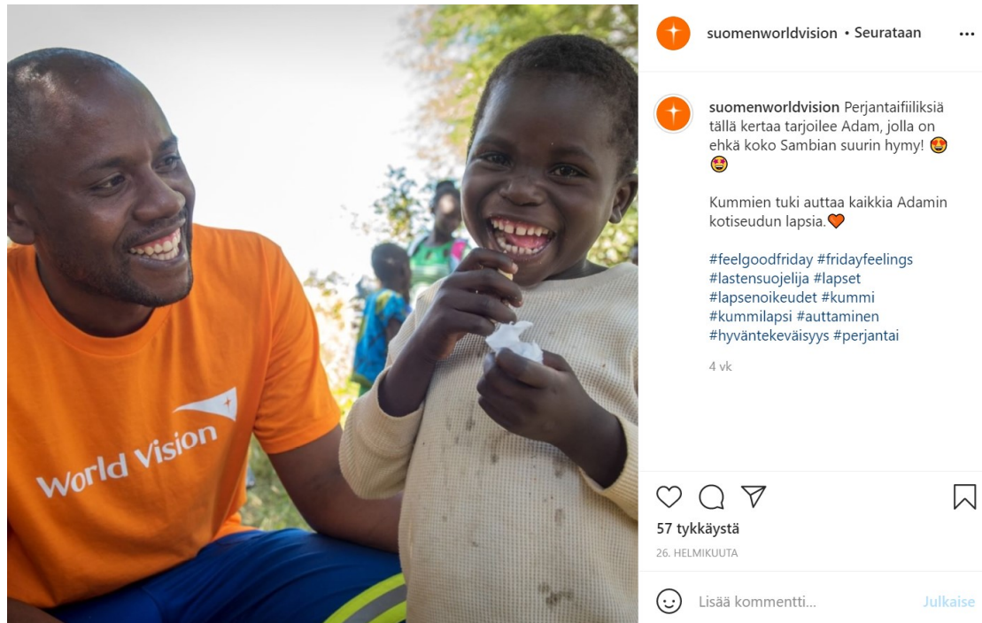
Kuva 15. Kuvakaappaus Suomen World Visionin 26.2.2021 Instagram-julkaisusta.

Kyseessä näyttäisi olevan perjantain tunnelmaa kohottava julkaisu. Kuvassa on etualalla kaksi henkilöä, jotka molemmat hymyilevät iloisen näköisenä. Vasemmalla oleva on aikuinen, jolla on World Visionin paita yllään ja oikealla on lapsi, joka katsoo kameraan. Aikuinen on ikään kuin laskeutunut lapsen tasolle ja hymyn perusteella näyttäisi siltä, että he tulevat hyvin toimeen keskenään. Paidan perusteella voisi kuvitella, että aikuinen on järjestön työntekijä.