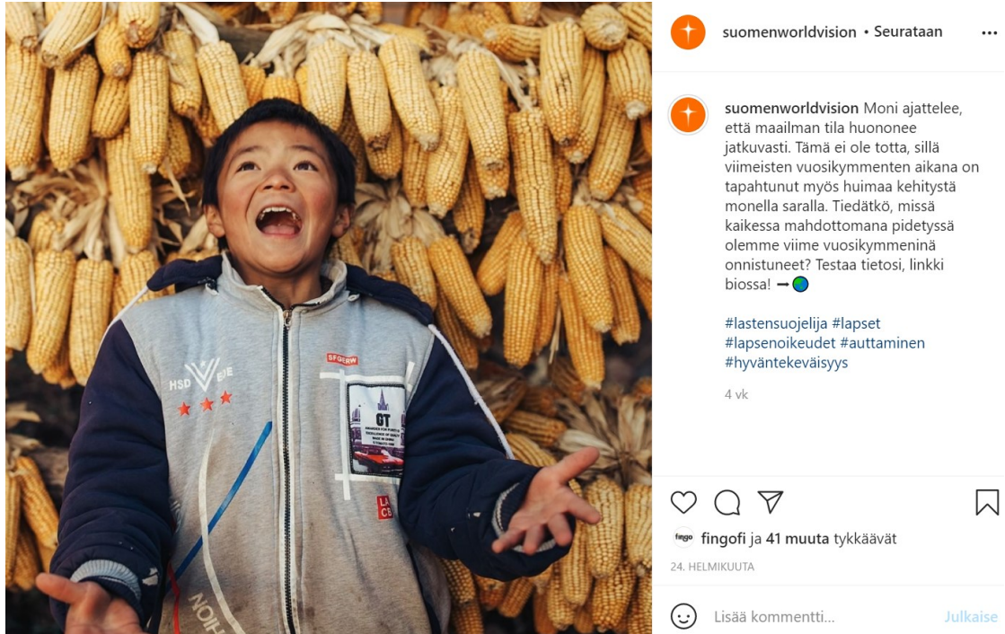
Kuva 14. Kuvakaappaus Suomen World Visionin 24.2.2021 Instagram-julkaisusta.

Julkaisun kuvassa on iloisen näköinen lapsi, joka seisoo tai hyppelhtii maissintähkien edustalla.