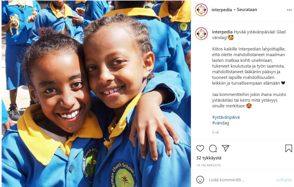
Kuva 2. Kuvakaappaus Interpedian 14.2.2021 Instagram-julkaisusta.

Julkaisu on tehty ystävänpäivänä, ja se näkyy sekä kuvassa että julkaisun tekstissä. Kuvassa kameraan katsovat koulupuvuissaan kaksi hymyilevää lasta, jotka selkeästi ovat hyviä kavereita. He ovat mahdollisesti koulun pihalla, koska taustalla näkyy muita lapsia samanlaiset koulupuvut yllään.