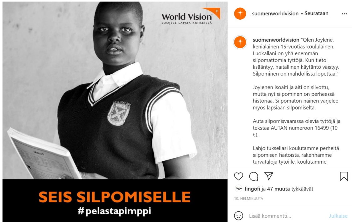
Kuva 9. Kuvakaappaus Suomen World Visionin 10.2.2021 Instagram-julkaisusta.

Tämä julkaisu jatkaa edelleen Seis Silpomiselle - Pelasta Pimppi -kampanjan sanomaa. Julkaisu on hyvin samanlainen kuin 3.2. julkaisu, koska se keskittyy jälleen yksittäisen lapsen tarinaan ja siihen, miten järjestön silpomisen vastainen työ on auttanut häntä.