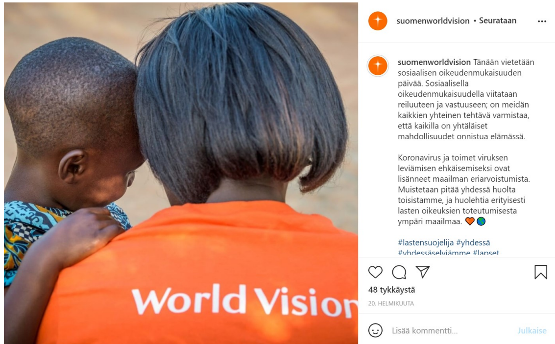
Kuva 12. Kuvakaappaus Suomen World Visionin 20.2.2021 Instagram-julkaisusta.

Julkaisu on tehty sosiaalisen oikeudenmukaisuuden päivän kunniaksi, joka tulee ilmi julkaisutekstin ensimmäisestä lauseesta.