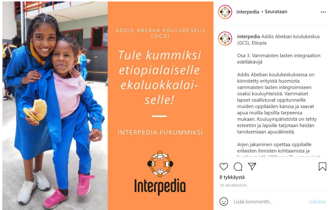
Kuva 4. Kuvakaappaus Interpedian 19.2.2021 Instagram-julkaisusta.

Addis Abeban koulukeskuksesta kertova julkaisusarja jatkuu. Julkaisun kuvassa on kaksi iloista lasta, joista toinen katsoo kameraan ja toinen kameran ohi. Takana näkyy oletetusti Addis Abeban koulukeskus, joten lapset ovat mahdollisesti välitunnilla. Julkaisun tekstissä kerrotaan, kuinka koulukeskuksessa kiinnitetään erityistä huomiota vammaisten lasten integroimiseen osaksi koulu yhteisöä, ja kuinka vammaiset lapset jakavat samat oppi- ja välitunnit muiden lasten kanssa.