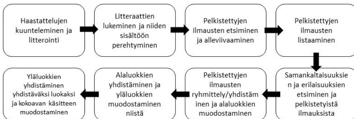
KUVA 1. Aineistolähtöinen sisällönanalyysi (Tuomi ja Sarajärvi 2018, 123).

Opinnäytetyön tutkimuksessa käytettiin aineistolähtöistä sisällönanalyysia. Aineistolähtöinen sisällönanalyysi soveltui opinnäytetyöhön, sillä tutkimme asunnottomien kokemuksia. Opinnäytetyön analyysissa käytettiin Tuomen ja Sarajärven (2018, 122–127) aineistolähtöisen sisällönanalyysin etenemisen mallia. Seuraavaksi esitetään käytetty malli (Kuva 1.) ja kerrotaan, kuinka sitä on sovellettu analyysissa.