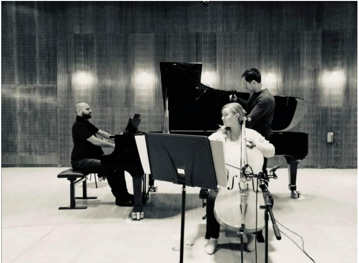
Kuvio 7. Äänitysprosessi

Lopulta saimme valittua parhaimmat otot. Tämän jälkeen Mattioli yhdisti otot ja sonaatti valmistui.