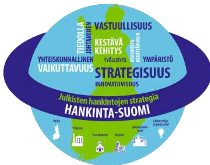
Kuva 6. Hankinta-Suomi (Valtiovarainministeriö s.a.)

Jo yllä mainituissa kappaleissa on puhuttu siitä, että julkisten hankintojen tavoitteena on tehokas, kestävä ja tuloksellinen hankintatoimi. Jotta julkiset yritykset toteuttavat hankintojaan kestävästi, on vuonna 2019 otettu käyttöön Vaikuttavat julkiset hankinnat -toimenpideohjelma eli Hankinta-Suomi.