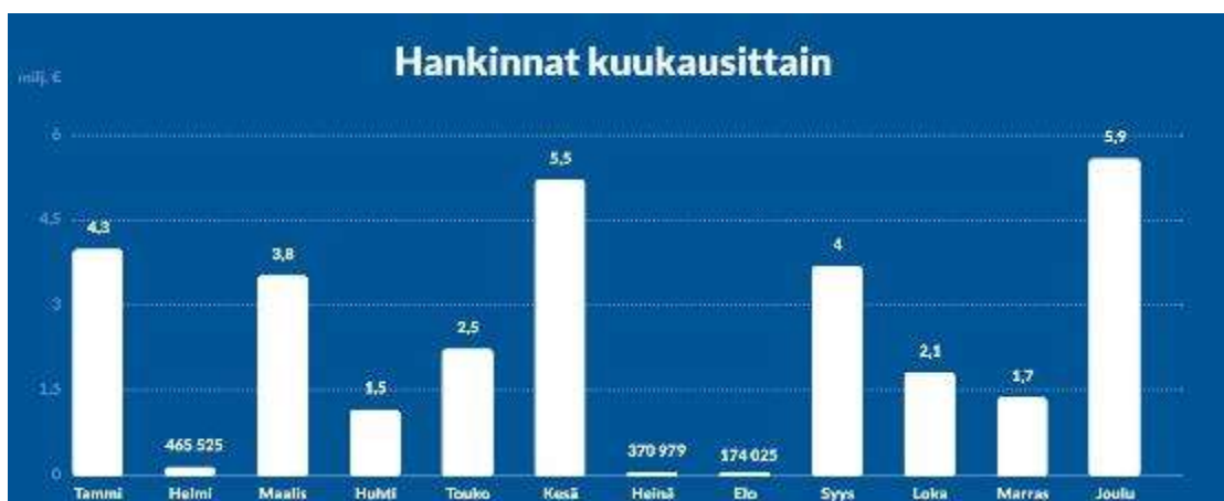
Kuva 8. Hankinnat kuukausittain (Tutki hankintoja s.a.)

ICT-laitteiden hankintoja on tehty kuukausittain vuoden 2019 aikana oheista kuvaa 7 analysoiden vaihtelevissa määrin kuitenkin suhteessa kohtuullisen paljon. Tutki hankintoja -nettisivulla on eritelty hankintakategorioittain, toimittajakohtaisesti sekä hankintayksiköittäin Suomessa tapahtuvat hankinnat, jotka ovat julkisesti valtion sekä kansalaisten nähtävänä. Vuoden 2019 alusta vuoden 2019 loppuun mennessä ICT-laitteiden hankintoja tehtiin valtiolla noin 31 000 000 miljoonaa euroa. Suurimmaksi toimittajaksi osoittautui 3Step It Oy, jolta on hankittu laitteita noin 14 miljoonan euron edestä. Suurimmaksi hankintayksiköksi osoittautui taas valtion tieto- ja viestintätekniikkakeskus Valtori, joka on tehnyt hankintoja noin 26 miljoonaa euron edestä. Nousua vuoden 2018 takaisin hankintoihin yleisesti on tehty noin 10 %. (ICT-laitteet s.a.)