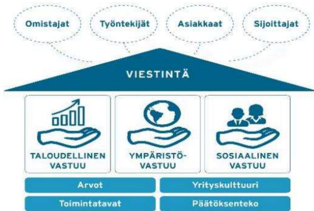
Kuva 5. Yritysvastuun iso kuva (Vanhanen ym. 2019)

Seuraavassa kuvassa Vanhala ym. (2019) ovat eritelleet kuvaannollisesti talon muodossa, mihin eri osa-alueet sijoittuvat elementteinä ja mikä on niiden panos hyvän yritysvastuun toteuttamisen kannalta.