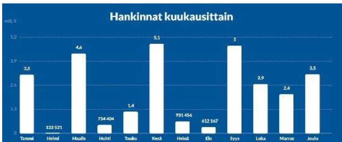
Kuva 7. Hankinnat kuukausittain (Tutki hankintoja s.a.)

ICT-laitteiden hankintoja on tehty kuukausittain vuoden 2019 aikana oheista kuvaa 7 analysoiden vaihtelevissa määrin kuitenkin suhteessa kohtuullisen paljon. Tutki hankintoja -nettisivulla on eritelty hankintakategorioittain, toimittajakohtaisesti sekä hankintayksiköittäin Suomessa tapahtuvat hankinnat, jotka ovat julkisesti valtion sekä kansalaisten nähtävänä. Vuoden 2019 alusta vuoden 2019 loppuun mennessä ICT-laitteiden hankintoja tehtiin valtiolla noin 31 000 000 miljoonaa euroa. Suurimmaksi toimittajaksi osoittautui 3Step It Oy, jolta on hankittu laitteita noin 14 miljoonan euron edestä. Suurimmaksi hankintayksiköksi osoittautui taas valtion tieto- ja viestintätekniikkakeskus Valtori, joka on tehnyt hankintoja noin 26 miljoonaa euron edestä. Nousua vuoden 2018 takaisin hankintoihin yleisesti on tehty noin 10 %. (ICT-laitteet s.a.)