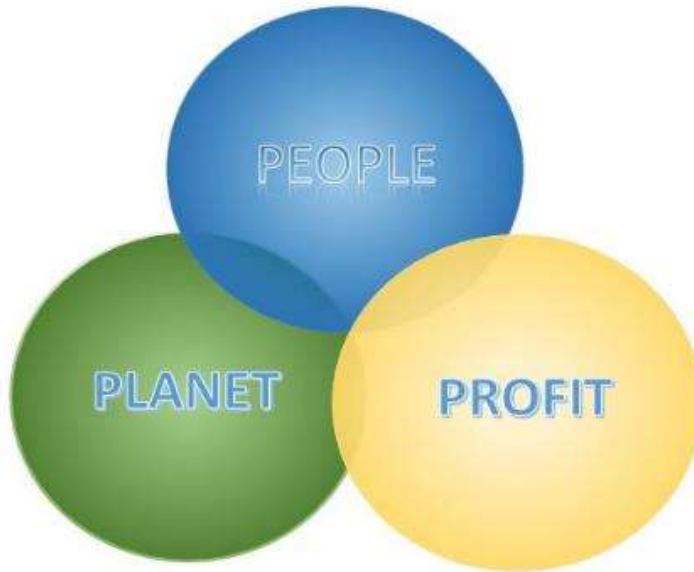
Kuva 2. Kolmoistilin päätös (Sinkkonen 2021)

Tänäkin päivänä tätä menetelmää käytetään niin Suomessa kuin kansainvälisesti. Vastuullisen hankinnan kannalta Semeijn ym. (2019) toteavat, että Triple Bottom Line pitäisi asettaa hankintayksiköiden päätöksentekokriteereihin ja tätä kautta pystyttäisiin vaikuttamaan positiivisesti hankintoihin.