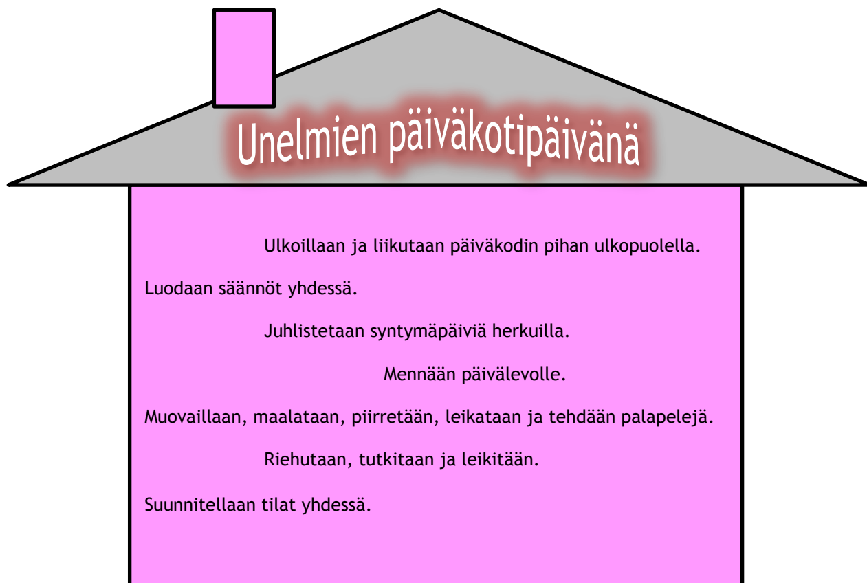
Kuvio 3: Unelmien päiväkotipäivä

Lasten toiveet olivat pääsääntöisesti arkisia, sellaisia joita voisi hyödyntää päiväkotipäivän suunnittelussa. Aineistoa ja niistä saatuja tuloksia oli niin vähän, ettemme voineet tehdä kovin pitkälle meneviä johtopäätöksiä tai yleistyksiä. Seuraava kuvio on yhteenveto tuloksista ja sen tarkoitus on ilmentää, minkälaisista asioista unelmien päiväkotipäivä rakentuu.