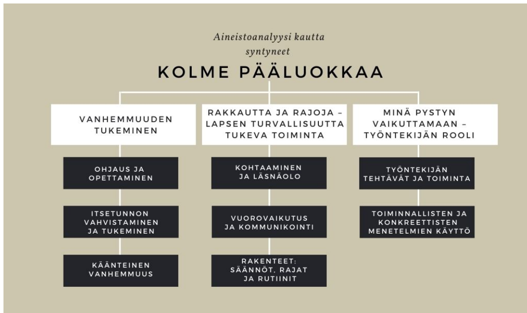
Kuva 4. Aineiston analyysin kautta syntyneet pääluokat yläluokkineen.

Lukemisen selkeyttämiseksi tutkimustulokset on eritelty alaotsikoiden alle pää- ja yläluokkineen. Tulosten esittämistä elävöitetään käyttämällä runsaasti suoria lainauksia tutkimusaineistosta. Lainaukset myös tukevat analyysia ja työn luotettavuutta. (Hirsjärvi ym., 2007 ss. 27, 228) Aineiston analyysin kautta syntyneet pää- ja yläluokat ovat havainnollistettuna alla olevassa kuvassa (Kuva 4).