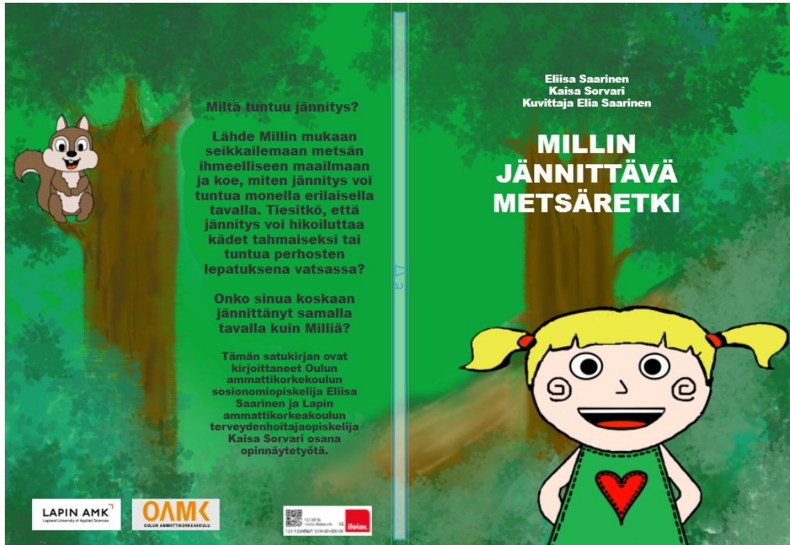
KUVIO 1. Millin jännittävä metsäretki -kirjan kannet

Jos oikein tarkasti katsoo, voi nähdä kaukana kumpuraisella kukkulalla seisovan pienen punaisen talon. Talon ympärillä kasvaa valtavasti sateenkaaren värisiä kukkia. Talo on Millin koti. Millillä on isä, äiti ja kaksi veljeä.