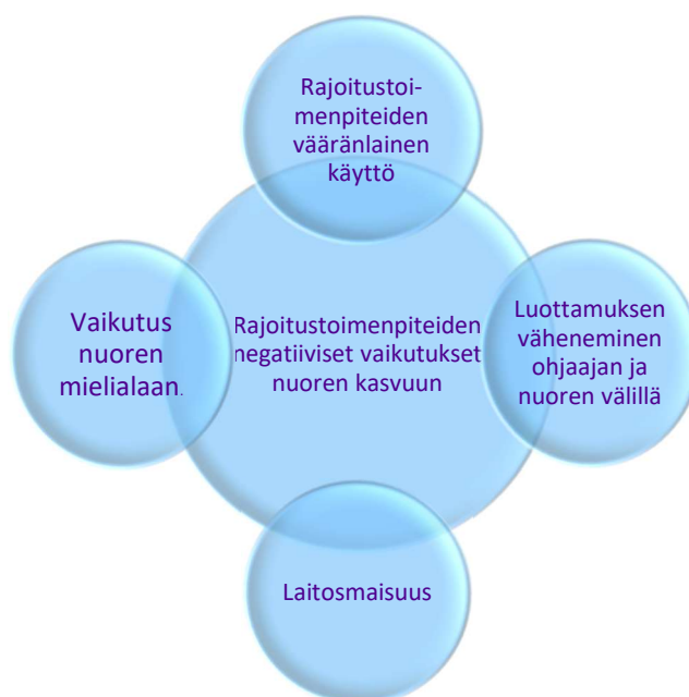
KUVIO 3. Rajoitustoimenpiteiden negatiiviset asiat nuoren kasvun tukemisessä.