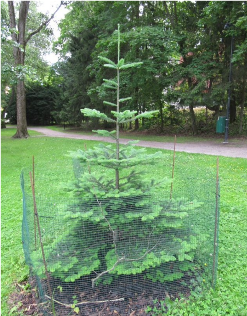
Kuva 9. Purppurapihdan taimi