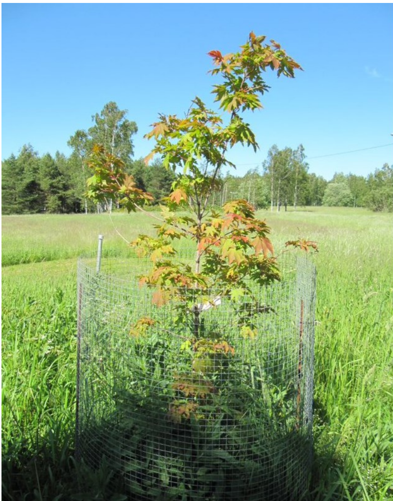
Kuva 7. Koreanvaahteran taimi

Koristekasvina koreanvaahtera on vähän käytetty runsaan japaninvaahtera ( Acer palmatum ) valikoiman takia, josta löytyy satoja lajikkeita. Japaninvaahteran talvenkestävyys on kuitenkin selvästi heikompi koreanvaahteraan verrattuna. (Dirr, 2011, s. 41 ja s. 49) Menestymisvyöhykkeet ovat alkuperästä riippuen I-III(-V) (Mustila arboretum, n.d.).