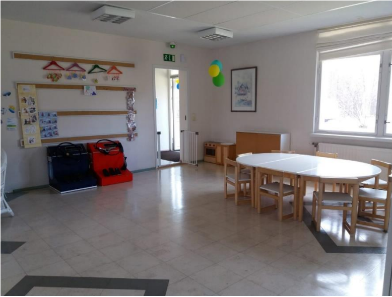
KUVA 1. Pappilan leikkihuone eli oleskelutila (Kemppainen 2021.)