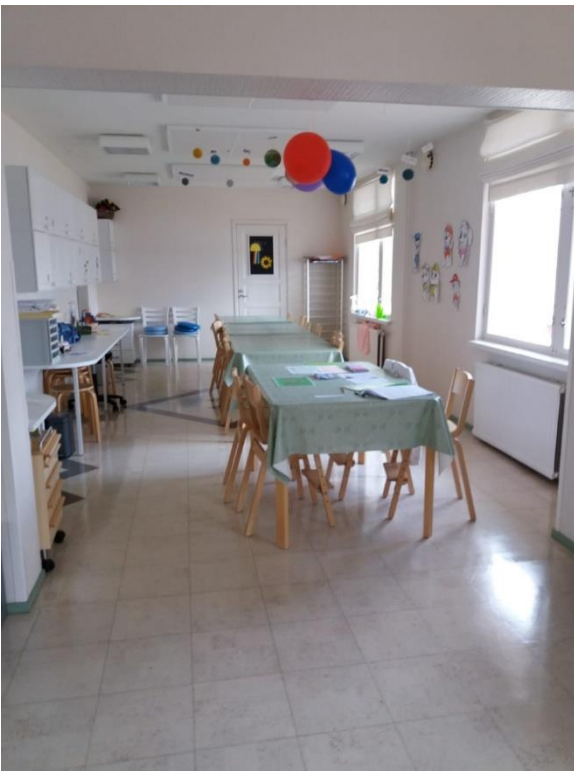
KUVA 2. Pappilan askarteluja ruokailutila (Kemppainen 2021.)