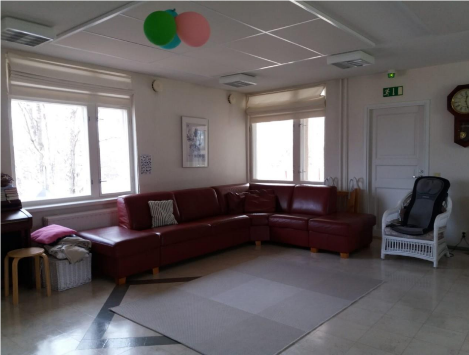
KUVA 3. Pappilan leikkihuone eli olohuone (Kemppainen 2021.)

Sodankylän seurakunnan tilat ovat avarat ja valoisat. Lapsilla on riittävästi tilaa leikkiä ja touhuta. Niin kuin aiemmin kerroinkin, on huomattavasti helpompaa suunnitella ja toteuttaa kerhon toimintaa hyvissä ja toimivissa tiloissa. Sodankylässä pappilassa tilat on jaettu siten, että on erillinen eteinen, josta pääsee leikkihuoneeseen (KUVA 1). Oleskelutilassa ja leikkihuoneessa (KUVA 3) mukavasti lapsilla tilaa leikkiä, mutta myös vanhemmille on mahdollisuus istuutua mukavasti. Askartelutila ja ruokailutila ei ole erotettu ovella, mutta askartelutila on kuitenkin syvennyksessä, joka luo erillisen tilan. Ryhmän kanssa on helpompaa toimia, kun tilat ovat jollain tapaa jaetut. Turvallisuus ja terveellisyys on kerhotoiloissa tärkeää. Lapset ovat paljon lattialla ja siksi pitää huolehtia, että lattia on puhdas ja lämmin. (Lindfors 2000, 18.) Pappilassa tämä toteutuu hyvin, koska tilat ovat soveltuvat kaiken ikäisille lapsille. Seurakuntien varhaiskasvatuksen lapsiryhmät toimivat usein sellaisissa tiloissa, joissa on muitakin eri-ikäisiä ryhmiä ja käyttäjiä. Tämä saattaa asettaa ohjaajille haasteita toimintaympäristön suunnittelussa. (Kaihlainen 2013, 85.) Sodankylässä pappilan tiloihin soveltuu kaiken ikäiset lapset.