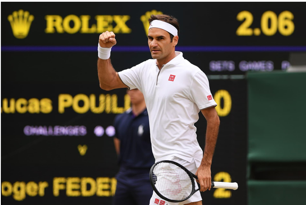
20 Grand slamia voittanut Sveitsiläinen Roger Federer Wimbledonissa 2019.

Lähestyn tätä ajatusta puhtaudesta ja valkoisuudesta tenniksen yhteydessä, koska olen kiinnostunut maailman vanhimman ja arvostetuimman Wimbledonin pukeutumissäännöistä, jotka koen valkoisen eliittilajin estetiikan kulminoituu misena. Minusta on kiinnostavaa että maailman arvostetuimmassa ja