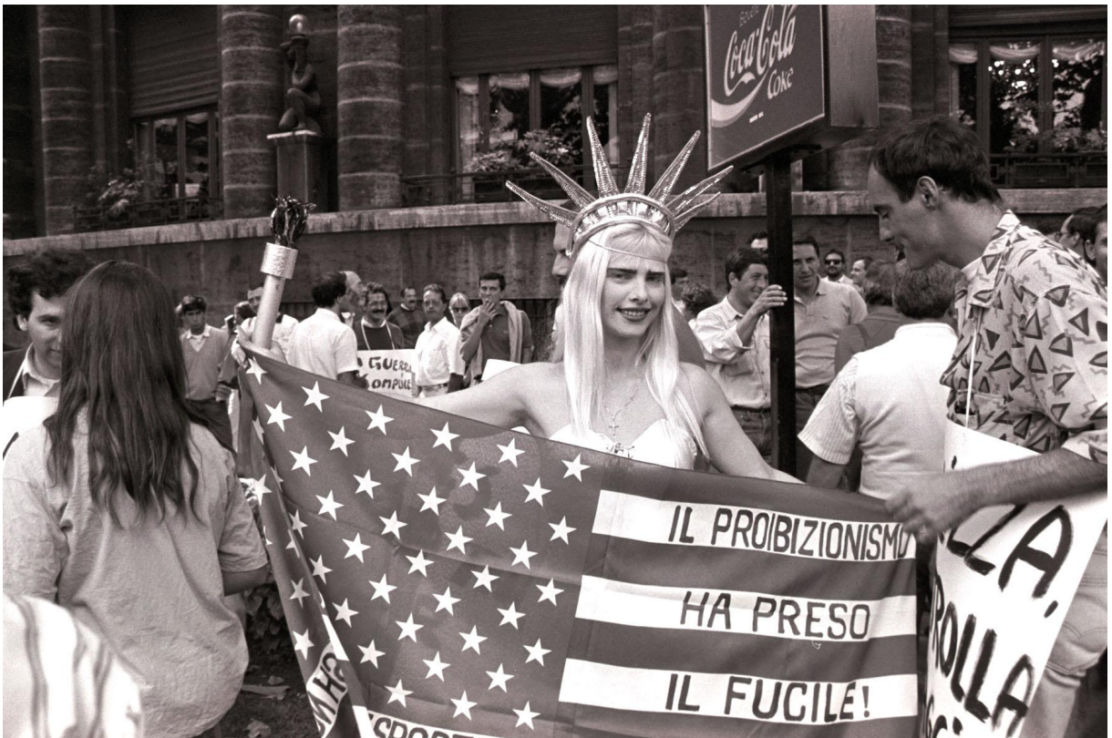
Ilona Staller mielenosoituksessa vuonna 1989.

Tyttöys määritellään usein asioiden kautta mitä ei saa tehdä kun taas poikuus asioiden joita saa tehdä. Tyttöys on tietynlaista ja sen voi menettää kuten neitsyyden voi menettää. Se on jotain mitä menetettyään ei enää voi saada takaisin. Tytöt ovat yhteiskunnassa usein enemmän kontrollin alaisina ja heille on usein eri säännöt kuin pojille. Esimerkiksi tyttöjen seksuaalikäyttäytymiselle on eri normit kuin poikien seksuaalikäyttäytymiselle. Olen kuitenkin iloinen että sukupuoleen kohdistuvaa kaksinaismoralismia on nostettu viime vuosina koko ajan enemmän pöydälle mediassa. Nousevan seksiposiitiivisen naisen nautinnon tärkeyden esille noston ansiosta tilanne on nyt vahvasti menossa parempaan suuntaan. Yksi suurimmista esikuvistani onkin Ilona Staller, italialainen pornotähti, muusikko ja poliitikko taiteilijanimeltään Cicciolina. (Muthesius, 1992.) Hän on tyyli-ikonini ja vapaan seksuaalisuuden puolestapuhuja.