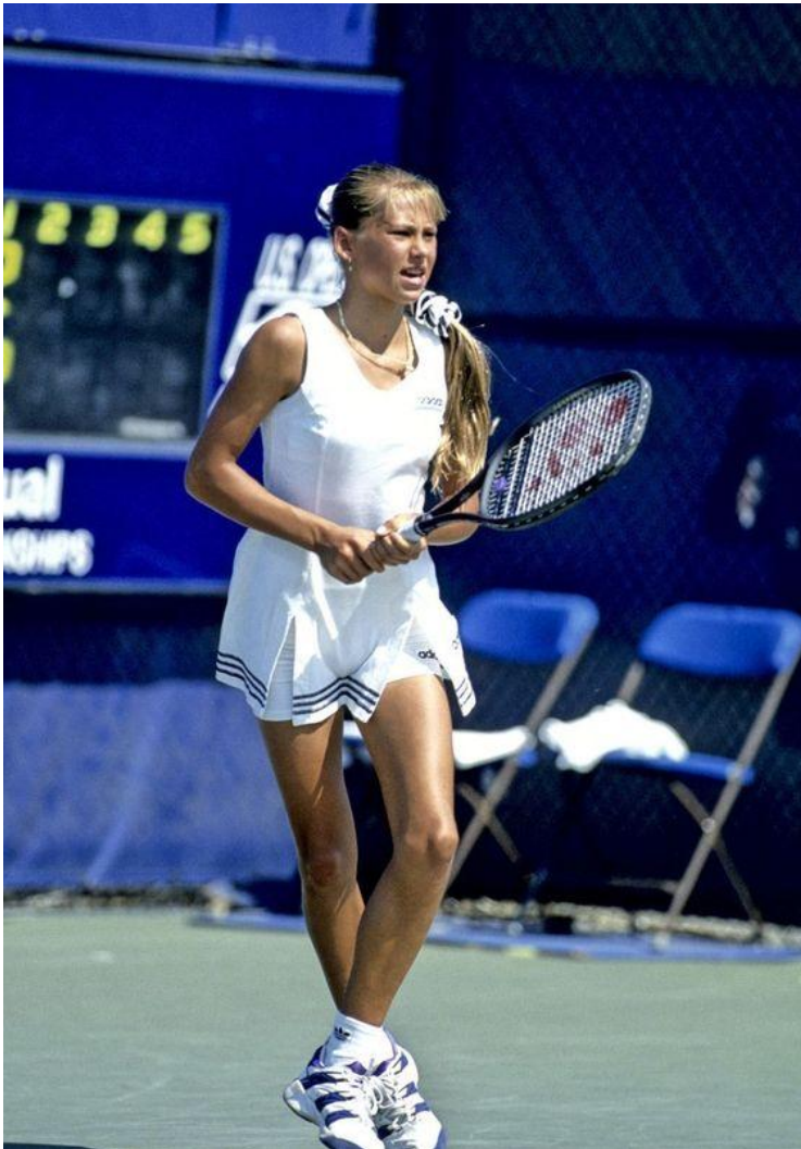
2000-luvun vaihteen Anna Kournikova sinivalkeisessa asussa Adidaksen sponsoroimana.

sukupuolentutkimuksen, yhteiskuntatieteiden ja elokuva- ja mediatutkimuksen aloille. Olen nykytaiteilija ja työskentelen performanssin, videon ja maalauksen parissa. Minulle on ominaista kollaasimainen työskentely, jossa luon erilaisia kokonaisuuksia eri medioita yhdistelemällä. Työskentelyni ytimessä ovat identiteetti, kuluttajuus ja jäljentäminen.