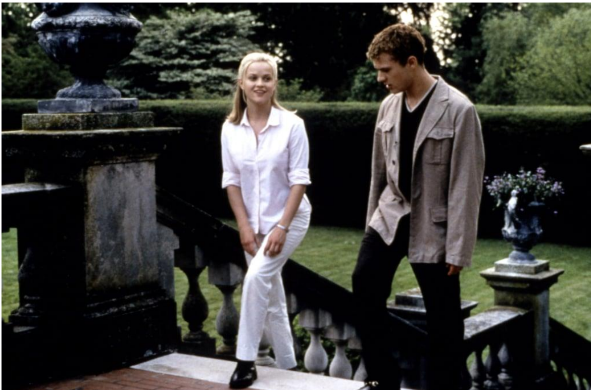
Kuvakaappaus Julmia aikeita (1999) elokuvasta, jossa useaan otteeseen kokovalkoiseen pukeutunut Reese Witherspoon näytteli terävä-älyistä Annette Hargrovea; lukion rehtorintytärtä joka on päättänyt pysyä neitsyenä avioliittoon asti.

“Maailman vanhin tennisturnaus Wimbledon on monella tapaa perinteitä vaaliva turnaus, esimerkiksi peliasun tulee yhä olla pääsääntöisesti perinteisen valkoinen. Viime kesänä pelaajille annettujen ohjeiden mukaan "valkoiseen ei kuulu luonnonvalkoinen eikä kerma". Jos asussa on muuta väriä kuin valkoista, saa sitä olla korkeintaan yhden somistuksen verran ja somistus saa olla korkeintaan sentin levyinen. Sääntö valkoiseen pukeutumisesta kattaa myös päähineet ja kengät. "Valkoista, valkoista, täysin valkoista. Mielestäni se on hyvin tiukkaa. Henkilökohtainen mielipiteeni on, että se on liian tiukkaa", kuvaili Wimbledonin useamman kerran voittanut Roger Federer viime kesänä.” (HS, 29.6.2015)