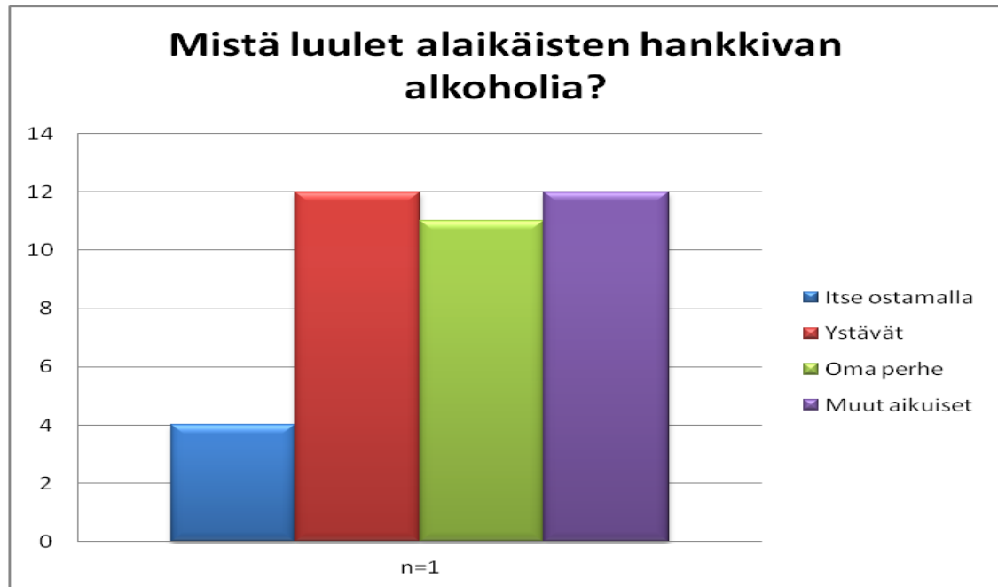
KUVIO 2 Mistä luulet alaikäisten hankkivan alkoholia?

Kolmas kysymys käsitteli keinoja puuttua alkoholin välittämiseen alaikäiselle. Viisi vastaajaa ei osannut kuvailla minkäänlaisia puuttumiskeinoja. Peräti 8 vastaajaa ilmoitti, että valistuksella voitaisiin parhaiten estää alkoholin välitystapauksia. Kolme vastaajaa koki vanhempien tiukan kasvatuksen ja perheen yhdessäolon sekä vanhempien valvonnan estävän nuorta saamasta alkoholia. Välittämiseen puuttumisen koki vaikeaksi kolme vastaajaa. Viisi vastaajaa lisäisi nuorelle aiheutuvien alkoholin haittavaikutuksien näkyvyyttä mainonnan keinoin. Kolme vastaajaa lisäisi välitystapahtumien valvontaa. Kaksi vastaajaa puuttuisi välittäjän toimintaan esimerkiksi ”julkisesti nöyryyttämällä” ja ”ripittämällä” heitä. (KUVIO 3.)