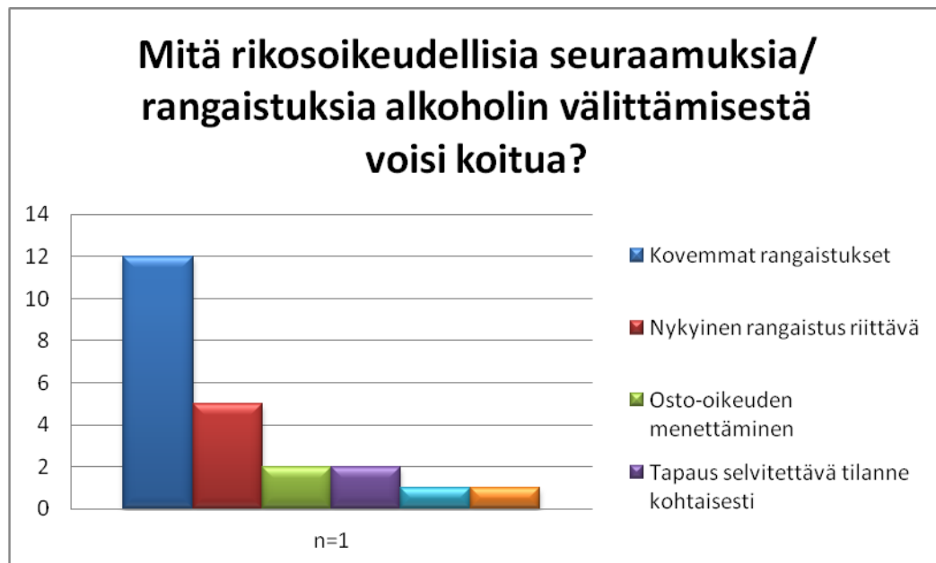
KUVIO 4 Mitä rikosoikeudellisia seuraamuksia/ rangaistuksia alkoholin välittämisestä voisi koitua?