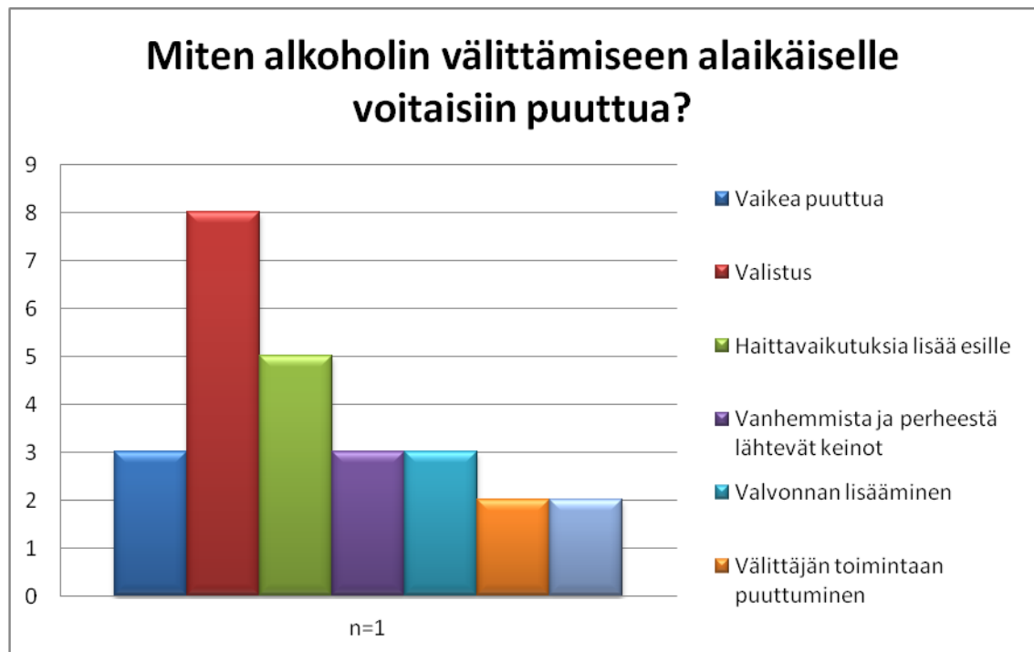
KUVIO 3 Miten alkoholin välittämiseen alaikäiselle voitaisiin puuttua?

Alkoholin välittämisestä koituvia rangaistuksia riittävinä piti viisi vastaajaa. Kovempia rangaistuksia oli vaatimassa 12 haastatteluun osallistujaa. Alkoholin osto-oikeuden eväämistä ehdotti kaksi vastaajaa. Nykyistä rangaistusta täysin turhana piti kaksi vastaajaa. Kaksi vastaajaa selvitti että välittämistilanteet tulisi käsitellä tapauskohtaisesti, esimerkiksi alkoholin välittämistä 17-vuotiaalle ei pidetty niin pahana kuin vaikkapa 12-vuotiaalle. Yhden vastaajan mielestä välittämiseen tulisi puuttua ilman rangaistuksia. Yhden vastaajan kanta oli, että rikesakottaminen voisi jopa provosoida välittämään. (KUVIO 4.)