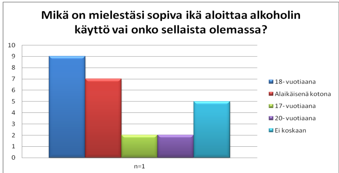
KUVIO 1 Milloin on mielestäsi sopiva ikä aloittaa alkoholin käyttö vai onko sellaista olemassa?

Useimmat vastaajista olivat sitä mieltä, että alkoholin käyttö tuli aloittaa täysi-ikäisyyden saavuttamisen jälkeen. Lähes yhtä paljon kannatusta saivat kuitenkin alaikäisen alkoholikokeilut kotona vanhempien valvonnassa.