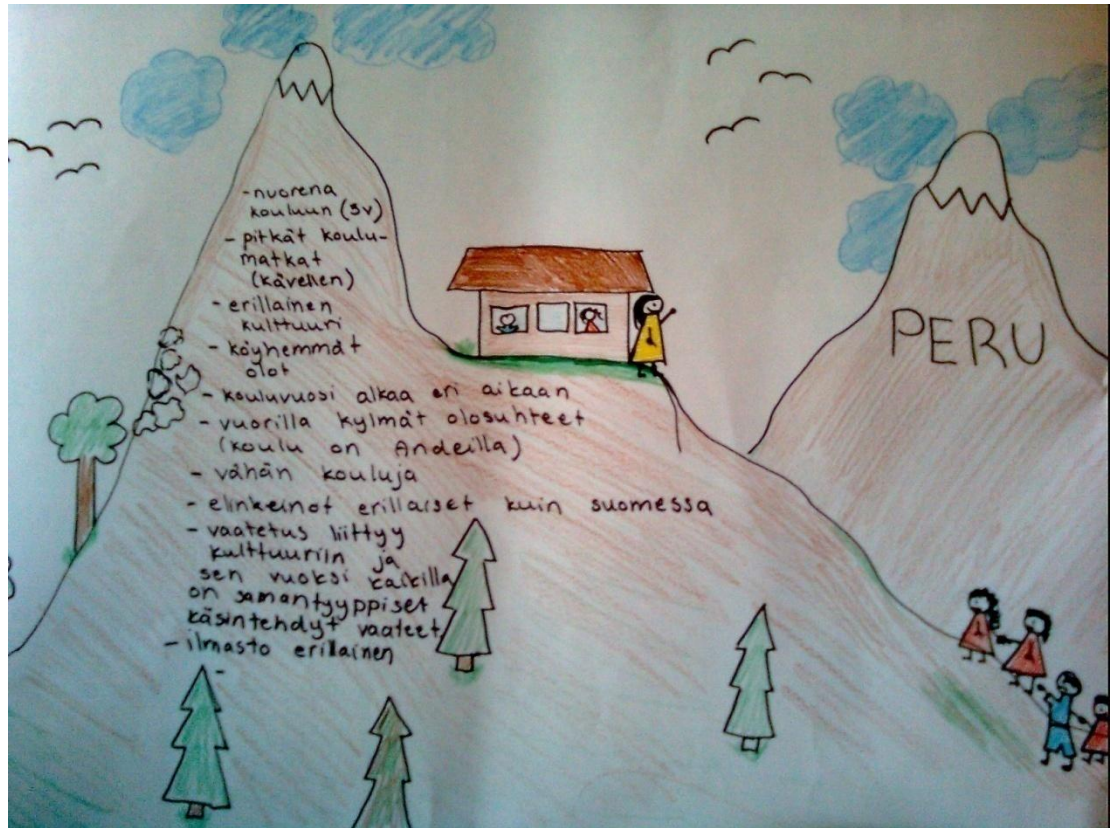
KUVIO 4. Nuorten tuotos Perun koulunkäynnistä

Tehtävissä oppilaiden tuottamissa tuotoksissa ilmeni monenlaisia ennakkoluuloja (liite 4). Esimerkiksi jotkut oppilaista pitivät muslimeja terroristeina. Tehtävän B koulunkäyntiesityksistä saattoi päätellä, että oppilaat olivat muistaneet paljon yksityiskohtia ja kirjanneet niitä ylös.