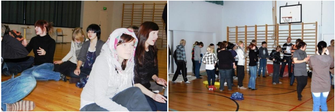
KUVIOT 5 & 6. Draamatarinan vaiheita: pakolais-Joen syntymäpäivät ja pakomatka. (Kurkinen 2009.)

musiikin ja kertoi että Joen on kriisin vuoksi paettava kotimaastaan äitinsä kanssa. Joe ehti kirjoittaa kirjeen tuntemuksistaan ja hyvästeistään ystävälleen Johnille, jonka jokainen oppilas kirjoitti itse. Paon aikana osa oppilaista eläytyi sotilaiden rooliin ja pyrki vaikeuttamaan muiden pakomatkaa. Matka päättyi liikuntasalin verhoilla peitettyyn lavaosaan pakolaisleiriin, jossa oli roskia ja teemaan sopivaa musiikkia.