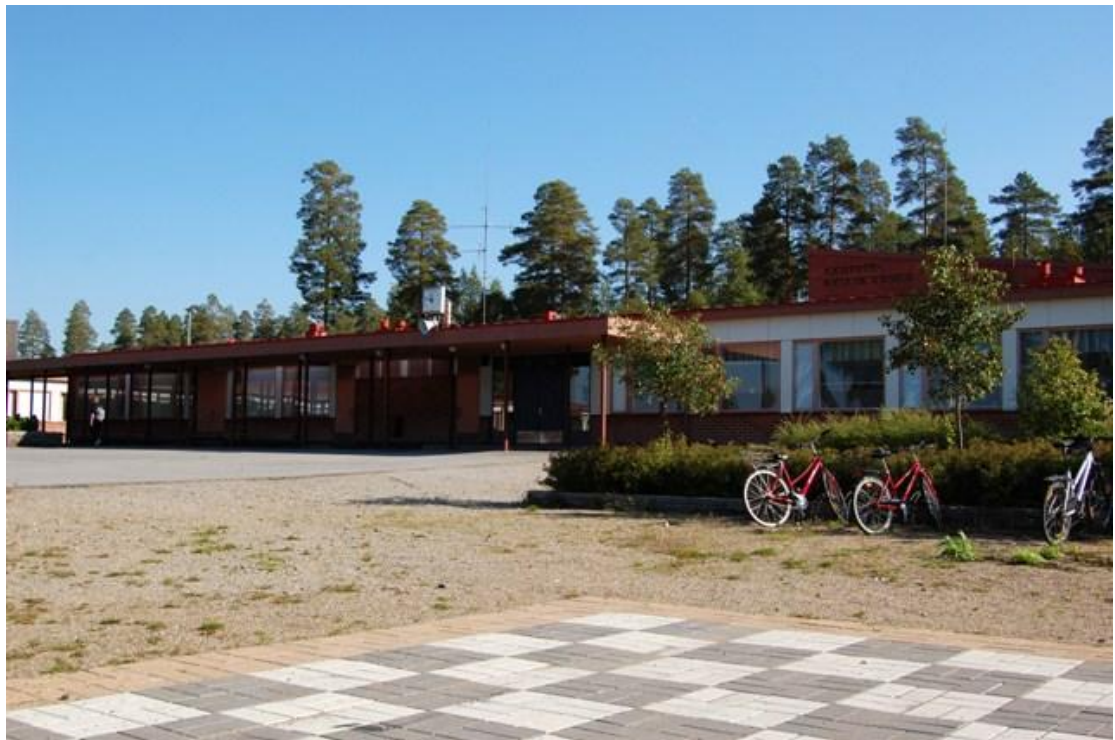
KUVIO 1. Kauppis-Heikin koulu (Partanen 2009)

Kauppis-Heikin koulun keskeiset kasvatusperiaatteet ovat arvostaminen, vastuullisuus, oikeudenmukaisuus sekä tasavertaisuus. Näitä periaatteita toteutetaan kaikessa koulun toiminnassa ja sen kehittämisessä. Tärkeää on myös yhteisvastuullisuus, joka tarkoittaa sitä, että jokainen on vastuussa yhteisön jäsenten hyvinvoinnista ja toisistaan. Koulun internetsivulla kerrotaan myös koulun arvoista. Kauppis-Heikin koulun ”pedagogiset arvot pohjautuvat konstruktivistiseen ja elämykselliseen oppimiseen”. Nämä arvot sopivat hyvin toimintapäivässä toteutettavan draamakasvatuksen aihepiiriin. (Kauppis-Heikin koulu 2009b.)