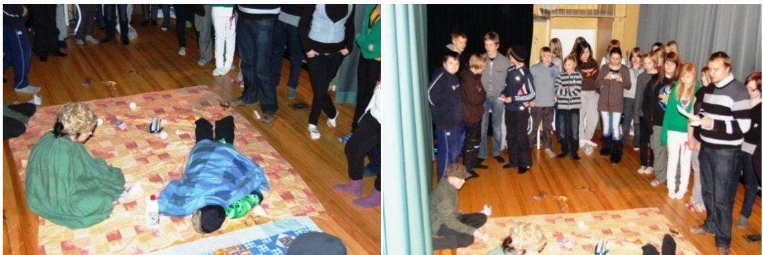
KUVIOT 7 & 8. Draamatarina: Pakolaisleirielämää. (Kurkinen 2009.)

Tarinan edetessä ohjaaja kertoi jatkuvasti mitä tapahtuu ja ohjasi oppilaita eläytymään ja improvisoimaan. Pakolaisleirin jälkeen oppilaat pääsivät Suomeen vastaanottokeskukseen. Ohjaaja kertoi, että Suomessa Joen ja hänen äitinsä oli vaikea sopeutua uuteen kulttuuriin ja että kriisin aiheuttamat traumat vaivasivat luonnollisesti mieltä. Joe oli lopulta 16-vuotiaana kadonnut äkillisesti ja hänen kohtalostaan ei kukaan tiennyt mitään. Tämän jälkeen ohjaaja aloitti loppukeskustelun pohtimalla oppilaiden kanssa, olisiko Joen opettaja, koulukaveri tai äiti voinut auttaa Joeta selviytymään. Lopuksi oppilaat lukivat vielä pienissä ryhmissä toisilleen aikaisemmin Johnille kirjoittamansa kirjeet.