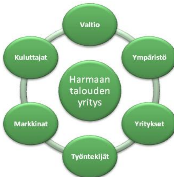
Kuva 1. Harmaan talouden vaikutuspiiri (Harmaa talous 2011).