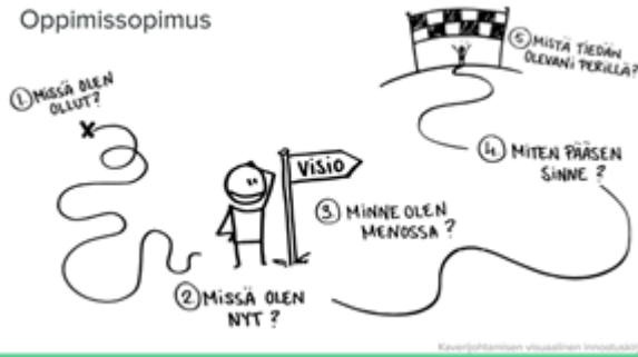
KUVA 2. Oppimissopimus.

taidon kehittymiselle. Tiimivalmennuksessa tähän dialogin ja vuorovaikutuksen lisäämiseen käytetään yhtenä menetelmänä ”oppimissopimusta”. Siinä jonka jokainen tiimin jäsen tekee ja avaa omat tavoitteet ja unelmat kaikkien muiden tiimiläisten nähtäville. Työkalun tarkoituksena on sitouttaa ja luoda ymmärrystä ympäröivistä tiimin jäsenistä ja auttaa luomaan merkitystä opinnoille sekä pohtimaan omaa matkaa kohti henkilökohtaista tavoitetta.