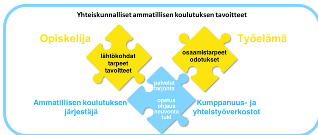
KUVA 1. Laadukas yksilöllinen opintopolku. (mukaellen: Yhdessä Parasta hanke, OPH 2020)

Oppilaitosorganisaatioiden ja opettajan pedagoginen toiminta on siis puuttuva palanen opiskelijan ja työelämän odotuksien, toiveiden ja tarpeiden yhteensovittamisessa. Muutoksen keskellä on haettava voimavaroja organisaation ja työyhteisön toimintatapojen kehittämisestä. Opettajuuden muutos vaatii aina myös johtamiskulttuurin muutoksen. Oppilaitoksen käytännöt, joissa mahdollistetaan osallistaminen, yhteisöllisyyden lisääminen, dialogi ja tiimityö luovat edellytyksiä opettajuuden vaatimuksiin vastaamiselle. Organisaatiokulttuurin muutos vaatii koko henkilöstön muutosajattelua – keskustelua ja reflektiota siitä, millä toimintatavoilla ja mitä muuttamalla toteutamme parhaiten opiskelija- ja työelämälähtöistä palvelua. Organisaation turhat, päällekkäiset, tehottomat ja byrokraattiset käytännöt on syytä uudistaa.