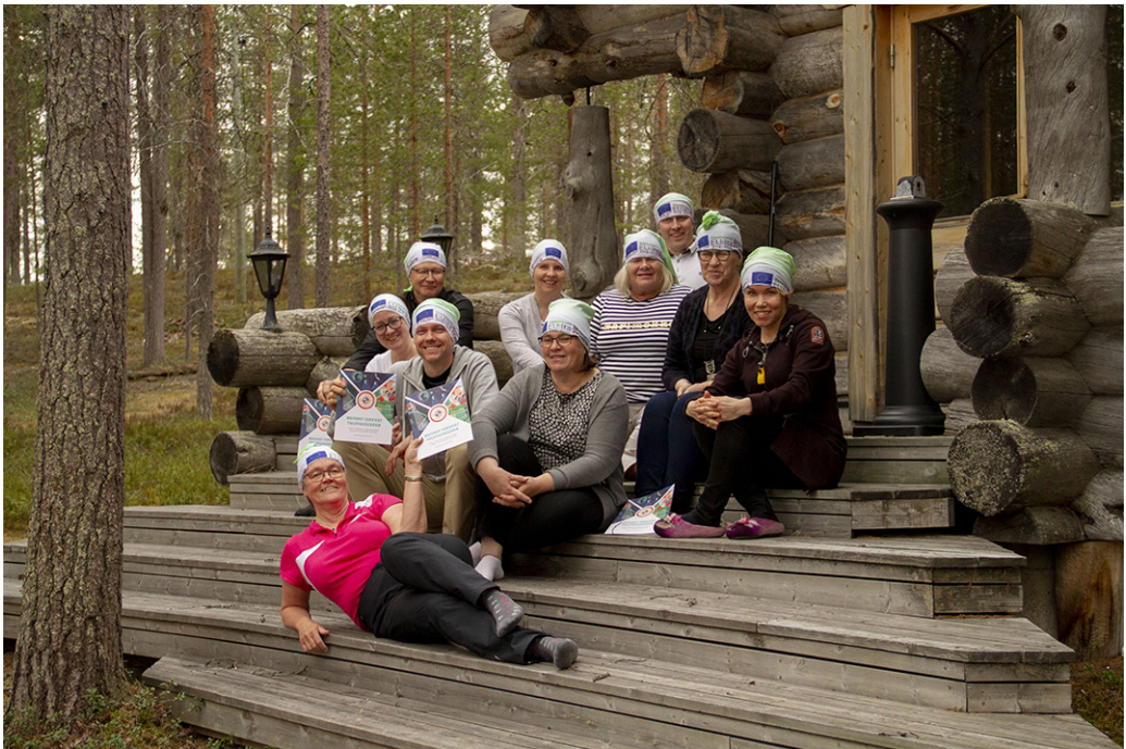
KUVA 1. ToTYk:n hanketoimijat työpajassa Kuusamossa kesäkuussa 2019.

Yhteinen hanke oli selkeä jatkumo edellisessä hankkeessa alkaneelle yhteistoiminnalle. Hanke suunniteltiin yhteistyössä kaikkien osatoteuttajien kesken. Pohjois-Pohjanmaan laajassa mutta harvaan asutussa maakunnassa yhteistyön ja verkostojen merkitys korostuu myös yrittäjyyskasvatuksessa. Kolmevuotisen hankkeen osallistajat edustavat opetussektoria perusopetuksesta korkeakoulutukseen. Mukana olivat Kuusamon kaupunki, ammatillisen koulutuksen järjestäjät Brahe, JEDU ja OSAO, Centria-ammattikorkeakoulu ja Oulun ammattikorkeakoulu sekä Oulun yliopisto. Oulun yliopistossa hanketta toteuttivat Kerttu Saalasti Instituutti ja kasvatustieteiden tiedekunta. Hankkeessa työskenteli kolmen vuoden aikana yhteensä 21 eri henkilöä, yhteenlaskettu työpanos 123 henkilötyökuukautta.