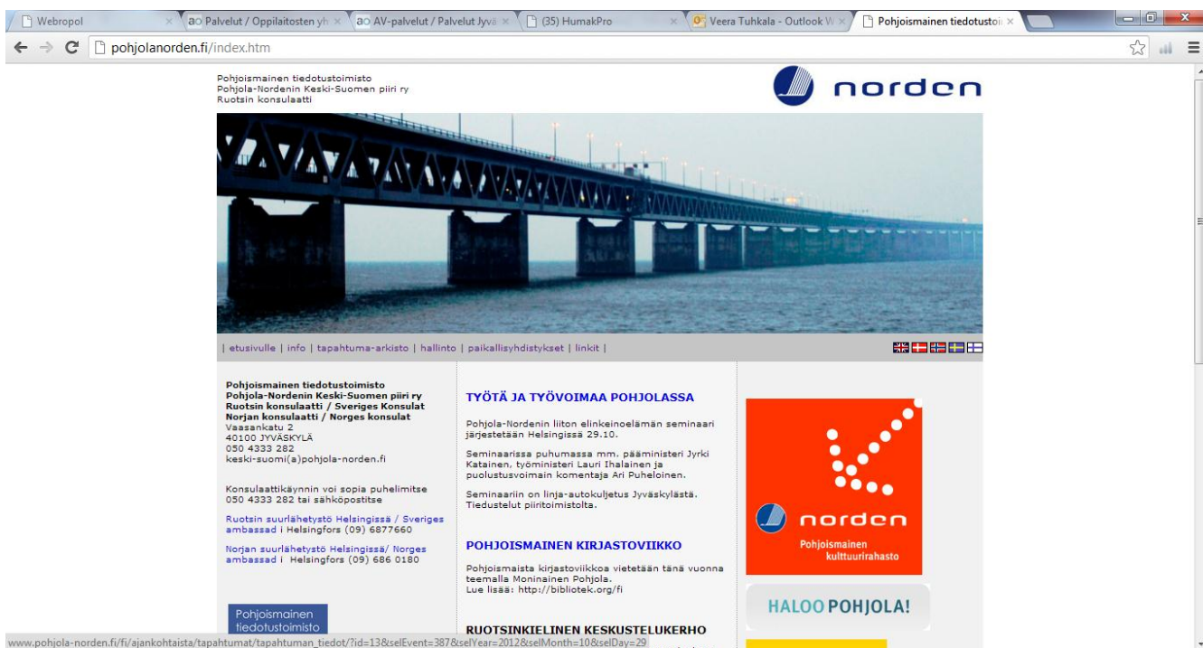
Kuvio 1: Pohjola-Nordenin Keski-Suomen piirin internet – sivujen ilme

Toki sivusto on teknisesti toimiva ja soveltuu arkikäyttöön hyvin. Sieltä löytyvät perustiedot ja etusivun asetelut ovat kunnossa. Sivustolla on kuvia ja värejä ja yläotsikot toimivat ja tulevista tapahtumista löytää hyvin tietoa. On myös listattu monipuolisesti, missä kaikissa asioissa toimiston puoleen on mahdollista kääntyä.