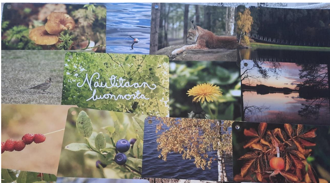
Kuva 2. Nautitaan luonnossa -kortit.

Luontoharjoitusten jälkeen kuuntelimme runoitku Emosen. Esityksen jälkeen ohjeistettiin Äänellä itkun kirjoitusharjoitus. Keskustelu oli vilkasta ja rönsyilevää. Sovimme ryhmän toiveesta, että seuraavalla kerralla pidämme luontotietovisan. Muistelemista auttoivat käytetyt harjoitukset, jotka koettiin kiinnostavina ja vaikuttavina. Ryhmätapaamisen jälkeen tehdyn kyselyn (liite 6) kokemukset on koottu taulukkoon 4.