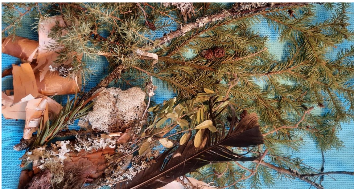
Kuva 1. Green Care -harjoituksen luontomateriaaleja.

puhuta, kaikki saavat puhua, sopiva kriittisyys ja myönteisyys. Käytimme äänen meri -harjoitusta taukojumppana. Green Care -harjoituksessa käytimme luontomateriaaleja (kuva 1), joita ryhmän jäsenet katselivat, hypistelivät ja valitsivat sen, joka herätti muiston.