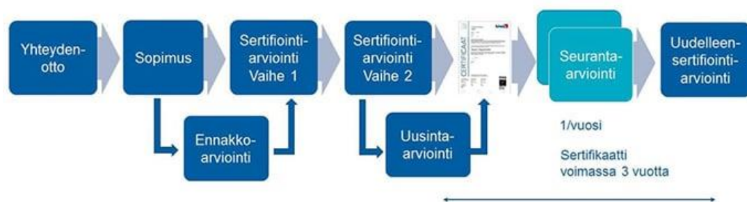
Kuva 9 Auditointiprosessi. (Kiwa, n.d.)

Sertifikaatin myöntämisen jälkeen tulee tehdä seuranta-arviointeja vähintään kerran vuodessa. Seuranta-arviointi raportoidaan samalla tavalla, kuin sertifiointiarviointi. Mikäli todetaan vakava poikkeama voi seurauksena olla sertifikaatin määräaikainen peruuttaminen. Uudelleensertifiointi tehdään aina viimeistään 36 kuukauden kuluttua sertifiointiarviointista. Uudelleensertifiointin tarkoituksena on varmistaa, että johtamisjärjestelmä on jatkuvasti sertifikaatin vaatimustenmukainen. (Kiwa, n.d.)