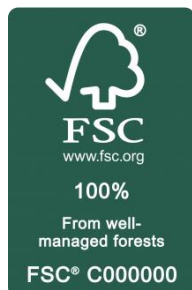
Kuva 7 FSC 100 %