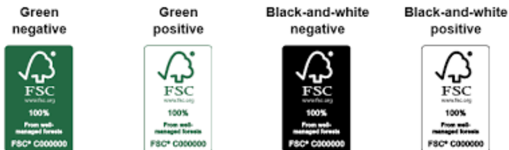
Kuva 4 FSC-tavaramerkin väri vaihtoehdot. (FSC-STD-50-001 2017, 14)

FSC:n logolla on neljä eri väri vaihtoehdot: