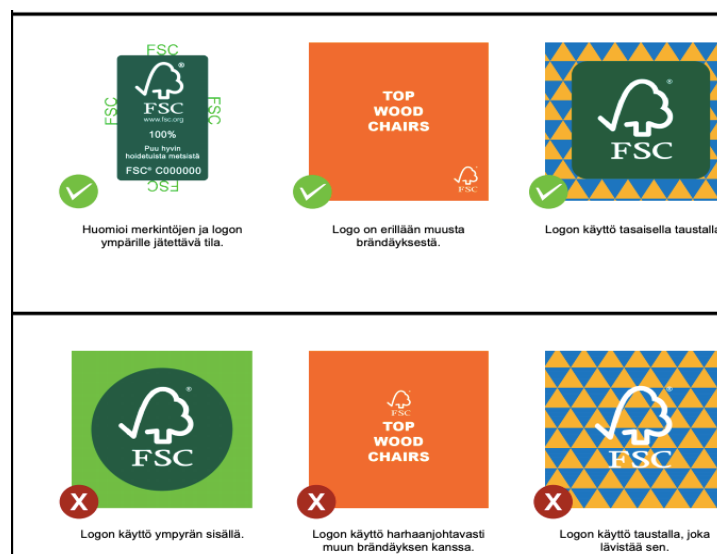
Kuva 5 FSC-merkin sijoittelu. (Tavaramerkin pikaopas sertifiikaatin haltijoille 2019, 11)

FSC-merkin sijoittamisessa tulisi huomioida, ettei merkkiä sijoita valokuvan tai vahvasti kuviollisen kuvan päälle. Kuviollisen kuvan päällä merkki voi sekoittua taustaan tai aiheuttaa sekaannusta siitä, mitä merkki koskee.