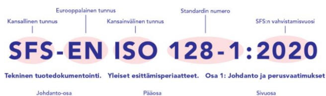
Kuva 1 Standardin tunnus (Suomen standardisoimisliitto, n.d.)

Standardit helpottavat arkea luomalla yhteisiä vaatimuksia, suosituksia ja ominaisuuksia tuotteille ja palveluille sekä niiden valmistukselle. Standardi on asiakirja, joka sisältää tietyn aiheen vaatimukset ja ohjeet. Rakenteeltaan standardissa on ensimmäisenä alkusanat ja johdanto, jotka kertovat standardin taustoista. Tämän jälkeen kerrotaan, mihin standardia voi soveltaa ja mitä muita standardeja olisi hyvä käyttää. Lopuksi käsitellään termit ja standardin tärkein asia eli sen vaatimukset. (Suomen standardisoimisliitto, n.d.)