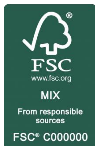
Kuva 8 FSC Mix (FSC www-sivut)