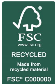
Kuva 6 FSC Recycled

FSC Controlled Wood on materiaali, joka on peräisin FSC-sertifioimattomista metsistä tai viljelmistä. Materiaalin on arvioinut FSC-akkreditoitu sertifiointielin FSC-ketjun tai FSC-valvotun puun vaatimusten mukaisesti. (FSC-STD-40-004, 2004, s. 9)