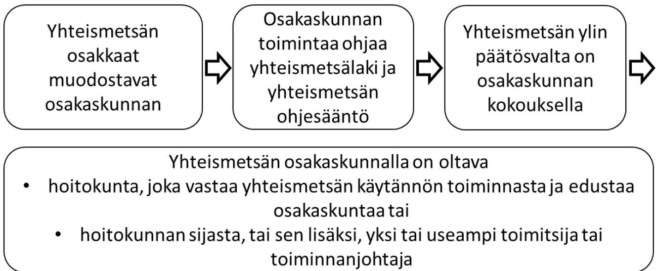
Kuvio 1. Yhteismetsän hallinto (soveltaen Havia 2017, 37–42).