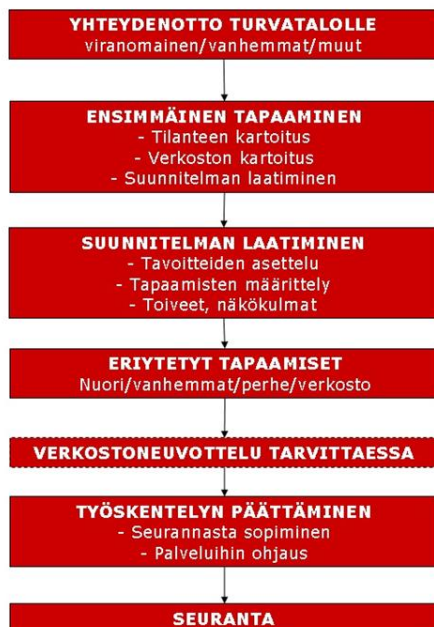
KUVIO 3. Perhehuoneen prosessi (Nuorten turvatalo 2012)

Sosiaali- ja terveysministeriön valvontatyöryhmän mukaan lastensuojelun sosiaalipalvelujen ostamisesta ei aina tehdä kirjallista, palvelun tuottajan ja sitä ostavan kunnan oikeuksia ja velvollisuuksia osoittavaa sopimusta. 72 Sopimusten puuttuminen vaikeuttaa valvontaa ja hankaloittaa palvelun laadun määrittämistä varsinkin ristiriitatilanteissa.