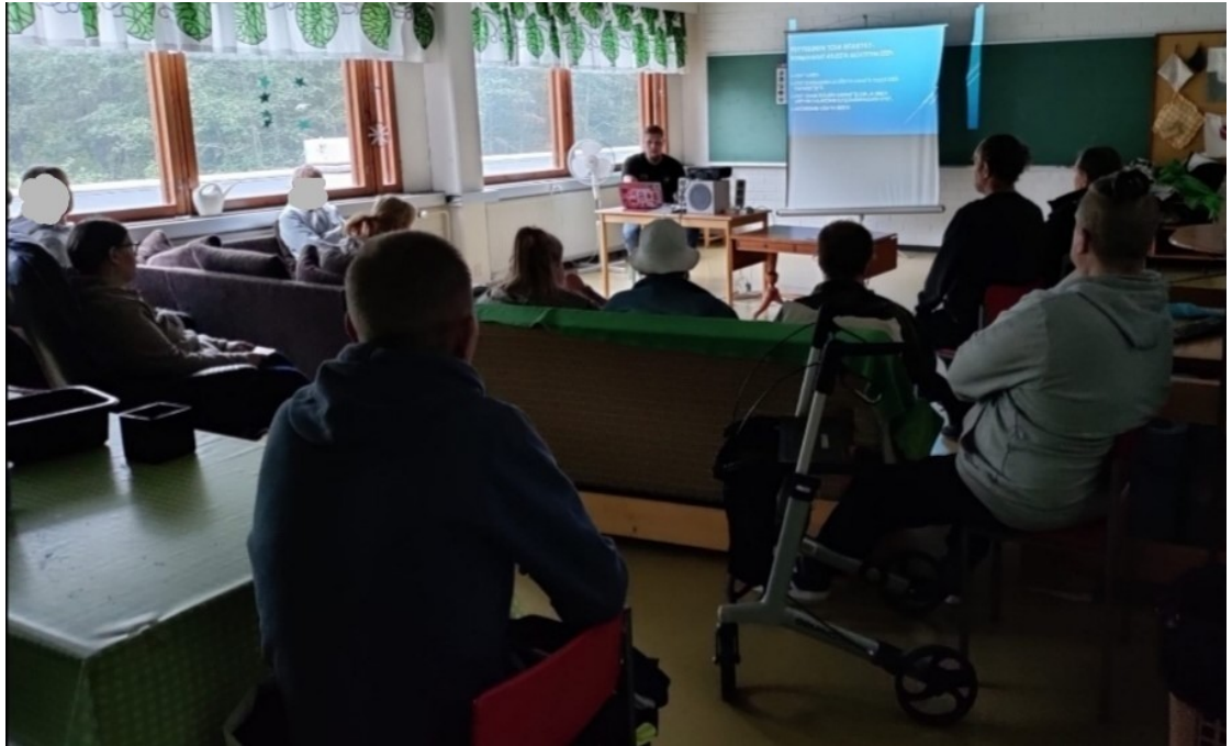
Kuva 5. Oppaan esittelyä.

Esitys (Kuva5) sujui luontevasti ja sain herätettyä keskustelua oppaan tiimoilta. Esitys kesti reilun puolen tunnin verran, sisältäen esittelyn jälkeisen keskustelun. Tarkoituksena olikin saada asukkaat osallistumaan oppaan esittelemiseen mahdollisimman aktiivisesti. Herättelin luentoon osallistuneiden asukkaiden tietoisuuden ja mielenkiinnon toimintakyvystä käymällä käsitettä lyhyesti lävitse. Tämän jälkeen käsittelin erikseen psyykkisen, fyysisen, kognitiivisen ja sosiaalisen toimintakyvyn. Esittelin oppaassa, mitä toimintoja eri osa-alueet pitävät sisällään ja millaisin toimin niitä pyritään Karhulan Kuntoutuskodilla tukemaan.