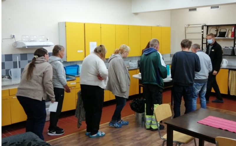
Kuva 6. Luennon jälkeinen kahvitilaisuus.

mentäessä ja kuinka otetaan tukea portaissa kulkiessa. Edellä mainittua ta- pahtumaketjua voidaan pitää jonkinlaisena onnistumisena, olihan sen tarkoi- tuksena herättää asukkaat pohdiskelemaan omaa toimintakykyään ja millai- silla keinoilla sitä pystyttäisiin tukemaan.