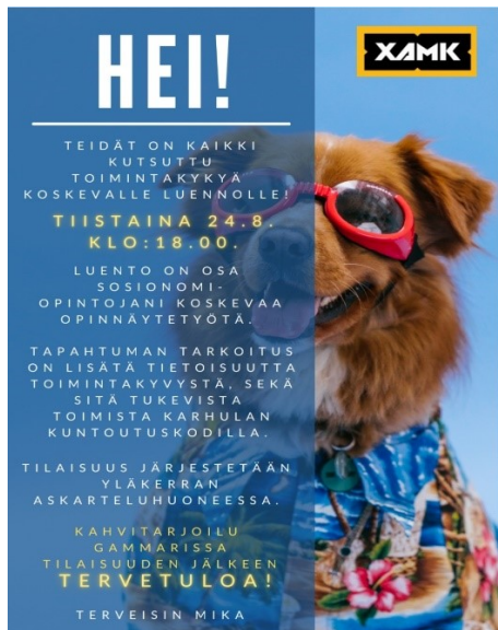
Kuva 4. Tiedote luennosta.

Oppaan esittely eteni suunnitelman mukaisesti. Olin tehnyt tapahtumasta ker- tovan tiedotteen (Kuva4), jonka asetin viikkoa ennen tapahtumaa näkyville palvelukeskuksen pääsisäänkäynnille sekä ruokalan oveen.