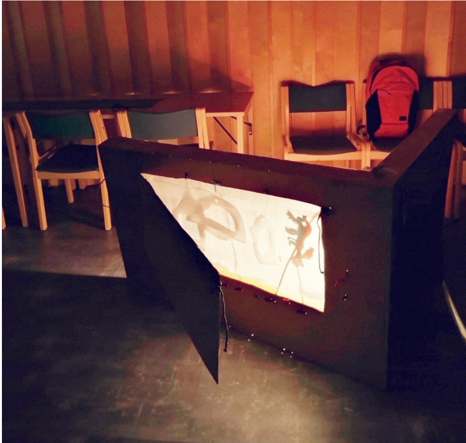
Kuva 2. Varjoteatterin näyttämö

Esityksen lopuksi lapset siirtyivät päiväkerhon huoneeseen ja istuivat paikoilleen. Kävimme läpi teatterin tarinan tapahtumia ja mistä lapset pitivät esityksessä. Keskustelua käytiin myös ohjaajien kanssa.