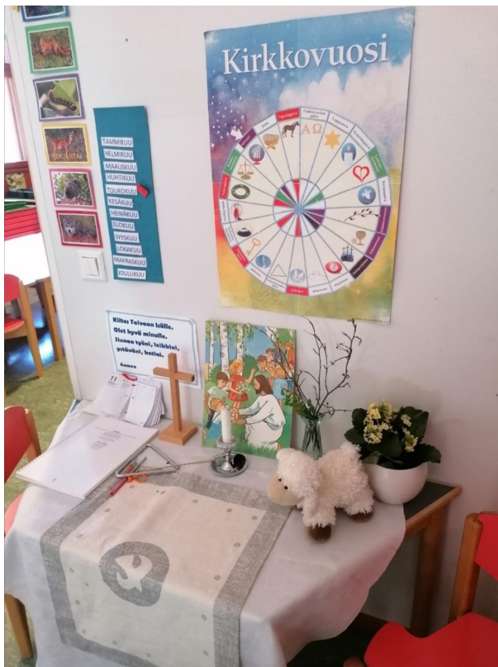
Kuva 1. Olarin päiväkerhon tila

on kaksi ohjaajaa. Tunnin ulkoilun jälkeen lapset menevät sisälle päiväkerhoon. Siellä heillä on pieni oppimistila, ruokapöydät ja leikkutilat. Ohjaajan keskustelevat lasten kanssa ja vastaavat kysymyksiin. Teemat ovat yleisiä ja myös uskonnollisia. Lapset laulavat ja tanssivat. Kun lapsella on omaa leikkiaika, heitä varten on tarjolla paljon erilaisia leluja, kirjoja ja lautapelejä. Lapsilla on mahdollisuus syödä kerhossa. Lapsi tuo kotoa välipalaa ja lounaan aikana jokainen syö omia eväitänsä. Ennen lounasta lapset rukoilevat ja kiittävät Jumalaa ruoasta ja elämästä. Kerhon päättyessä vanhemmat hakevat lapset sovittuun aikaan.