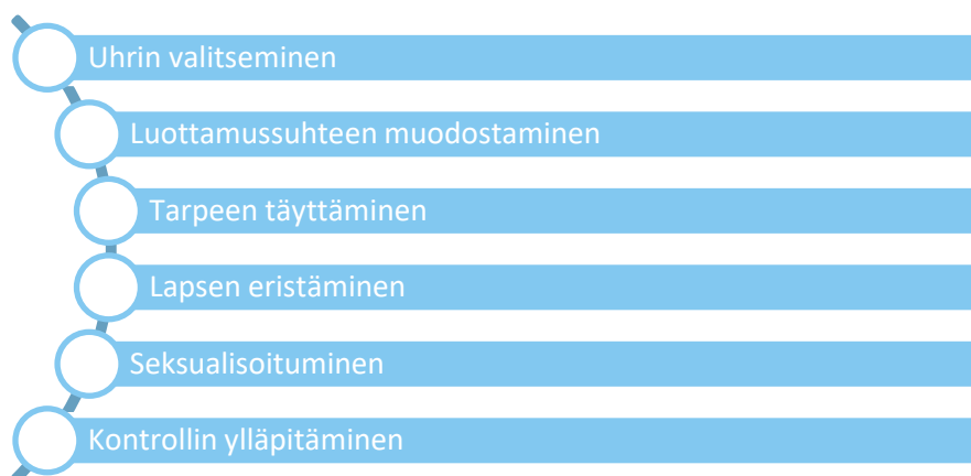
TAULUKKO 1. Groomingin vaiheet tiivistettynä. (MY child safety institute.)

Kun hyväksikäyttö on tapahtunut, tekijä pyrkii pitämään tämän hänen ja uhrin välisenä salaisuutena. Hyväksikäyttäjän kannalta on tärkeää, ettei nuori kerro asiasta muille, ettei hänen laittomat tarkoituksensa paljastu. (Pelastakaa lapset ry. 2011a, 16) Lasten voi olla vaikea luopua suhteesta sen tuomien lahjojen ja emotionaalisen tuen menettämisen myötä. (MY child safety institute.) Groomingin vaiheet on kuvattu tiivistettynä taulukossa (taulukko 1).