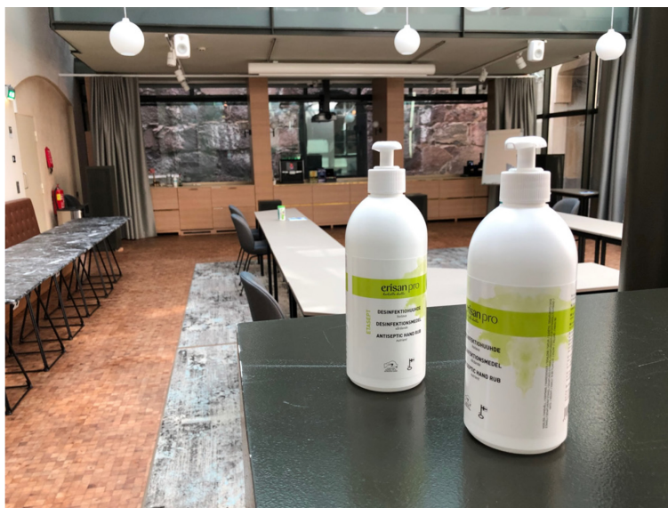
Kuva 2. Finanssivalvonnan kokoustila. Kokoustiloissa on vähennetty tuolien määrää, ja niihin on tuotu käsidesiä sekä pöytien puhdistusliinoja. Tässä tilassa on järjestetty koronapandemian aikana Finanssivalvonnan lehdistötilaisuudet.

Kymmenen hengen henkilömäärärajoitus oli mahdollista toteuttaa etenkin lehdistötilaisuuksissamme, koska yleensä toimittajia on ilmoittautunut paikalle alle kymmenen. Jos tilaan olisi tullut enemmän kuin kymmenen henkeä, olisimme vähentäneet oman väkemme määrää siten, että he olisivat siirtyneet seuraamaan tilaisuutta omilta työpisteiltään. Vastaavasti pelkissä virtuaalisesti järjestetyissä tilaisuuksissa kymmenen hengen rajoitusta pystyttiin noudattamaan siten, että varmistettiin, että tilassa ei samanaikaisesti ollut liikaa ihmisiä. Puhujat pysyivät tulemaan tilaan tarvittaessa vain oman puheenvuoronsa ajaksi.