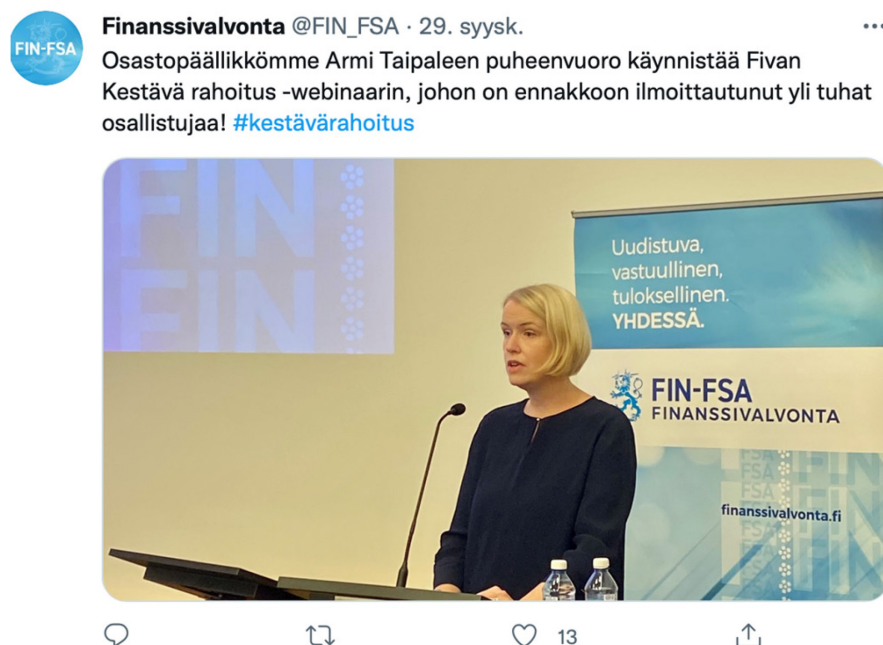
Kuva 3. Kestävä rahoitus -webinaari. Finanssivalvonnan Kestävä rahoitus -webinaari osoittautui suosituksi virtuaalitalaisuudeksi, jossa linjoilla oli yli tuhat osallistujaa.

saatavilla Finanssivalvonnan verkkopalvelussa. (Ks. Luku 8 Tallenteiden saavutettavuus.) Lisäksi tilaisuudelle haettiin lisänäkyvyyttä sosiaalisen median päivityksillä.