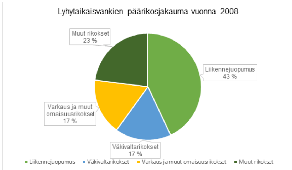
Kuvio 1. Lyhytaikaisvankien päärikosjakauma vuonna 2008 mukailien (Kivivuori & Linderborg, 2009, s. 18)

Kuvio 1 kuvastaa lyhytaikaisvankien rikostyyppijakaumaa, jossa merkittävä prosenttiosuus (43 %) on liikennejuopumus. Tämä kuvastaa päihteiden käytön ongelmallisuutta lyhytaikaisvankien keskuudessa. Suomalaisten rikollisuudesta ja rikoskäyttäytymisestä puhuttaessa onkin syytä tarkastella päihteiden merkitystä rikollisuuteen. Erityisesti alkoholilla on kiistaton yhteys rikolliseen toimintaan. Esimerkiksi alkoholin kulutusta ja väkivallan yhteyttä on tutkittu monissa maissa. Erityisesti Suomessa ja muissa Pohjoismaissa on havaittu alkoholin kulutuksen kasvattavan myös väkivallan määrää. (Kivivuori, 2008, s. 214; 216.) Kivivuoren & Linderborgin (2009) mukaan juuri lyhytaikaisvangit kärsivät päihteiden ongelmakäytöstä, jonka nähdään olevan tiiviisti yhteydessä rikoskäyttäytymiseen. Tätä teemaa käsittelemme lisää tutkimusten valossa luvussa 2.3.